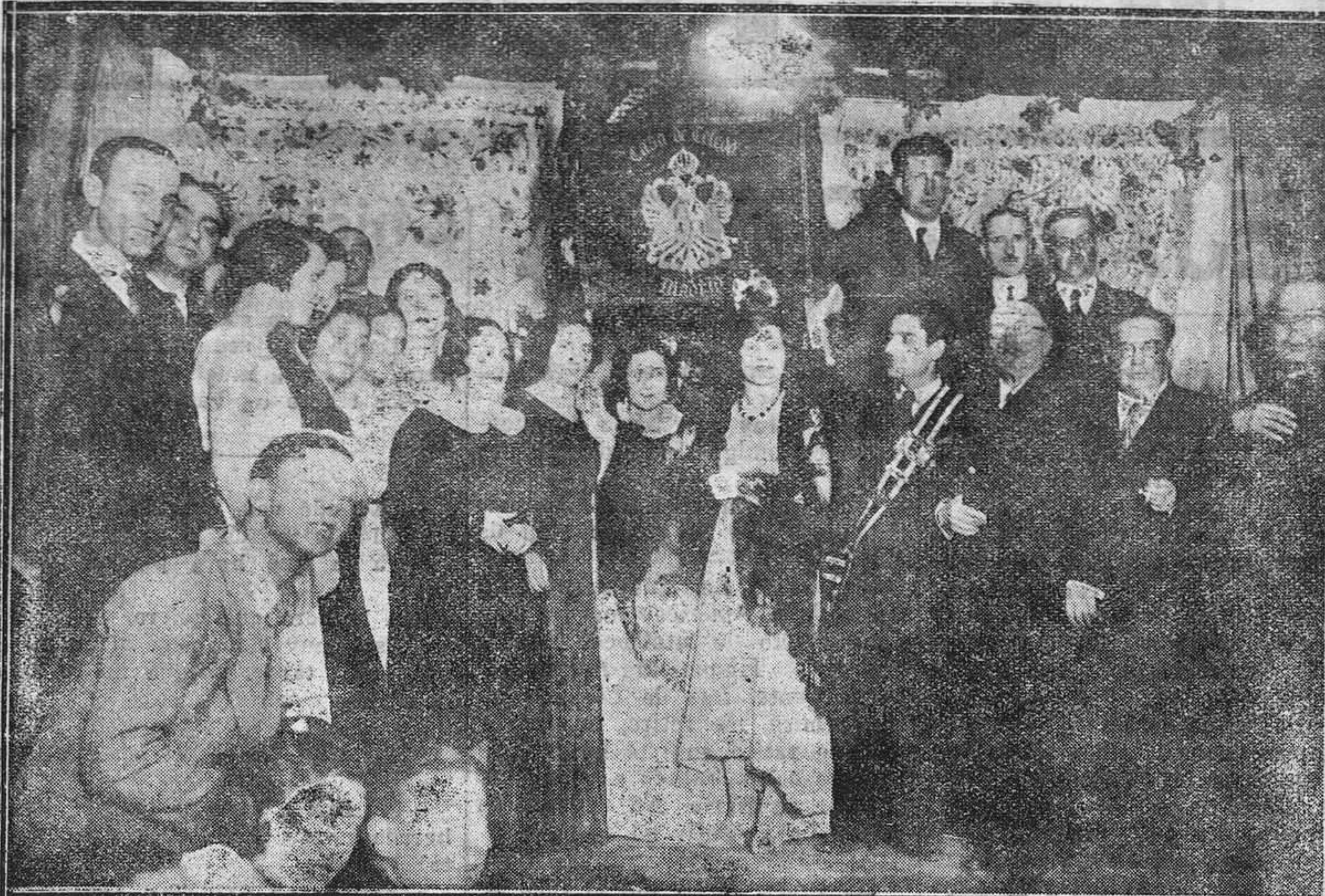
MADRID.—La colonia toledana de Madrid ha hecho entrega de una nueva bandera a la "Casa de Toledo".