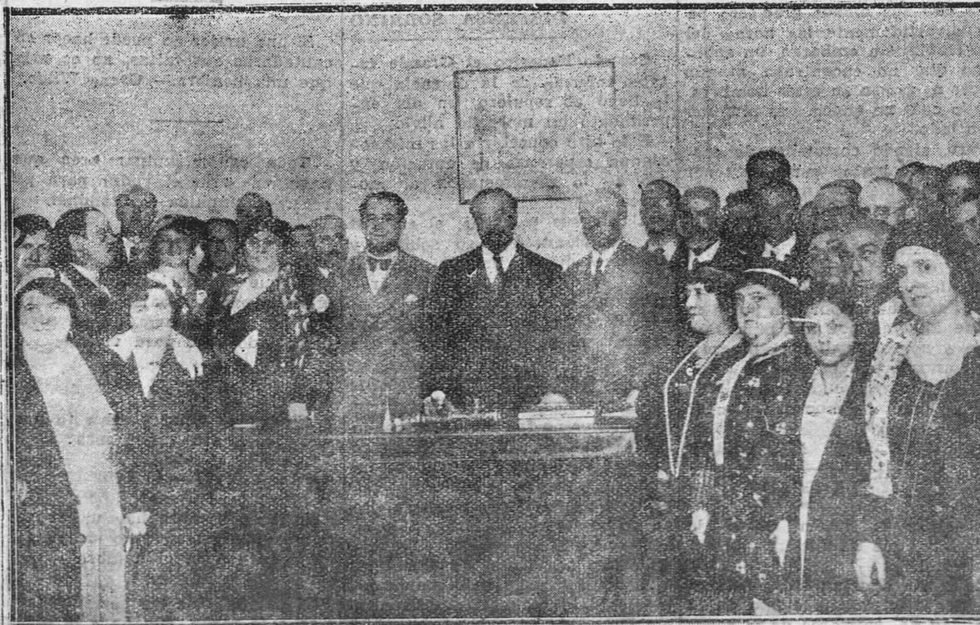
MADRID.—Con asistencia del ministro de Instrucción pública ha sido inaugurado el nuevo local social de la "Casa de los maestros de Madrid". (Foto Vidal).