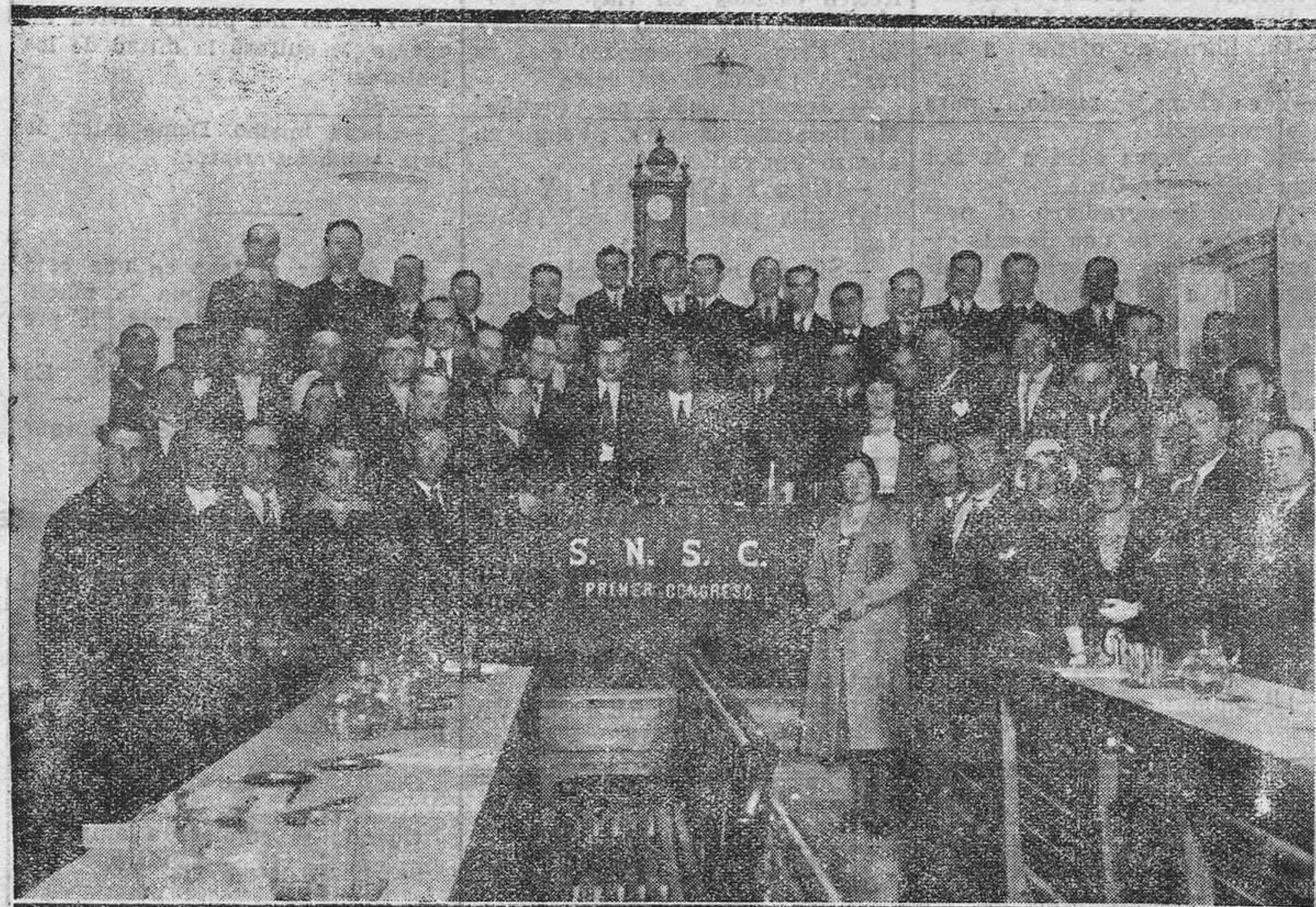
MADRID.—Sesión de apertura del I Congreso del Sindicato Nacional de Subalternos de Correos.