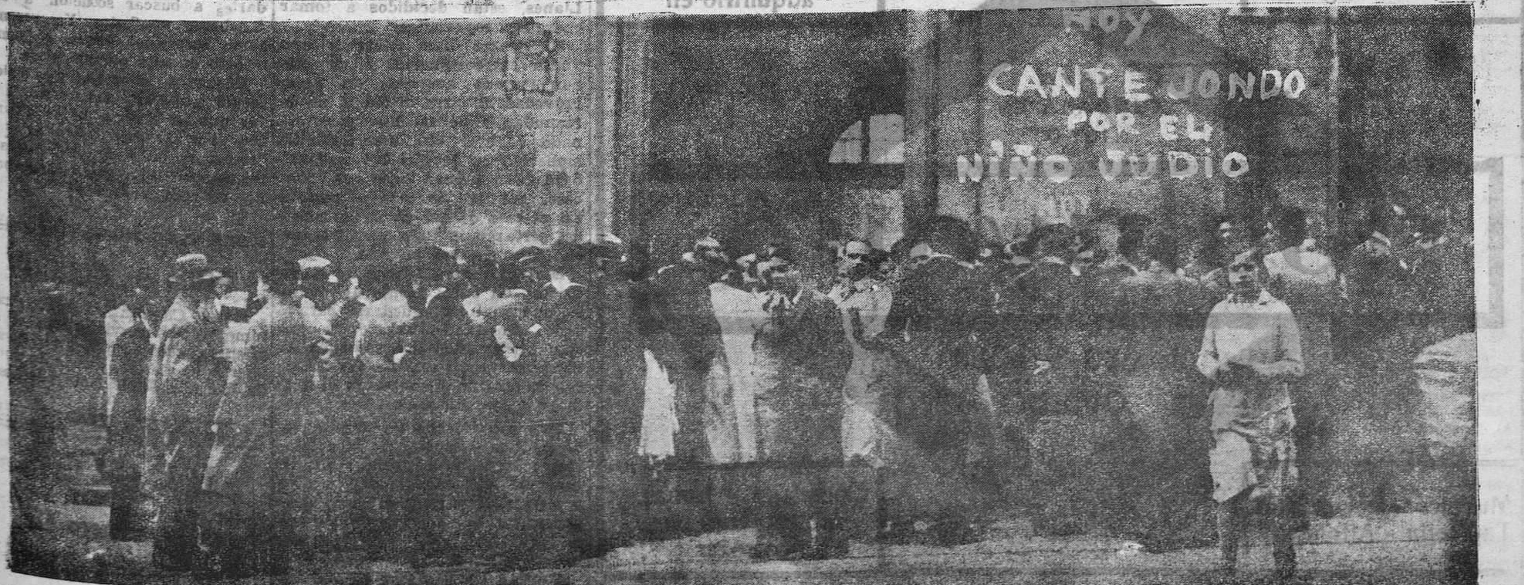
MADRID.—Grupo de estudiantes de Medicina en la puerta de la Facultad, donde organizaron una manifestación contra un decreto que prohíbe a los alumnos suspensos en junio volver a examinarse hasta enero.