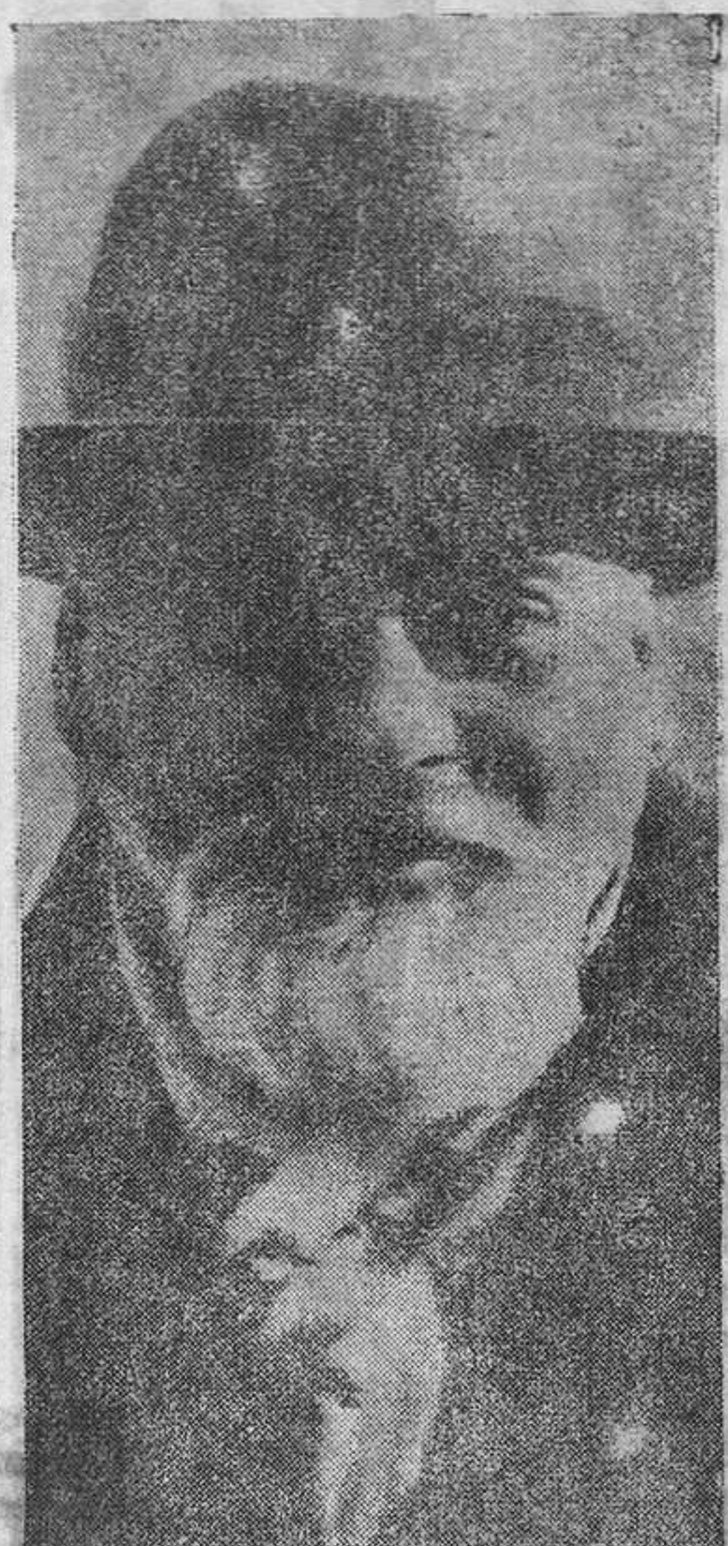
Al mismo tiempo que M. Paul Doumer, resultó herido el ilustre escritor M. Claude Farrera, que le acompañaba.

Todo esto se irá poniendo en claro en estos días a medida que se vayan reuniendo los partidos políticos, puesto que para la sesión que ha de celebrar el viernes próximo la Corporación se hará la designación de alcalde.