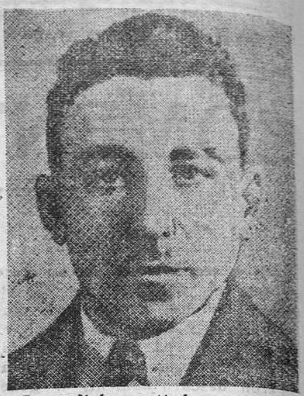
La policía continúa sus pesquisas.

El rumor público cree que el citado guarda barrera fué objeto de un asesinato.