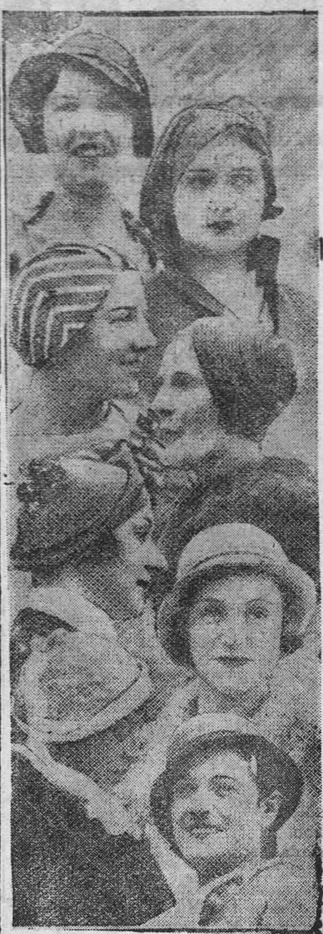
Algunos modelos de sombreros para la primavera.