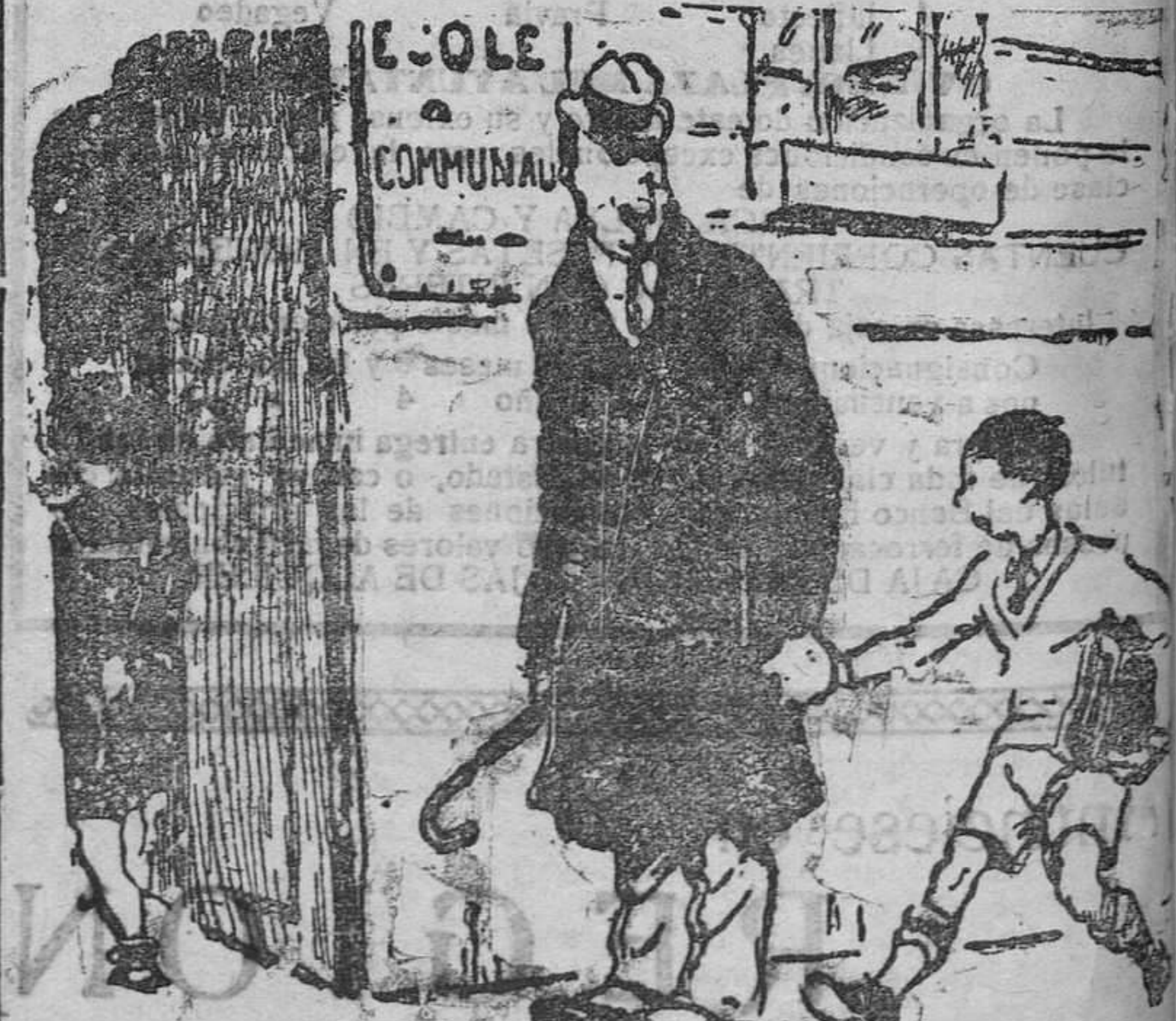
PRINCIPIO DE CURSO.—Dime, papá: las escuelas. ¿no sue- los alguna vez querían, como los Bancos?

No se devuelven los originales ni se sostiene correspondencia sobre los mismos.