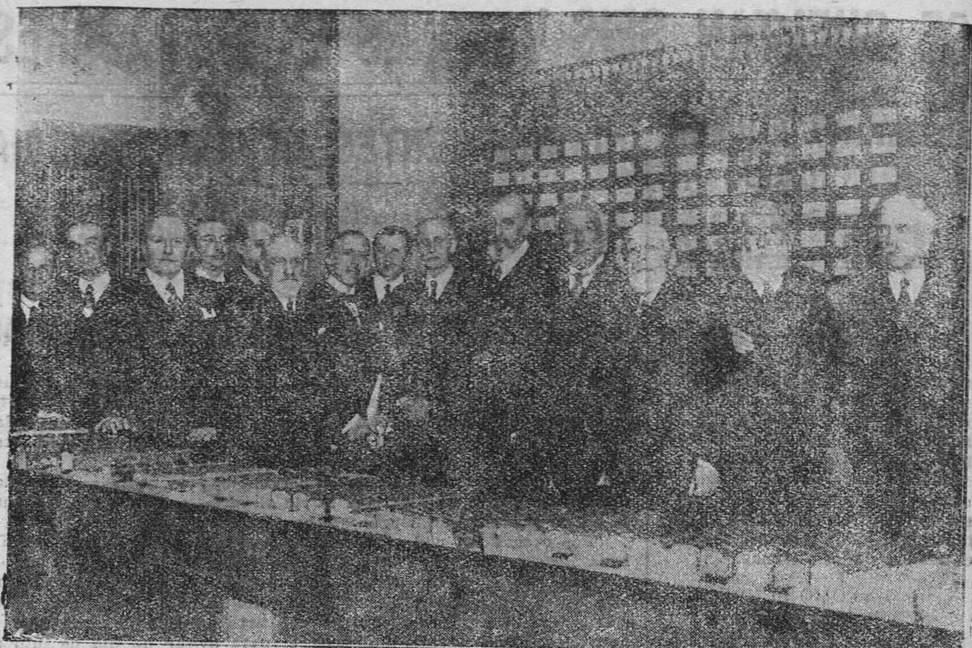
MADRID.—En la Academia Española. El presidente de la República con algunos académicos y los oradores que tomaron parte en la solemne sesión celebrada para conmemorar el centenario del nacimiento del gran dramaturgo don José Echegaray.

Al regocijante "Pamplinas" todo le sale bien, sin que él ponga de su parte nada para conseguirlo, sin que ni siquiera se entere de las cosas que le han pasado, de los peligros que ha corrido, ni de las veces que estuvo a punto de ser víctimas de algún mal suceso. Y en esto consiste, precisamente, uno de los principales motivos de la hilaridad que suscita en todos los públicos. Porque Buster Keaton, siempre impasible, siempre sin darse cuenta de lo que sucede a su alrededor, cometiendo a cada paso torpezas insignes que bastarían para echarlo todo a perder si se tratara de otro hombre menos afortunado,