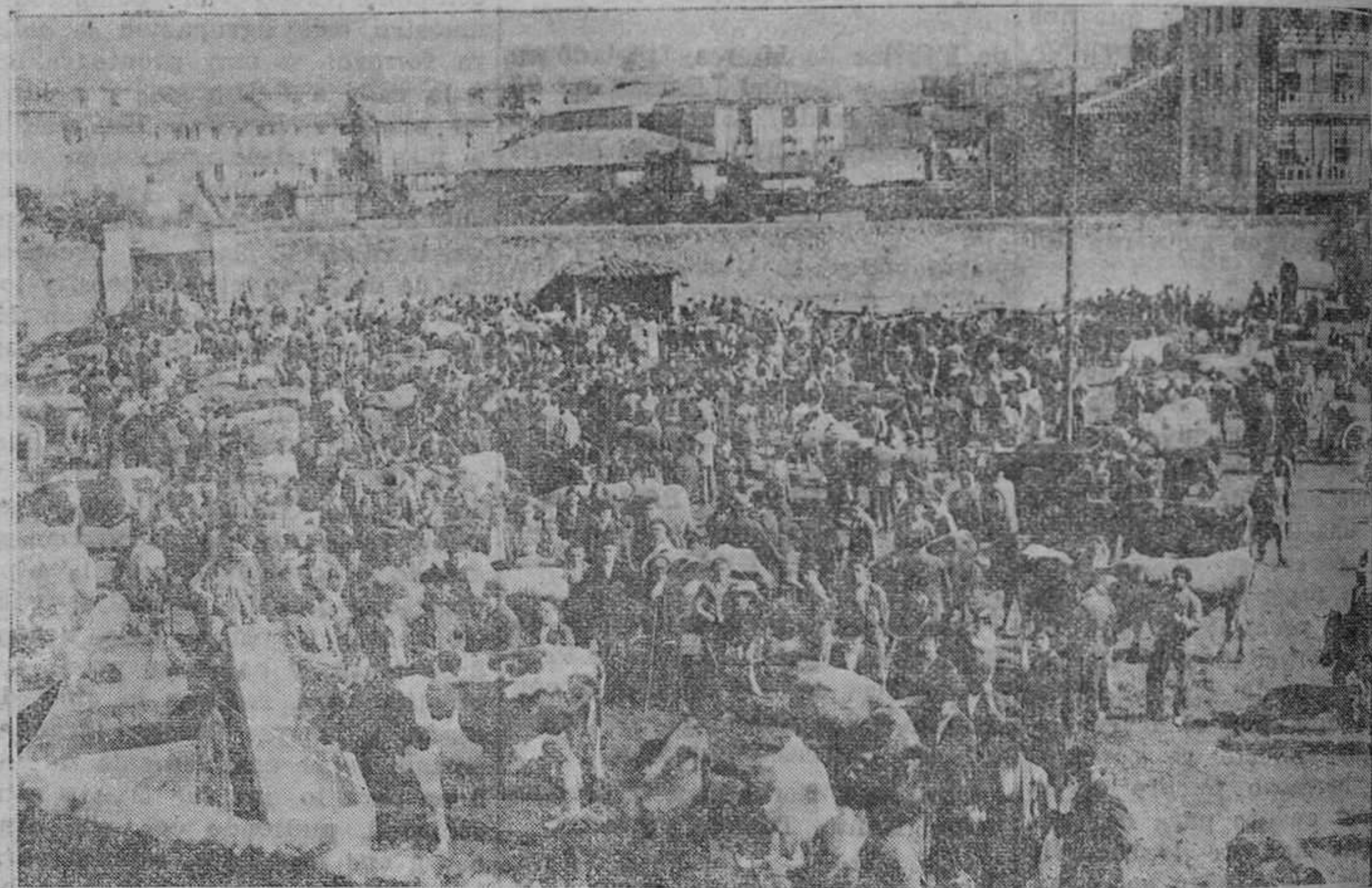
LLANES.—En el nuevo mercado se ha hecho una instalación con abrevaderos y comodidades que satisfacen a los ganaderos.