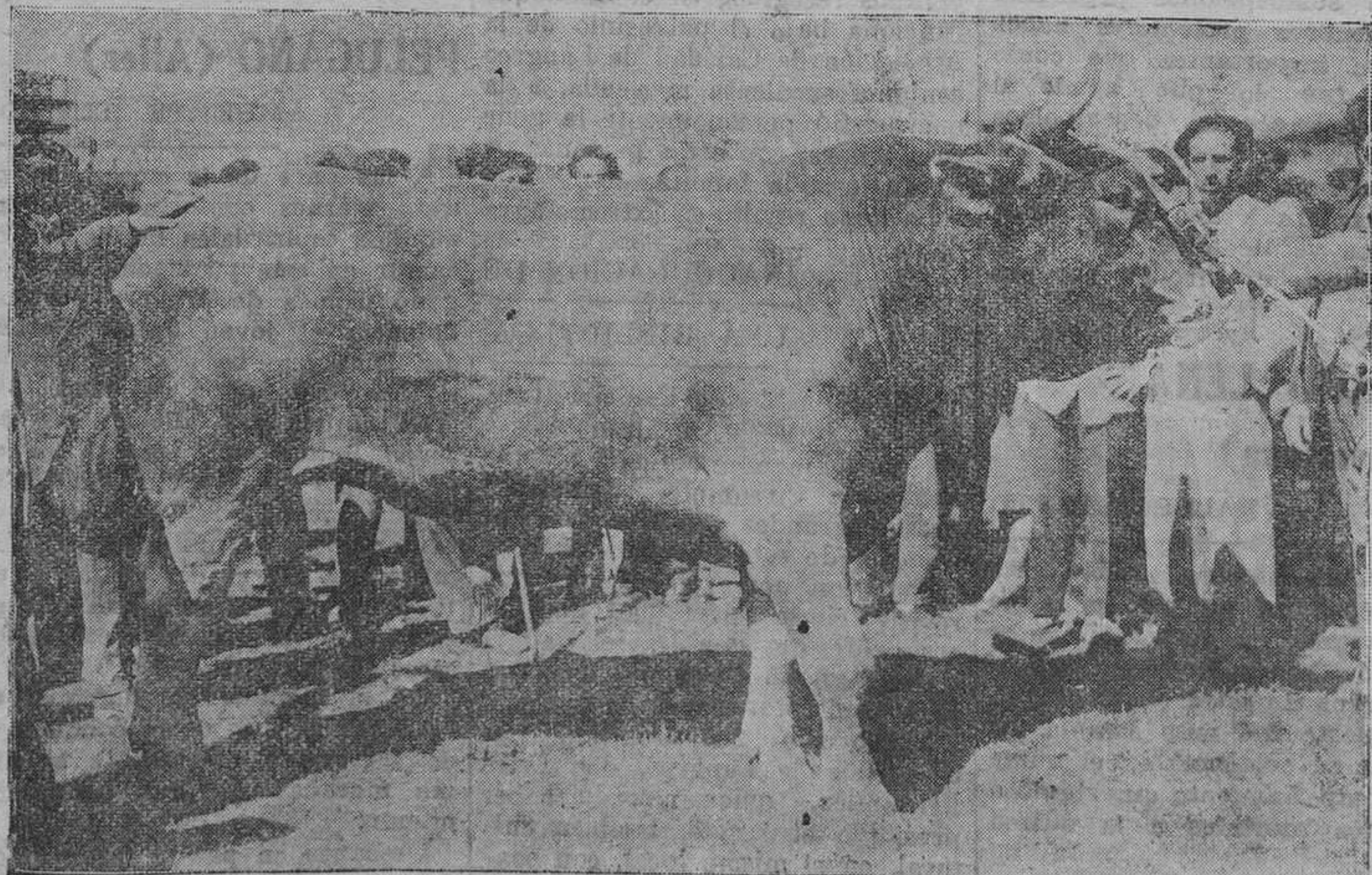
LLANES.—Ejemplar Swiach presentado en nuestro mercado, cuyo peso de 1.463 kilos es algo extraordinario.

Reciban todos nuestra enhorabuena y que continúen laborando por la prosperidad de la asociación que ha puesto su confianza en ellos.