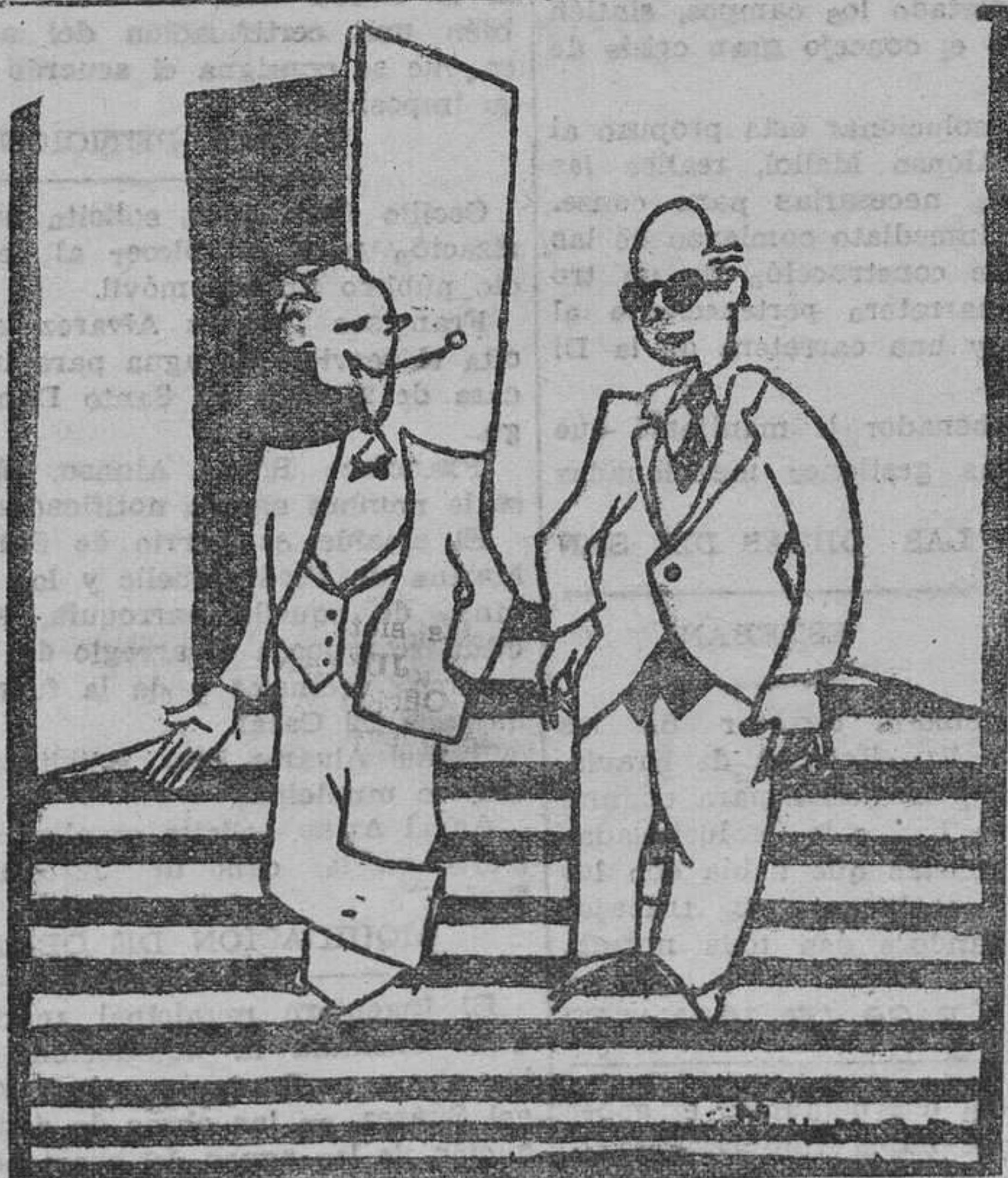
—Yo soy un prodigio para los negocios. Fíjese: me fui a América con un par de zapatillas rotas y volví con un millón. —¿Ah! ¿Si? ¿Y qué hizo usted con un millón de zapatillas?

A cuantos nos favorecen con el envío de originales, les recordamos que nos es imprescindible, ni mantener correspondencia acerca de los