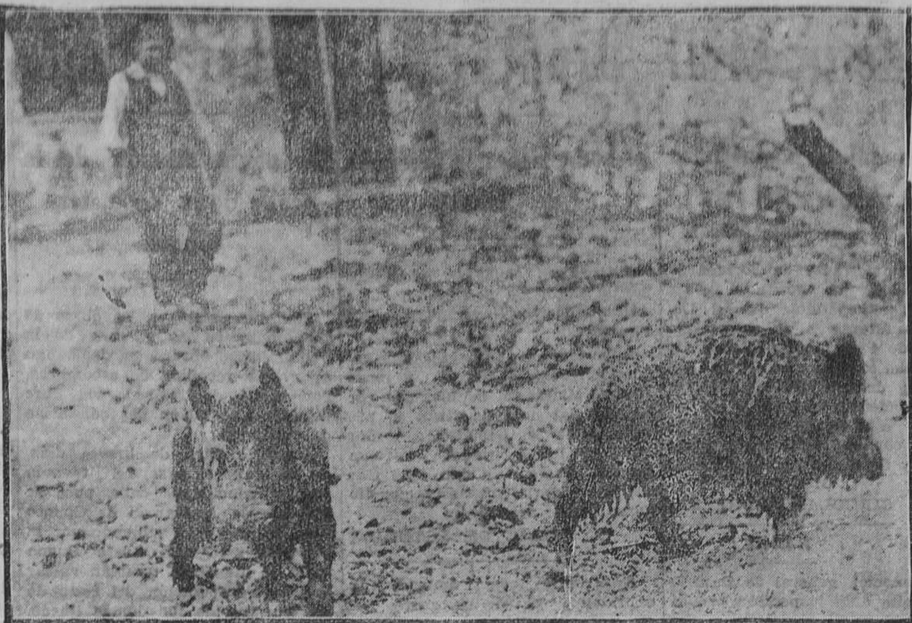
BILBAO.—En los montes del sur de Vizcaya abunda la caza del jabalí. Cazadores afortunados han cobrado hasta nueve hermosas piezas en una sola jornada. En Gueñes, cerca de Valmaseda, algunos vecinos los crían en casa como a los cerdos. He aquí un vecino en su corral con una pareja de estos bichos.

Entre los homenajes rendidos al veterano formador de cerebros y corazones católicos, ninguno como el de sus 1.600 antiguos alumnos, miembros efectivos de un organismo viviente en España, a cuyo siglo XVIII cedió monseñor Baudrillart las púlpitos de su labor investigadora, cuando se preparaba, como Pío XI, en el estudio del pasado, para luchar en el presente y preparar el porvenir, contribuyendo al establecimiento del reinado de Jesucristo en el mundo.