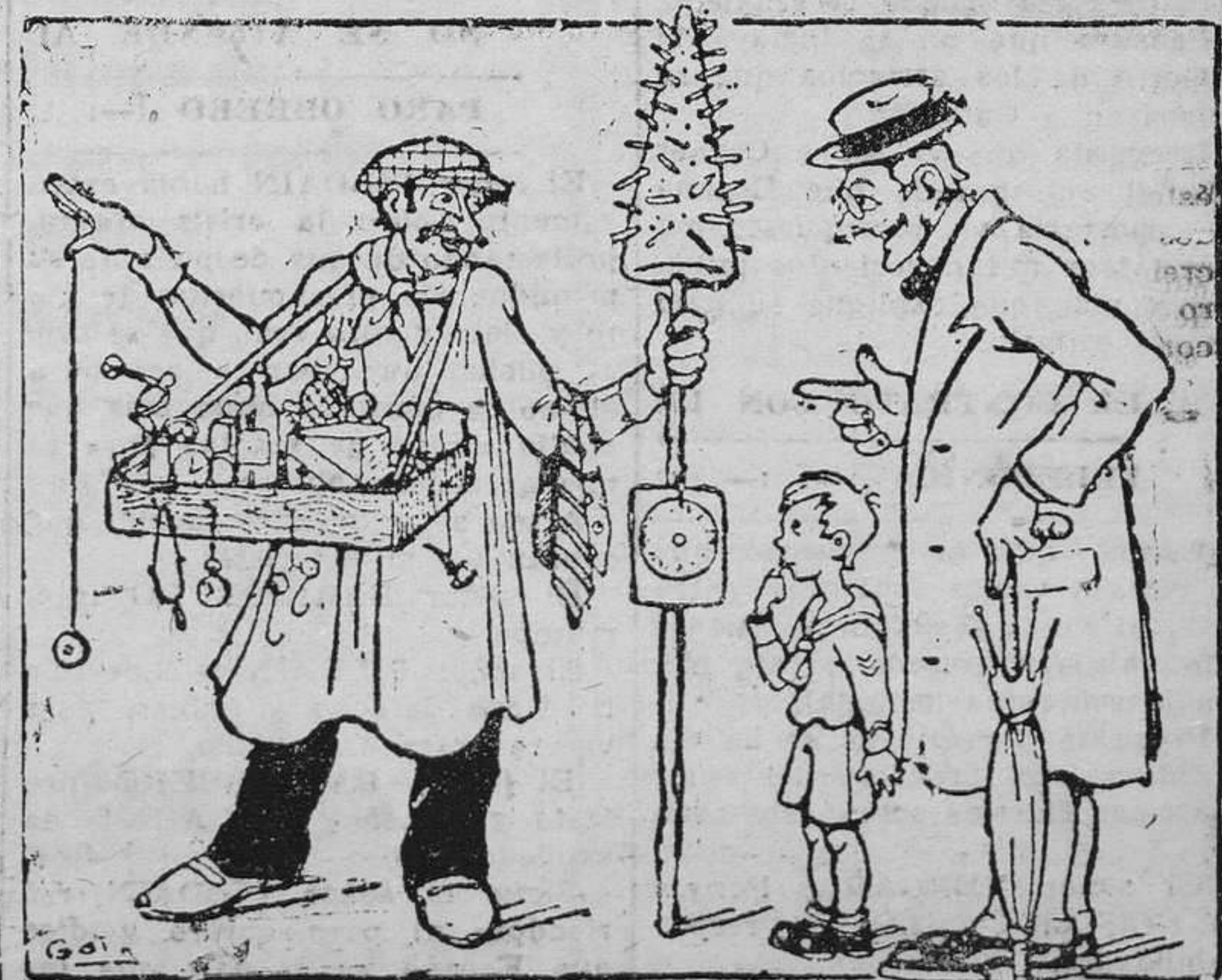
—¿Qué vende usted, buen hombre? —Toda clase de artículos... menos el 29, que ya no se lleva.

El gobernador le acompañó hasta Irún, donde M. Herriot tomó un auto para dirigirse a Toulouse, donde asistirá al Congreso del partido Radical socialista.