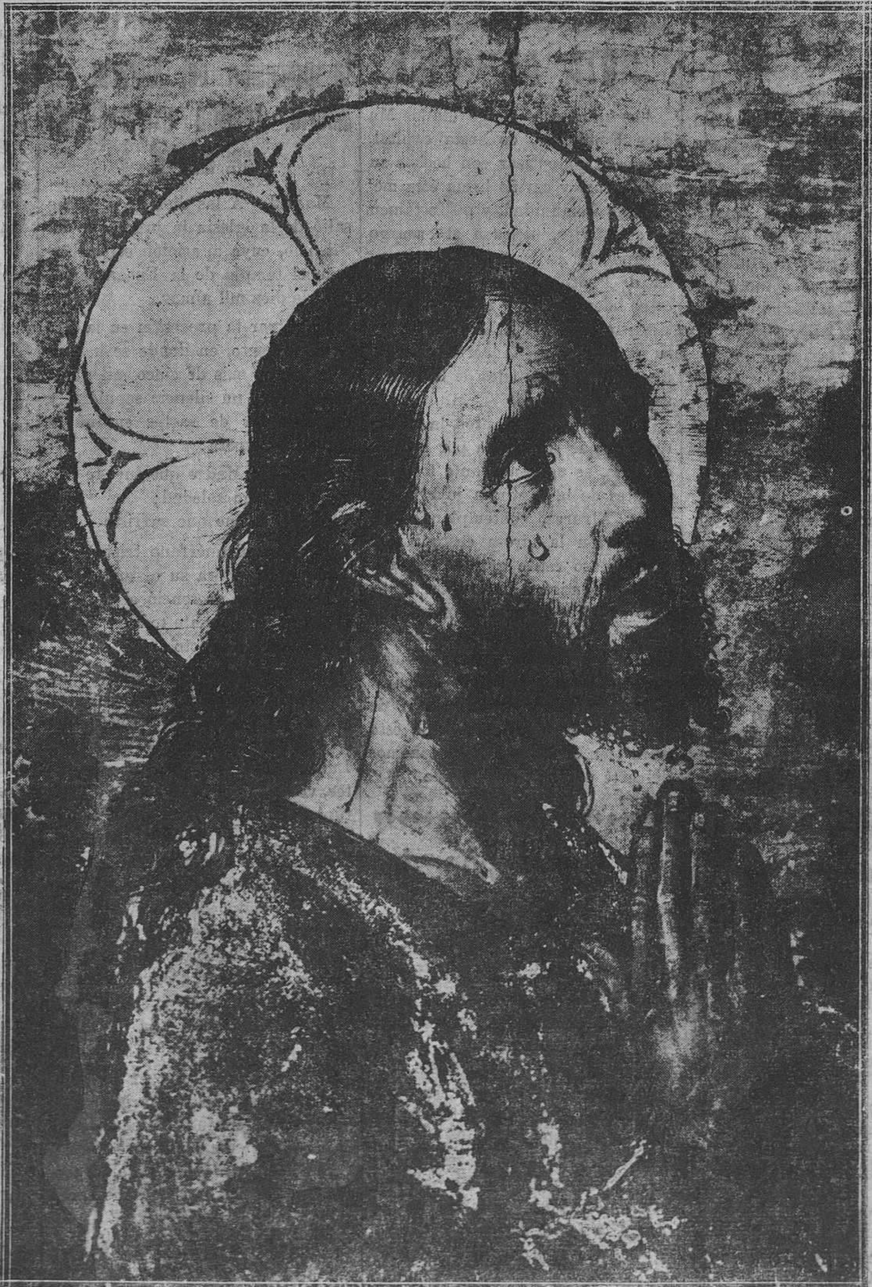
CRISTO EN EL HUERTO.-Tabla de Berruguete, que se conserva en la Catedral de Avila

Al pie de la Cruz, bajo el alero de la repisa en que fueron clavados unos pies, cuyas sandalias no se atrevía a des-