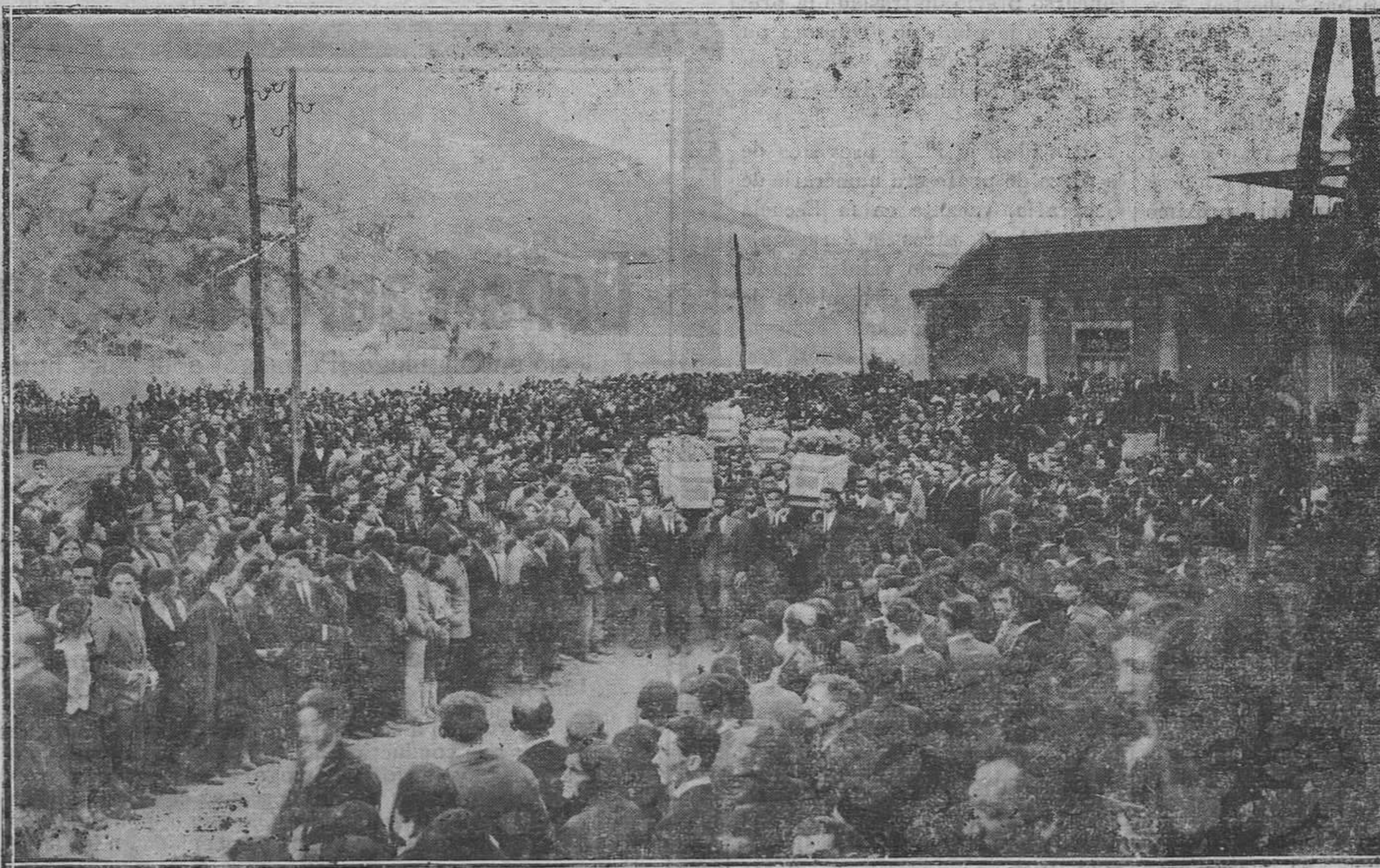
SOTRONDIO.—Momento de ser sacados los féretros de las oficinas, convertidas en capilla ardiente