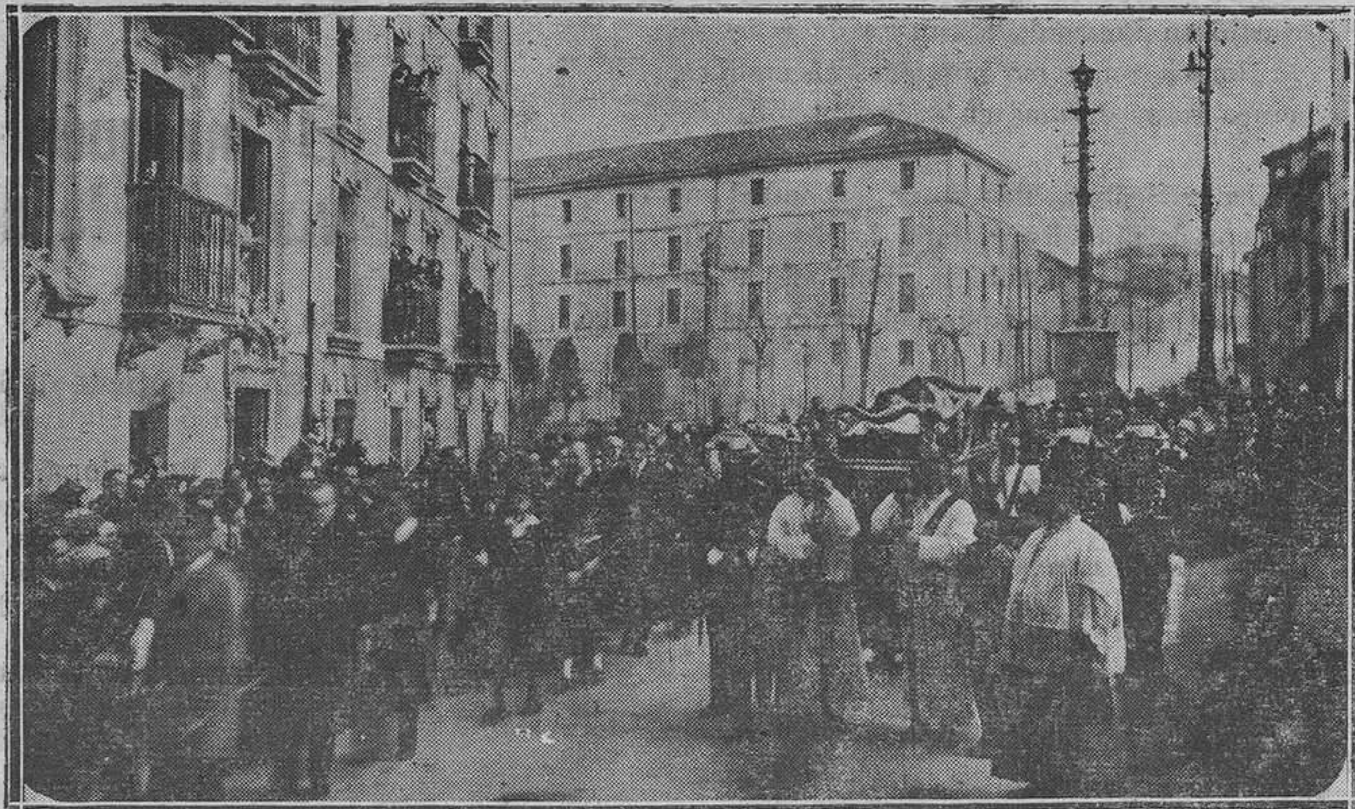
OVIEDO.—La procesión del Santo Entierro, al entrar en la calle, de Santo Domingo.