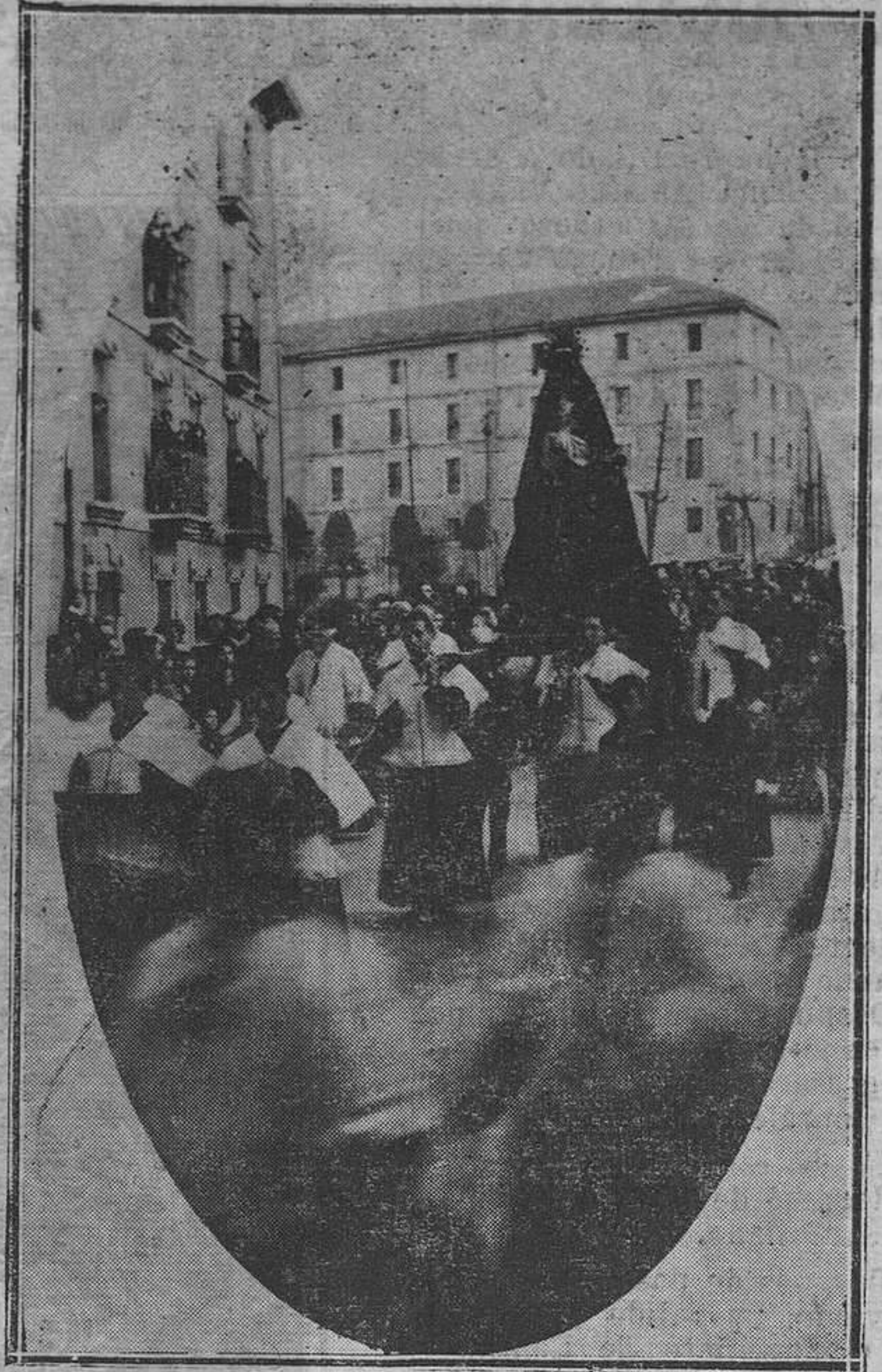
Cuando este número salga a la calle, con los primeros albores del amanecer, la procesión de la Soledad, recorrerá también nuestras calles, adentrando se en el alma, como las espaldas en el corazón de la Madre, frías y penetrantes como el ambiente de la mañana que apunta...