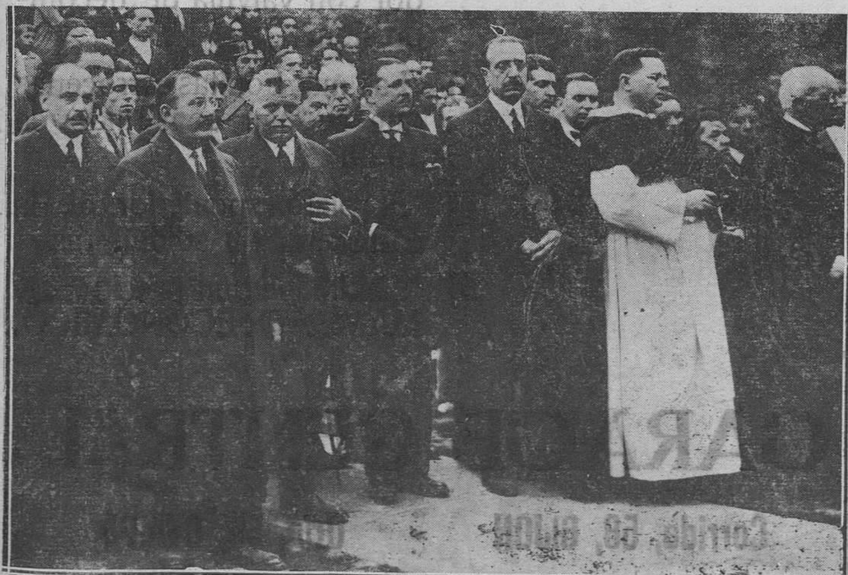
SOTRONDIO.—La presidencia oficial del duelo, en el entierro de los mineros, muertos en accidente ocurrido, en El Sotón