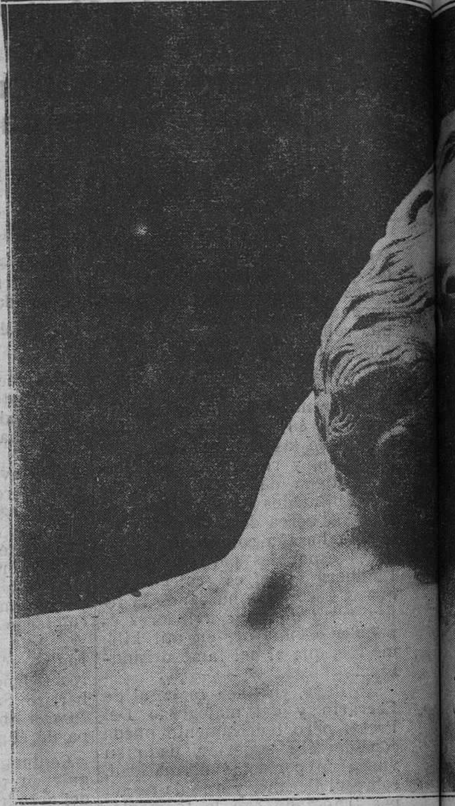
CRISTO MUERTO.--Detalle de una «Fue

de 4 metros 65; 7 metros 365 de espesor de corona, de 1 metro (el círculo exterior tiene 19 metros 25); la altura del ese zócalo es de 2 metros 70 a 2 metros 80, cuyos pilares 7 0,40 metros en la base, son de mampostería de piedra p... cas.