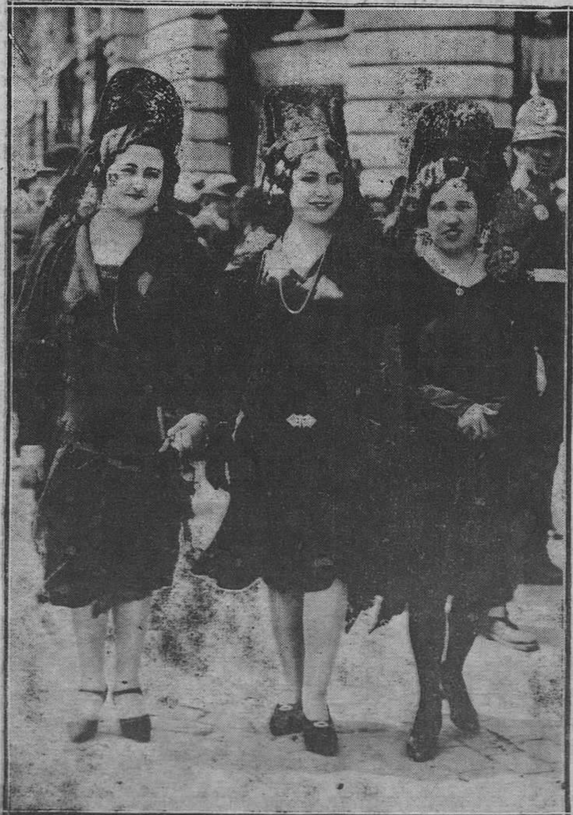
El Jueves Santo, es el día del año en que la mujer reina, con su belleza plena, en la calle, bajo el dosel de la mantilla de blonda.

Ayer, guardando la solemnidad del día, REGION no se publicó. El lector comprenderá que un periódico de la significación del nuestro, no podía por menos de hacer un alto en la diaria tarea, asociándose al dolor de la Cristiandad en la rememoración de la sublime tragedia del Gólgota.