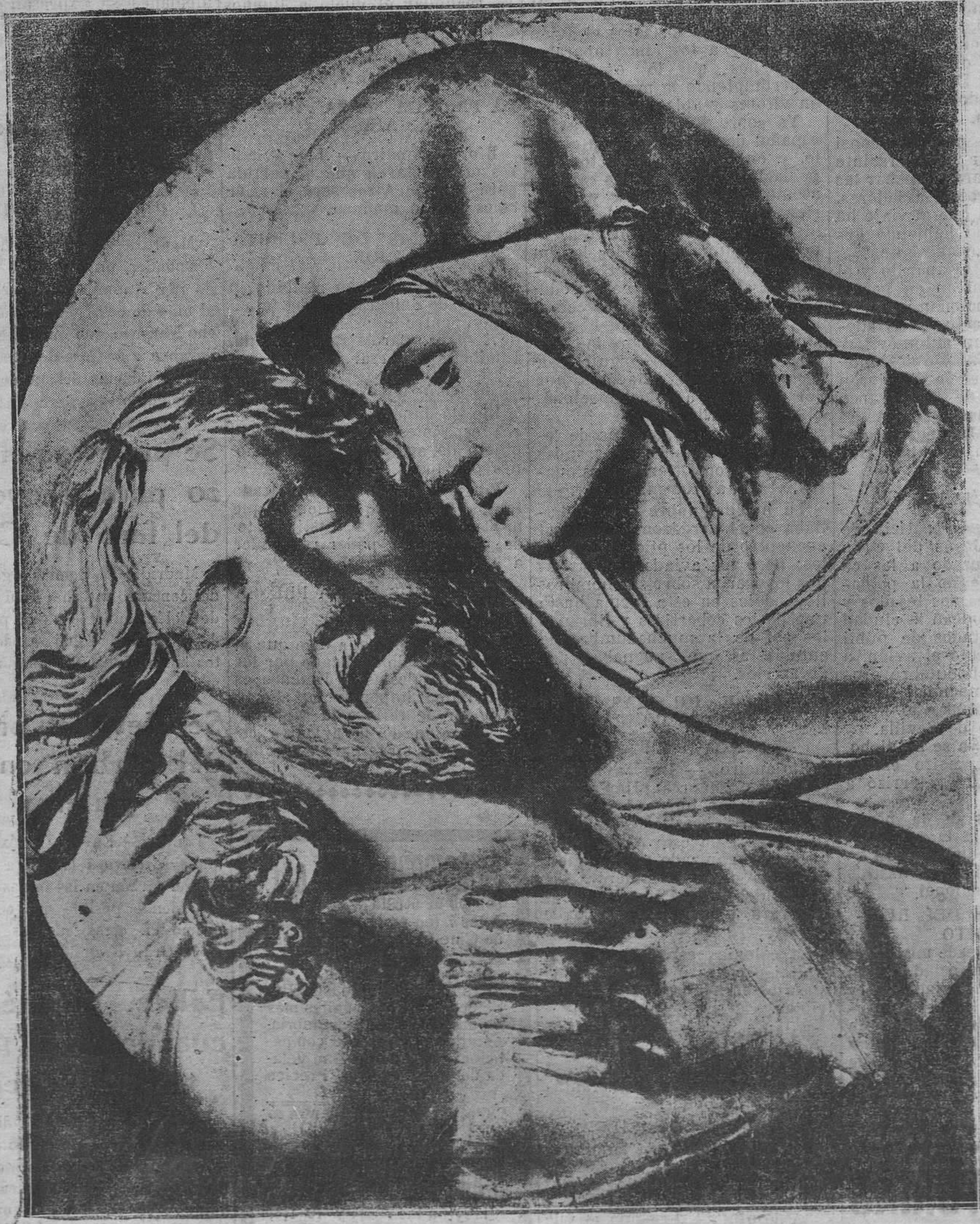
CRISTO MUERTO.--"La Piedad", relieve, por Miguel Angel

El vacío interior tiene un diámetro de 7 metros 65, más o menos; el espesor de la mampostería entre la primera y sexta cornisa es de más o menos 2 metros 47, mientras que entre la primera cornisa y la parte superior del macizo de la fundación, es de 4 metros 12. En fin, ese macizo, que va ensanchándose interior y exteriormente, tiene con un vacío interior