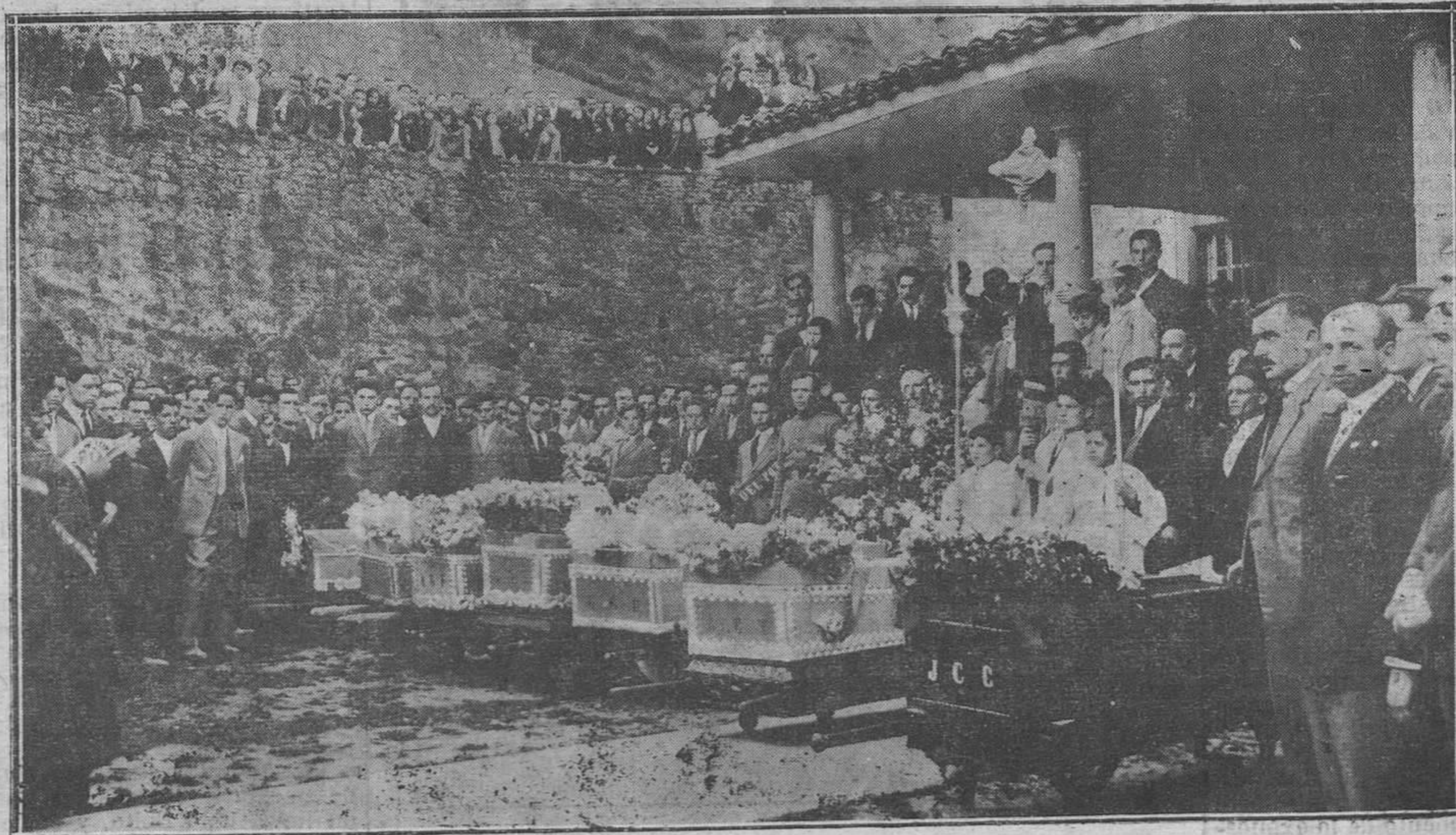
SOTONDIO.—En tanto la Asociación entona el responso, los féretros son depositados en el suelo, ante el atrio de la iglesia parroquial