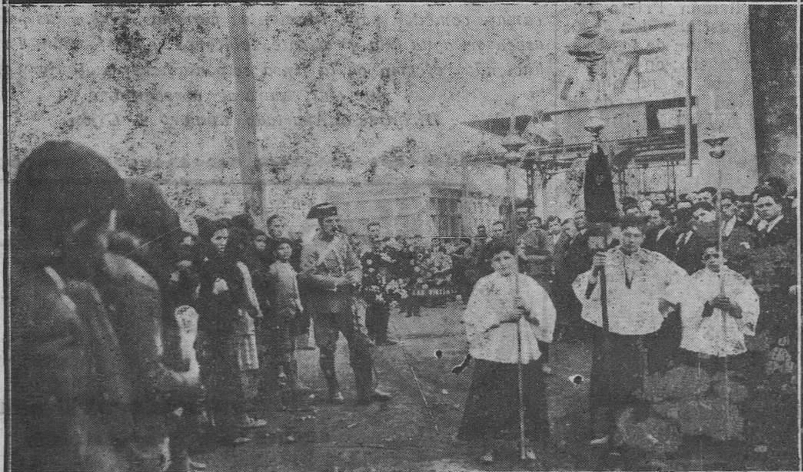
SOTONDIO.—Momento de organizarse la comitiva, para conducir al cementerio parroquial, los restos de los infortunados mineros, muertos en El Sotón.

De venta en todas las buenas casas del ramo.