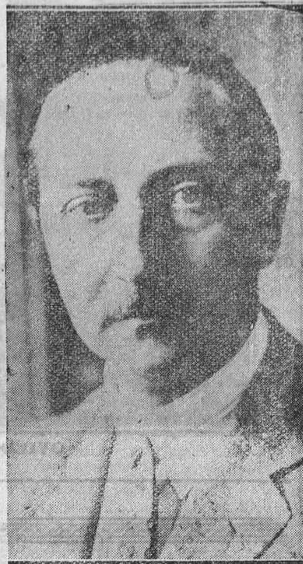
El príncipe Oscar de Prusta, quinto hijo de Guillermo II, quien probablemente se presentará candidato para la elección presidencial de Alemania, frente al mariscal Hindenburg.

"Gentes que no son ni carne ni pescado, ni se parecen a otros socialistas, siquiera finos como los franceses. Estos nuevos campeonos, ayer obreros de callosa mano, y que tan sólo llevan hoy un guante, pues no se atreven aún hoy con el segundo, han formado una curiosa clase en la "fauna" parlamentaria. Ni son señoritos ni son obreros, ni aristócratas ni plebeyos. De un lado miran a Carlos Marx y del otro miran al presupuesto. Han adquirido costumbres del politicismo viejo y caduco: sus intrigas, sus recovecos de pasillo, sus "enchufes". ¡Y cómo los defienden! Gritan como jauría suelta en cuanto se les ataca. Mas no defienden los principios porque "defienden los postres".