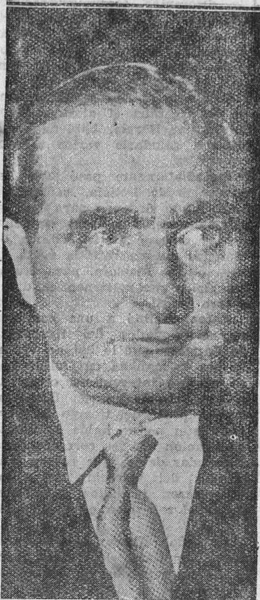
Mr. Ogden Mills, nuevo ministro del Tesoro de los Estados Unidos, que ha sucedido a Mr. Mellon, nombrado embajador en Londres.