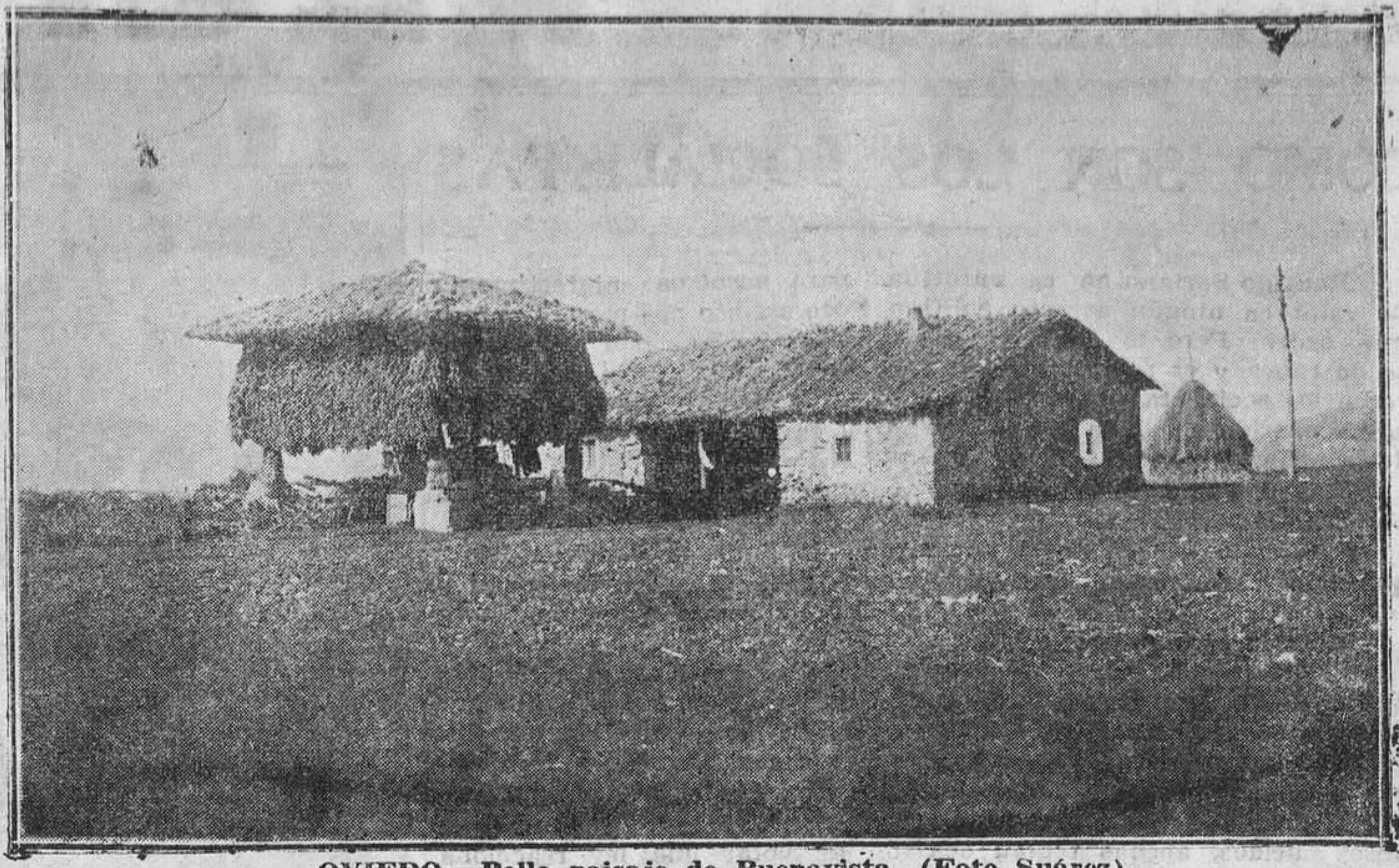
OVIEDO.—Bello paisaje de Buenavista.