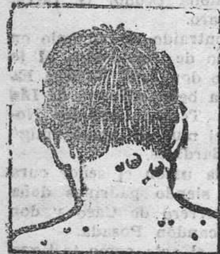
Granos - Forunculosis

Tengo tambien de los consumidores de España frecuentes testimonios de curaciones maravillosas obtenidas con el uso de mi Depurativo. No los publico sin embargo por sujetarme al deseo expresado por los mismos de no dar a conocer sus nombres respetando así su natural reserva. Pida Vd hoy mismo un folleto gratuito al Laboratorio Richelet, San Sebastian, 22, San Bartolomé.