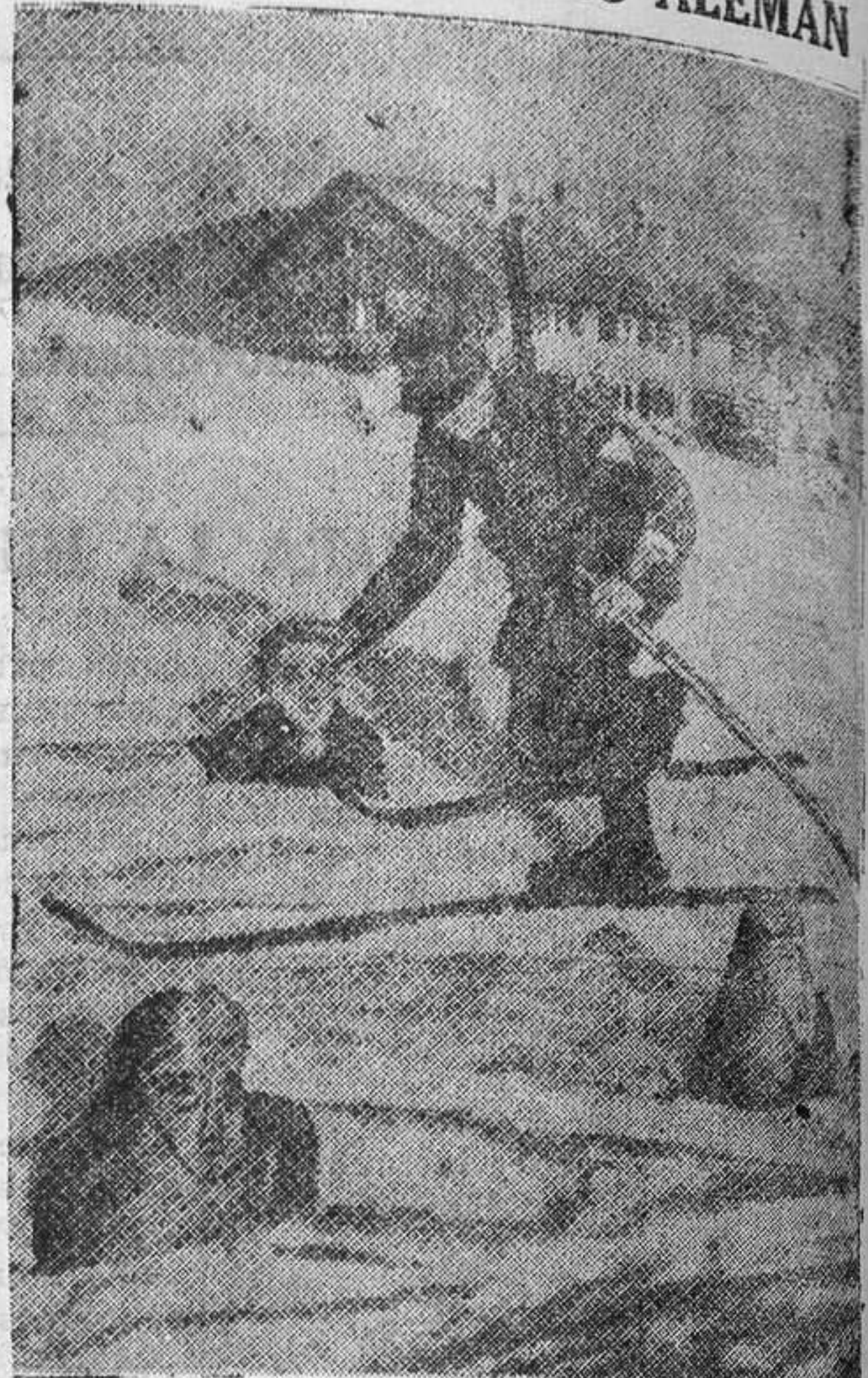
"La Reichswehr comprende dos compañías de "skieurs", que actualmente realizan interesantes maniobras en las montañas de Allgan. Para los ejercicios de tiro usan maniquies de caucho hundidos en la nieve. La fotografía recoge el momento en que un sargento de la Reichswehr comprueba el impacto de un tiro."

La policía ha descubierto curiosos documentos en Boshemerhof (Hesse) en los cuales se hablaba de fusilar a cualquiera que hiciera