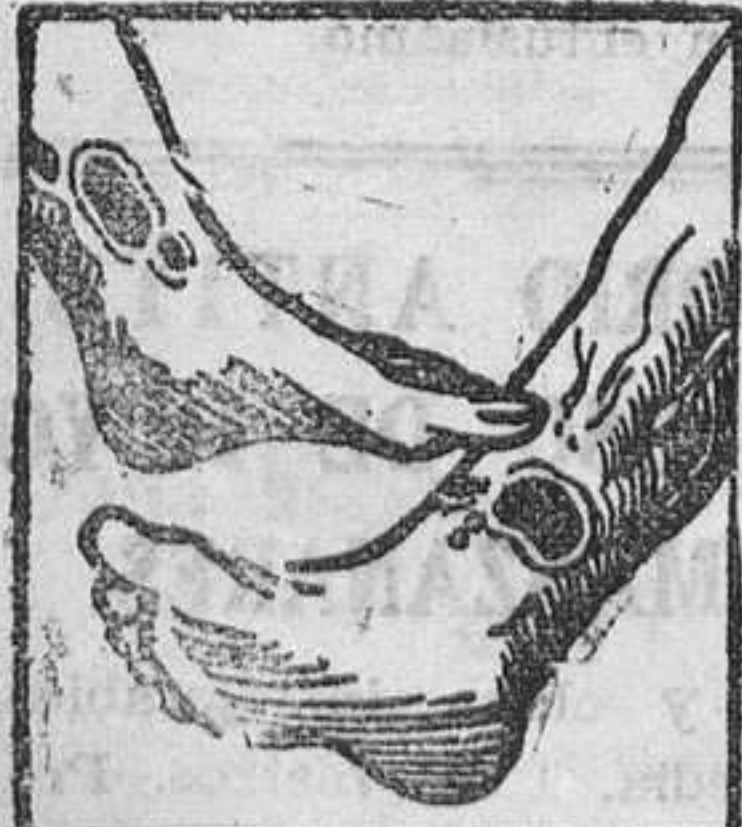
Males en las piernas

Clinica de Asueroterapia y de enfermedades de la piel y secretas