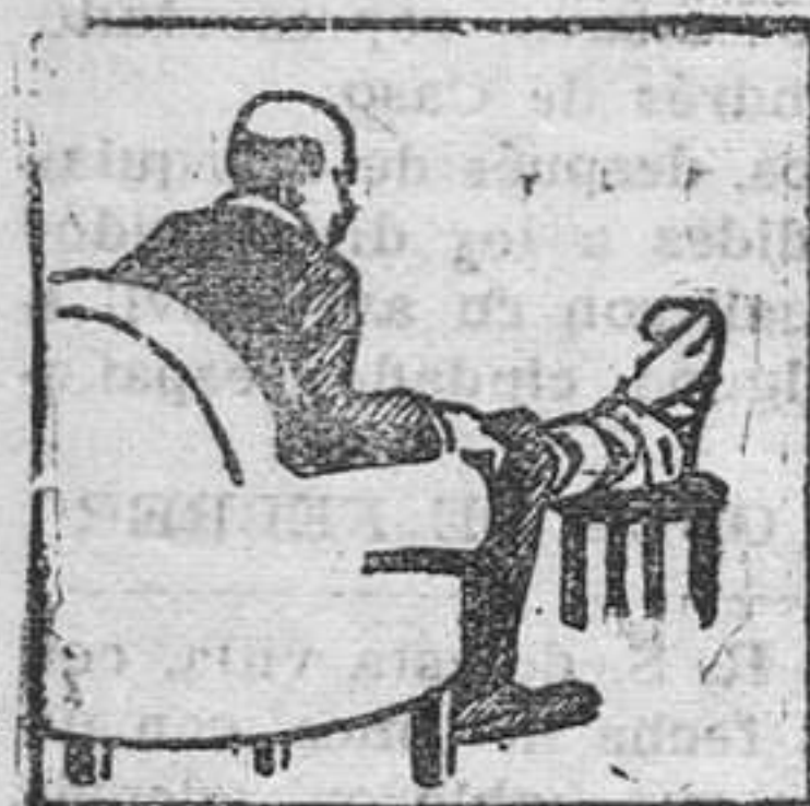
Gota - Dolores