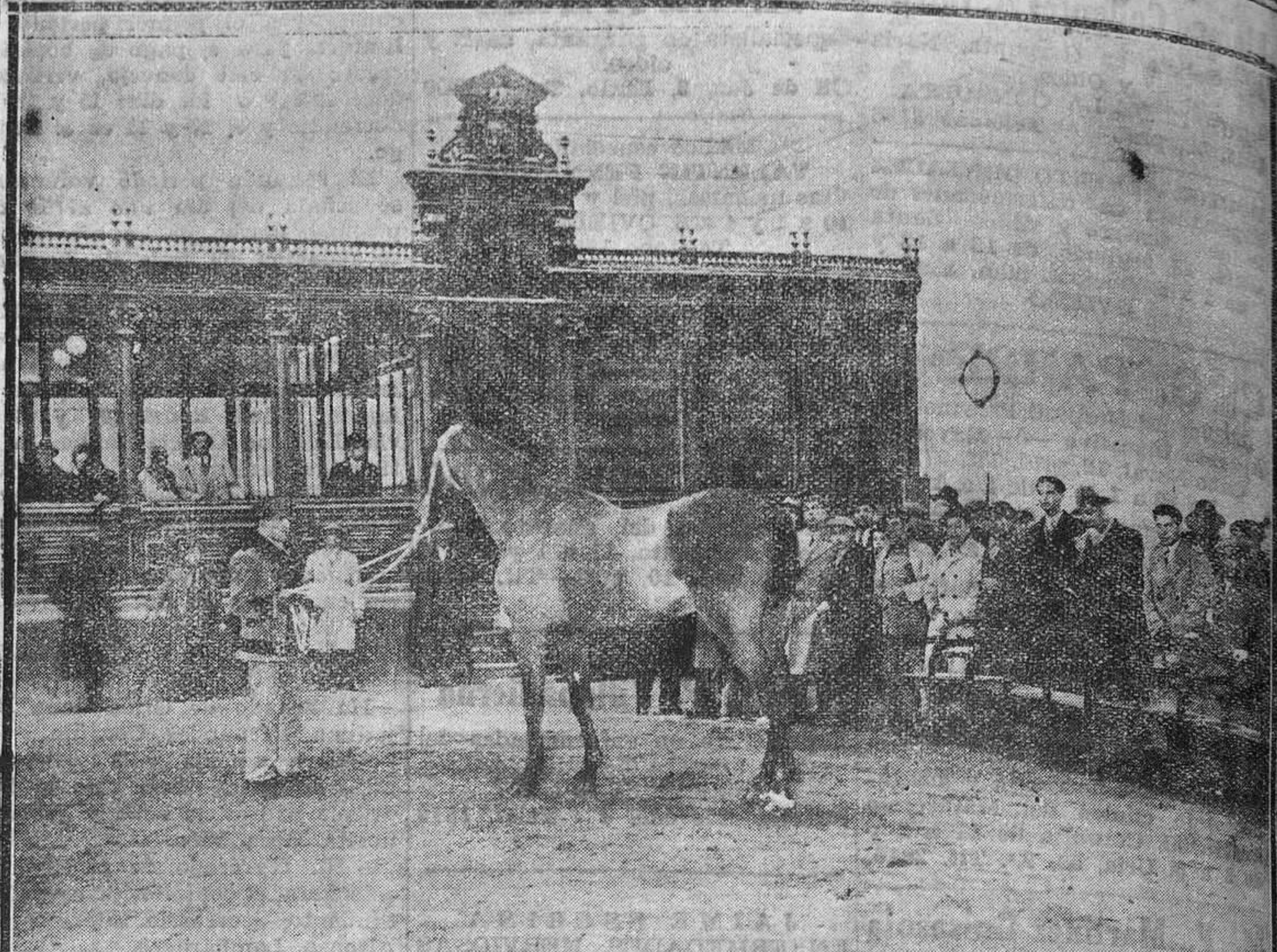
MADRID.—Subasta de caballos que pertenecieron a don Alfonso de Borbón.