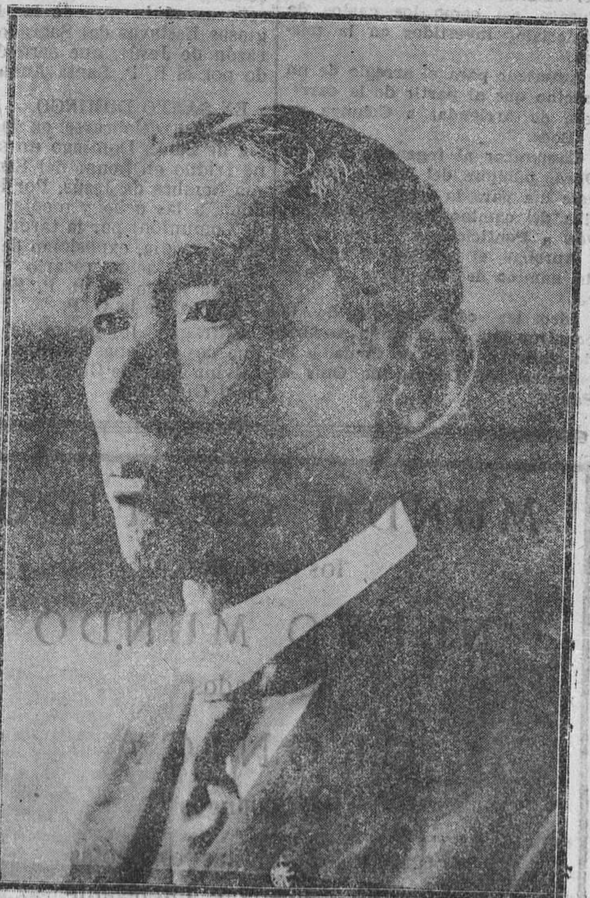
El señor Yoshizawa, ex embajador del Japón en París, do donde ha salido para su país a fin de tomar posesión de la cartera de Negocios Extranjeros, para la que ha sido designado últimamente.

Depositarios: E. Pérez del Molino, S. A. Santander-Madrid.