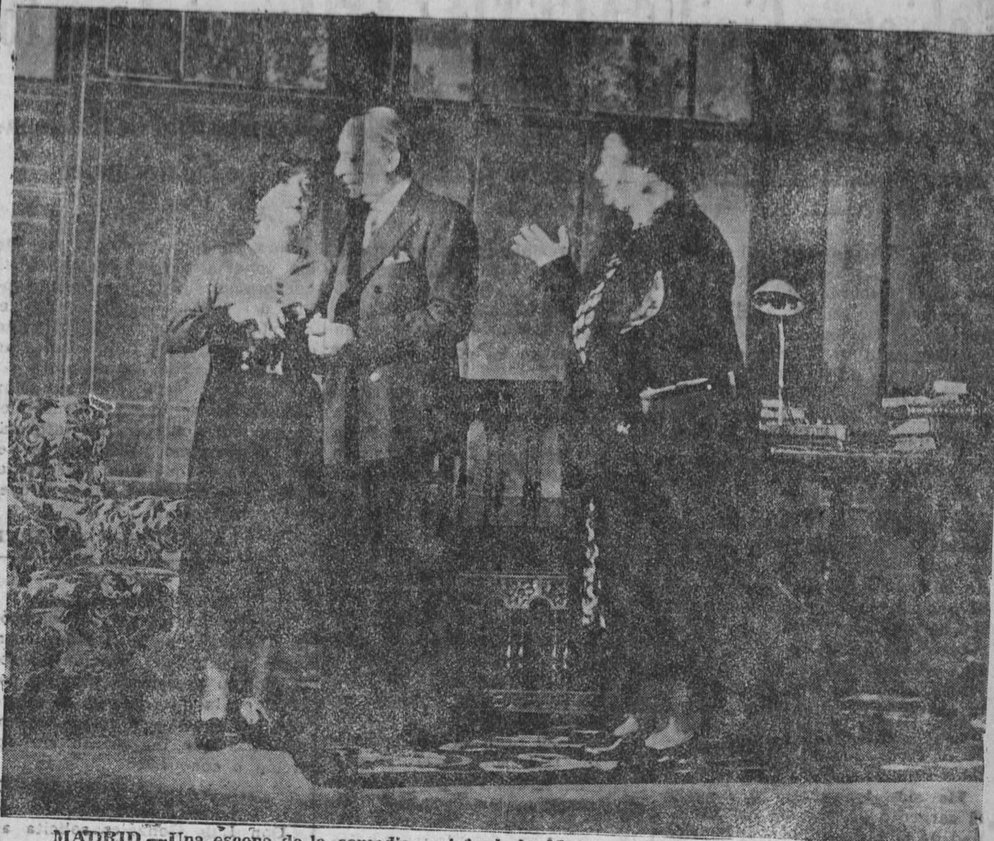
MADRID.—Una escena de la comedia, original de Martínez Omeña, "Fausto", estrenada en el teatro Lara.