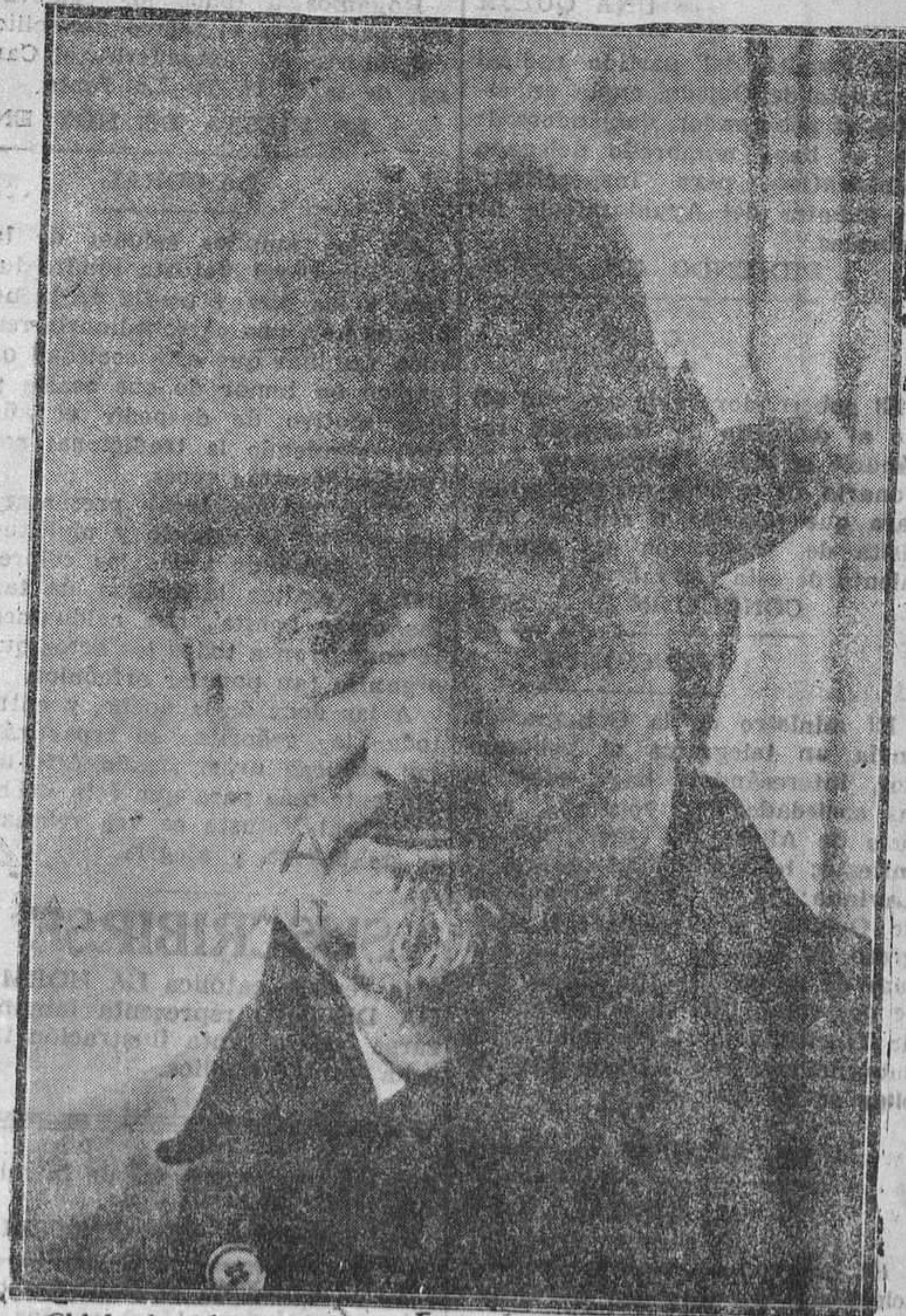
Chicherin, el ex comisario de Negocios Extranjeros de la República de los Soviets, que fué expulsado de Rusia por Stalin, a quien la Policía ha detenido como vagabundo empujado en una calle de Moscú.