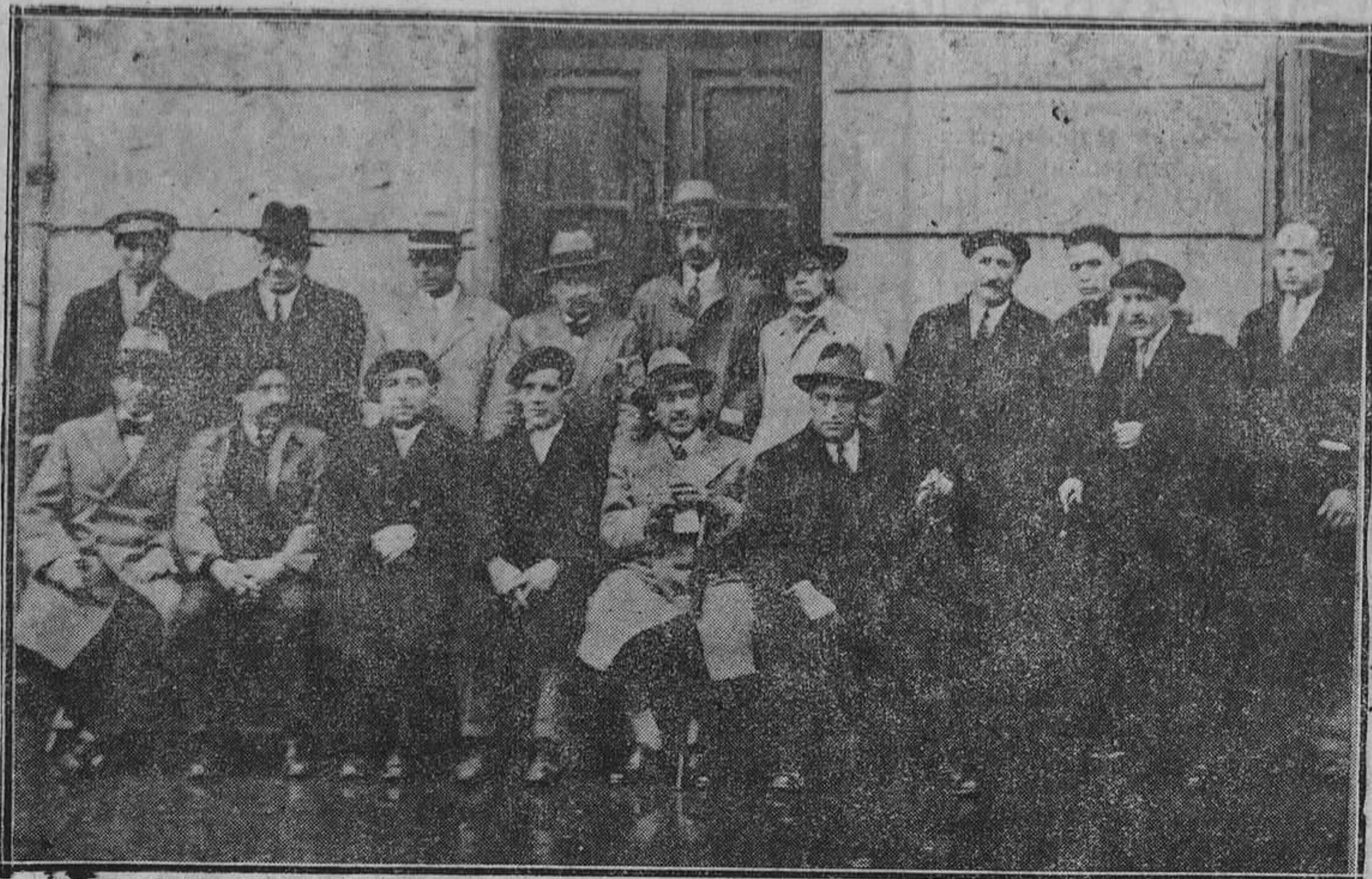
SOTRONDIO.—Autoridades e invitados que asistieron al homenaje a la vejez, celebrado en el concejo de San Martín del Rey Aurelio. (Foto Mena).

100 metros Valenzuela—camioneros, Triple Salto, Castedo—Ins-