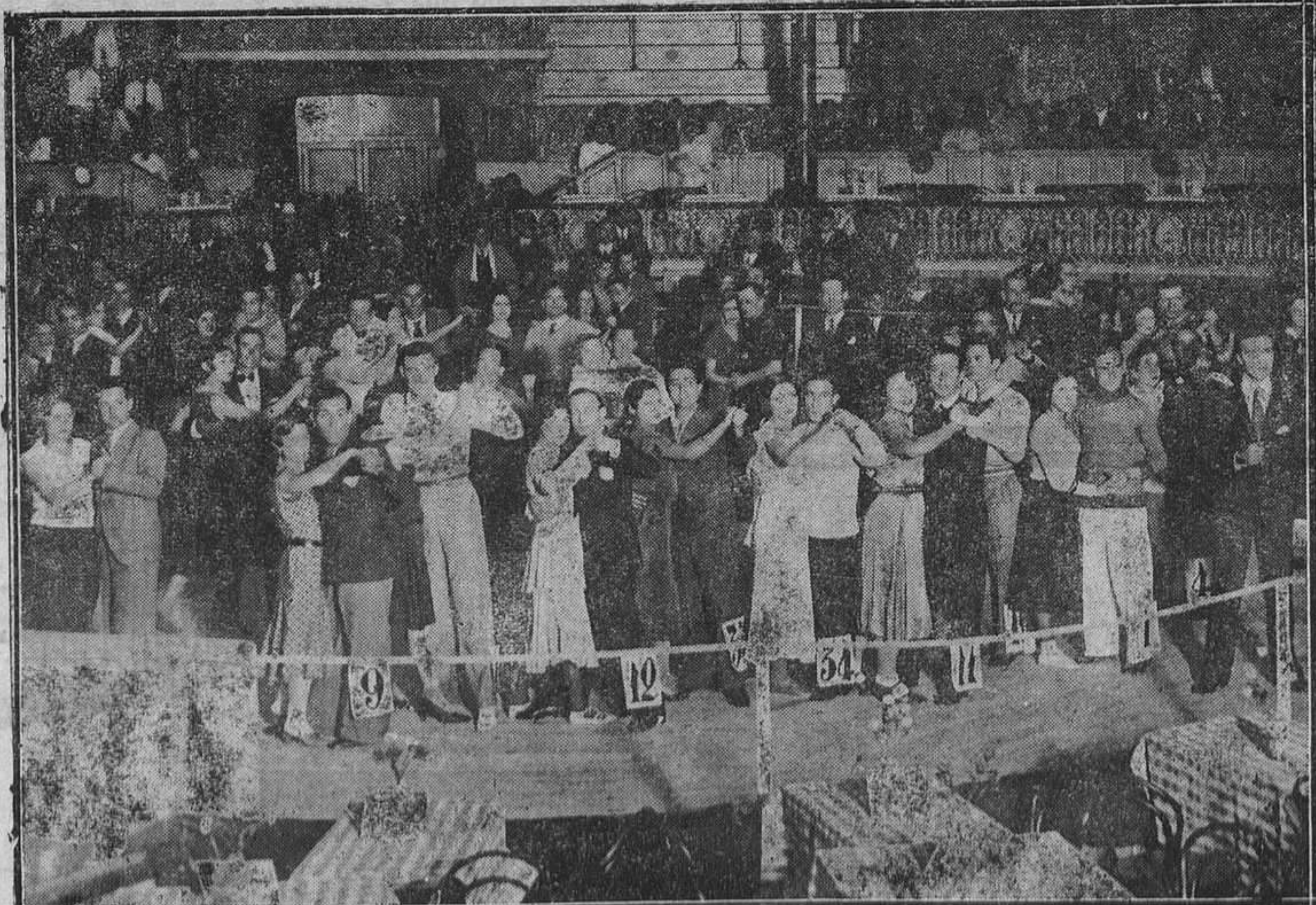
MADRID.— Un momento del partido entre el Athletic de Bilbao y el Deportivo Alavés durante la celebración del campeonato nacional de resistencia de balle.

La segunda tanda, fué de tenso dominio del Sporting, con brillantes intervenciones del tero sevillista, la nerviosidad pública y jugadores difícil-