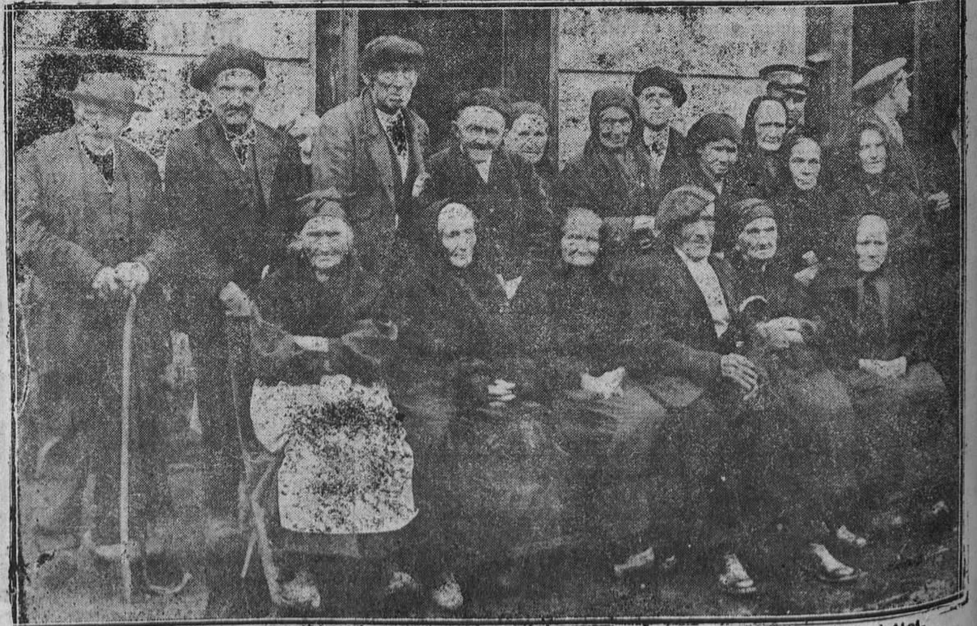
SOTRONDIO.—Grupo de ancianos del concejo de San Martín del Rey Aurelio que participa de los beneficios concedidos en el homenaje a la vejez celebrado el domingo..