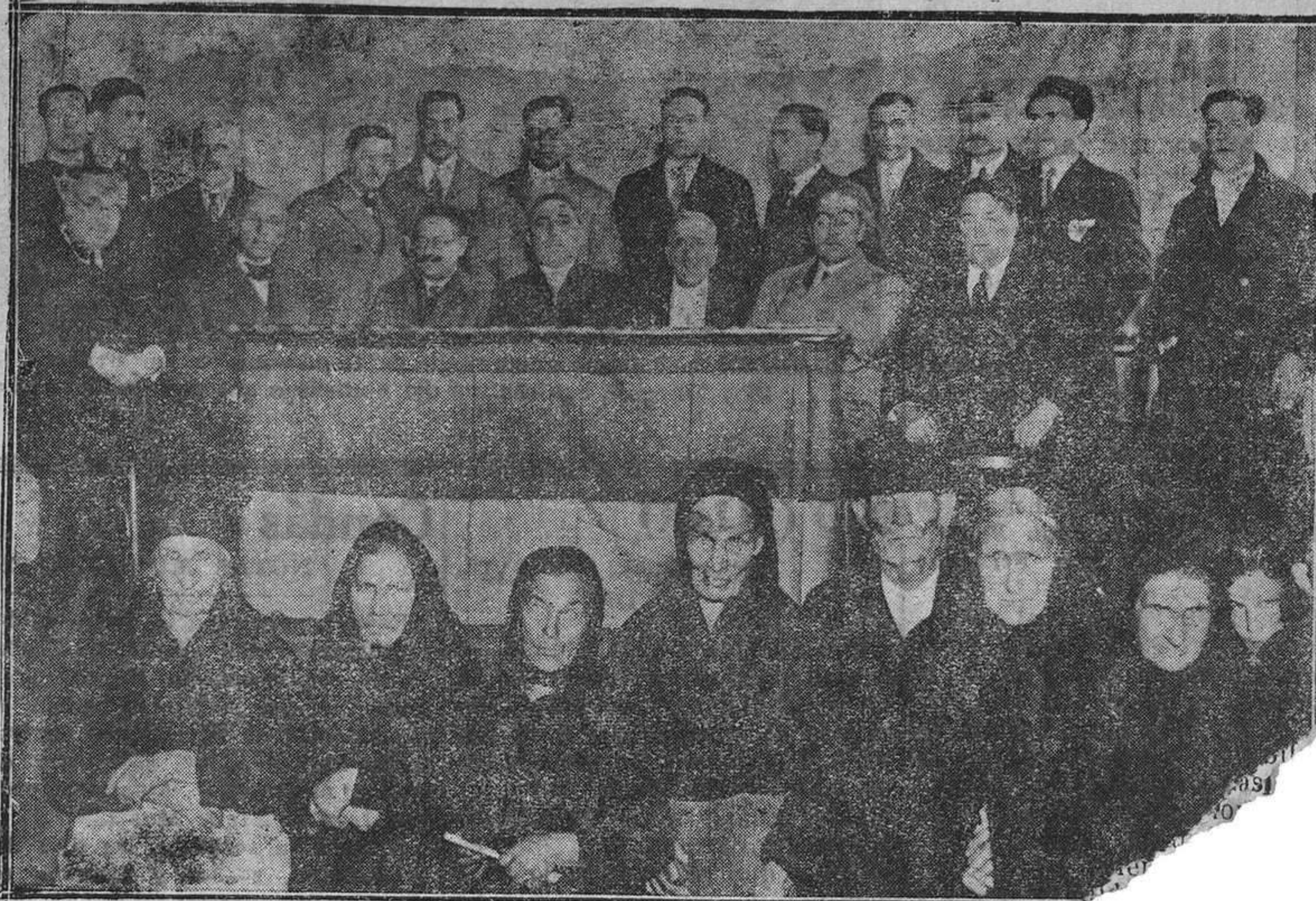
SOTRONDIO.—Presidencia del homenaje a la vejez, celebrado en el teatro Pueblo el domingo último.

tituto Escuela.— 150 metros, Diez—aparejadores.— Jabalina, Searles—medicina— 600 metros, Fajardo,—derecho.