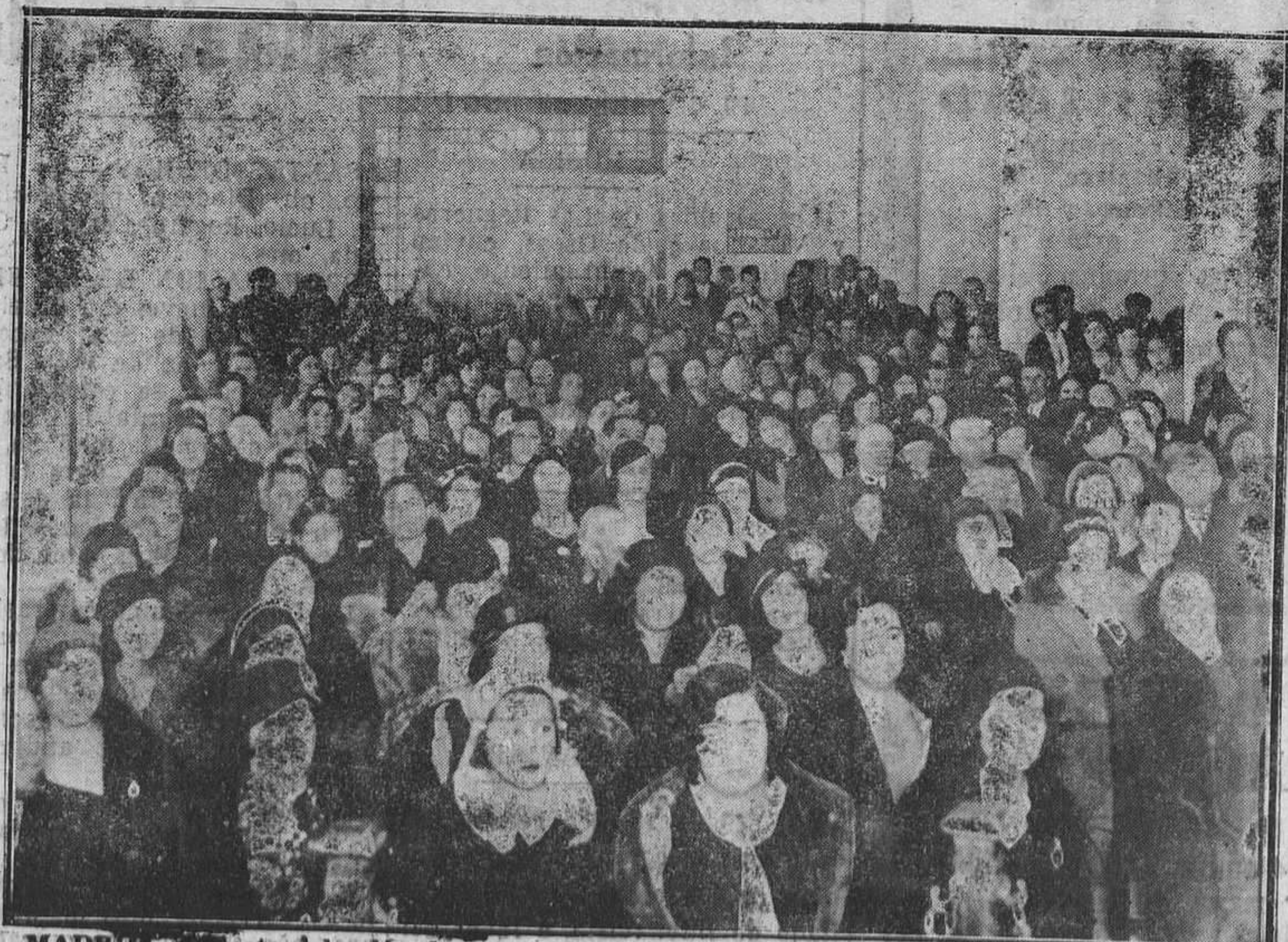
MADRID.—Aspecto del salón de actos de la Sociedad "La Unica" durante la celebración del mitin en favor del voto femenino.

Examinado el saldo de cuentas corrientes de los Bancos de esta capital, resulta a favor de la junta la cantidad de treinta y ocho mil setecientas treinta pesetas con treinta y cuatro céntimos, y deducidas diecinueve mil cuatrocientas pesetas a que ascienden los donativos que, previo el examen de los expedientes presentados, acordó conceder la junta en esta sesión resulta un sobrante de diecinueve mil trescientas treinta pesetas, con las cuales se atenderá a las peticiones que se produzcan hasta el 31 de diciembre próximo.