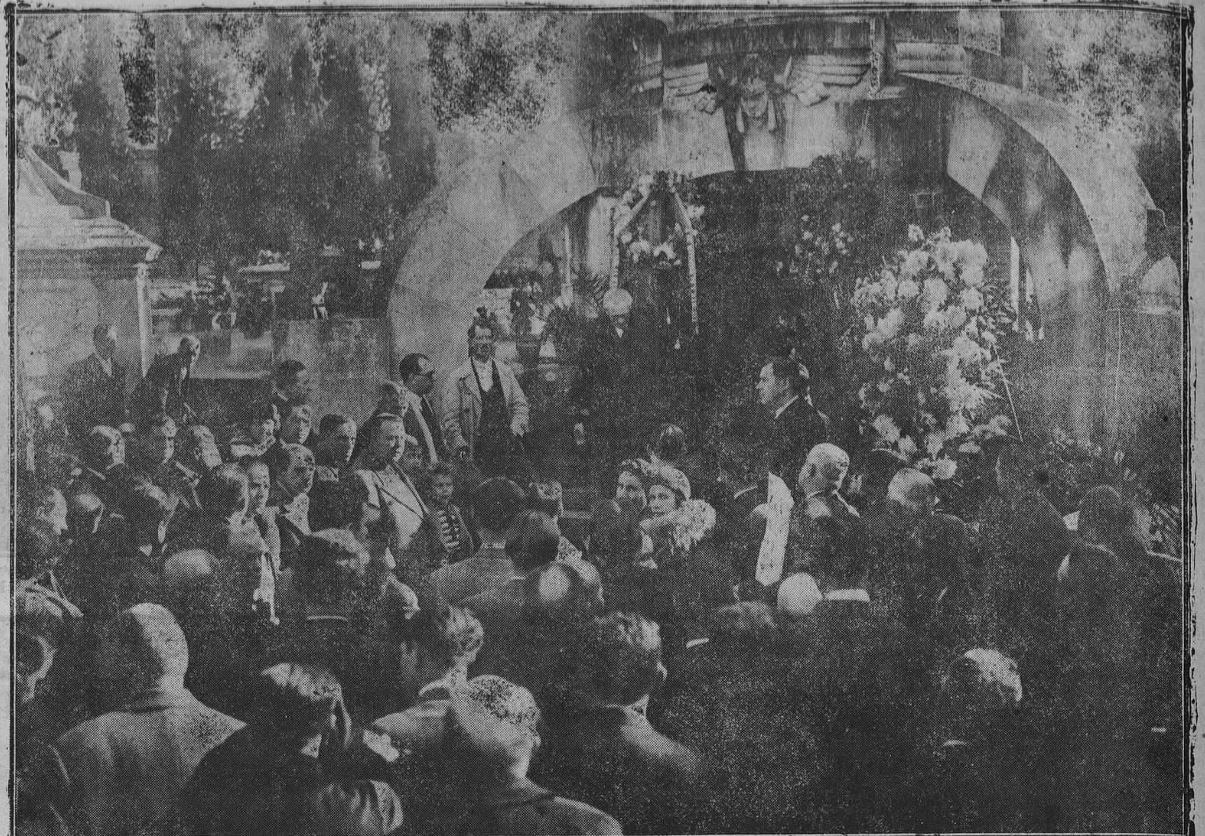
MADRID.—El fiscal general de la República, señor Franchi Roca, pronunciando un discurso a la memoria del gran patriota Pi y Margall, con motivo del homenaje que se le tributó al cumplirse el aniversario de su fallecimiento.