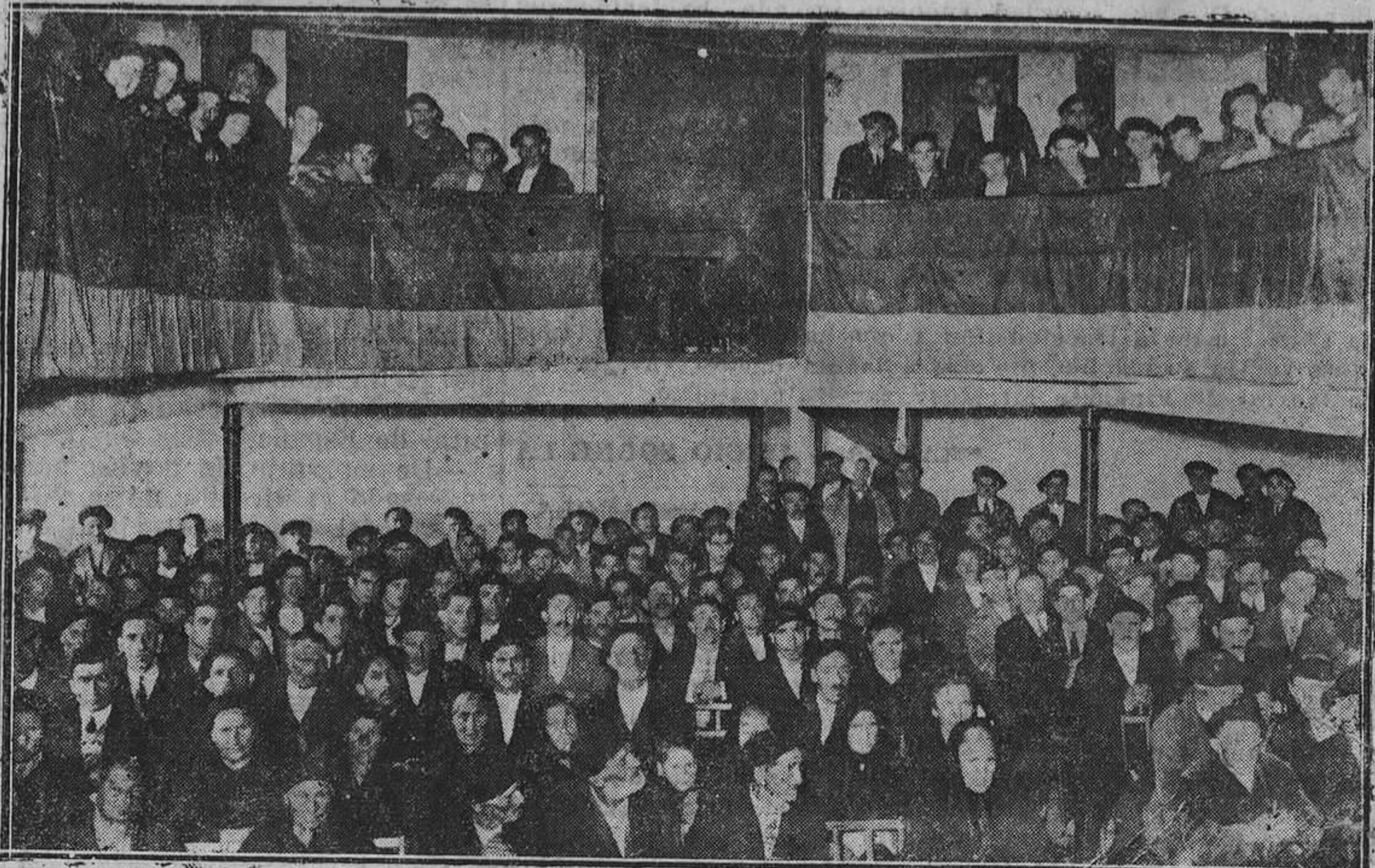
SOTRONDÍO.—Un aspecto del teatro de la Casa del Pueblo durante el homenaje a la vejez celebrado el domingo último.

Denunció el hecho a la policía, a la que manifestó que no