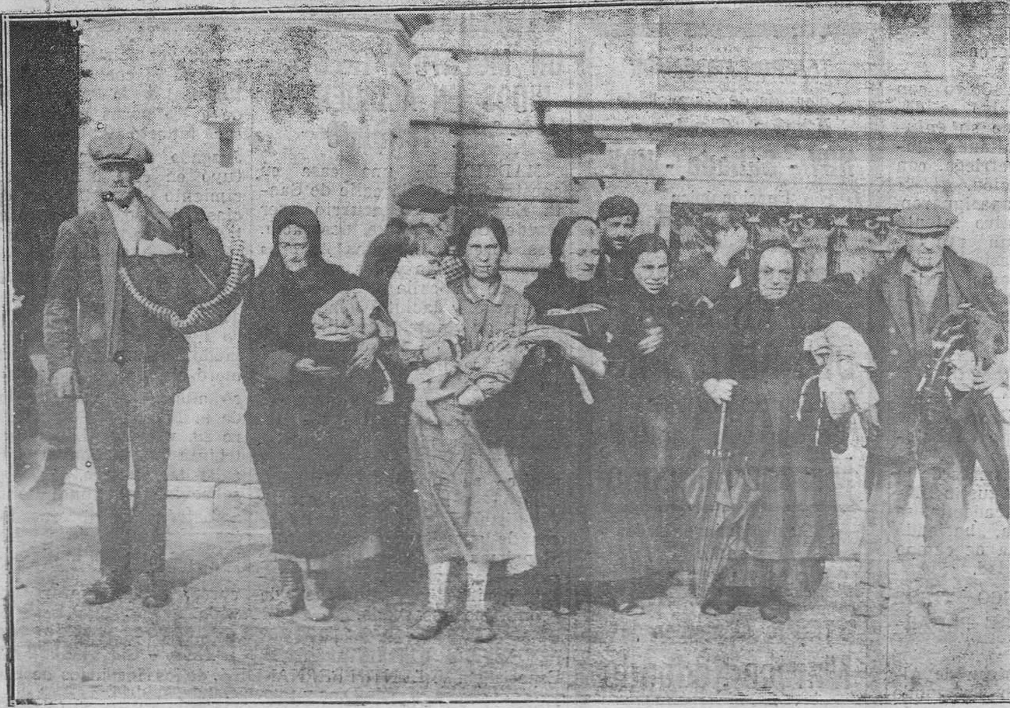
Madrid.-Familias pobres saliendo de Palacio, con las raras que les fueron entregadas.

Cuando el pastor se dió cuenta de ello volvió a pedirle: —Llévate todo el que necesites—. Y se alegró al pensar que aquel hombre no podía hacerse nada. Pero el hombre se inclinó sobre la hoguera, y con sus desnudas manos sacó los carbones