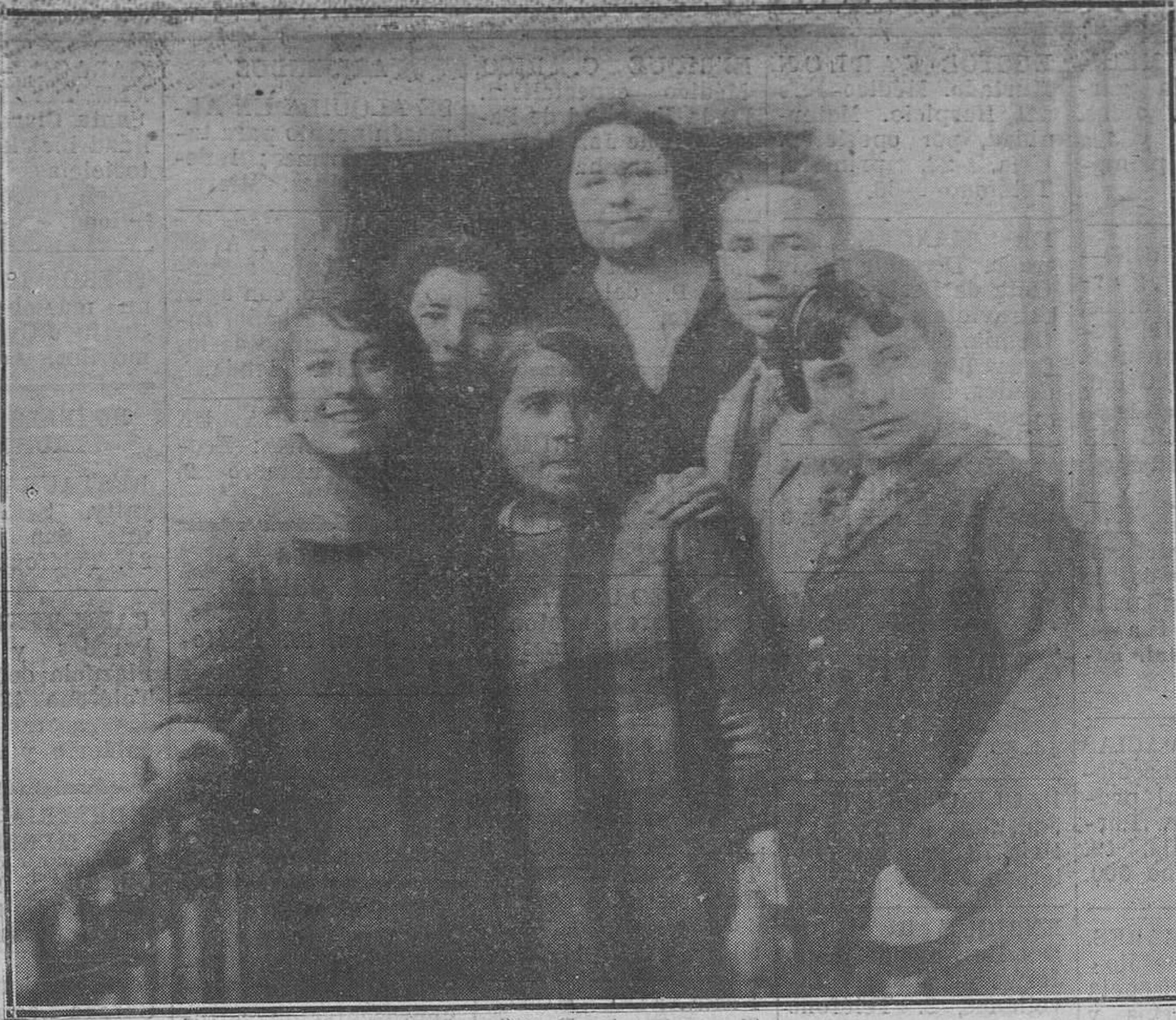
Madrid.-Un grupo de partícipes del premio "Gordo".

La Dirección general de Comunicaciones ha dispuesto que, a partir del día primero del próximo enero y durante todo el mes, se proceda a la renovación de las licencias de estaciones receptoras para radiodifusión, previo el pago de cinco pesetas para todo el año de 1928, considerándose como clandestinas todas las que existan después del 31 de enero, sin registrar y expuestos, por tanto, los poseedores a los perjuicios consiguientes.