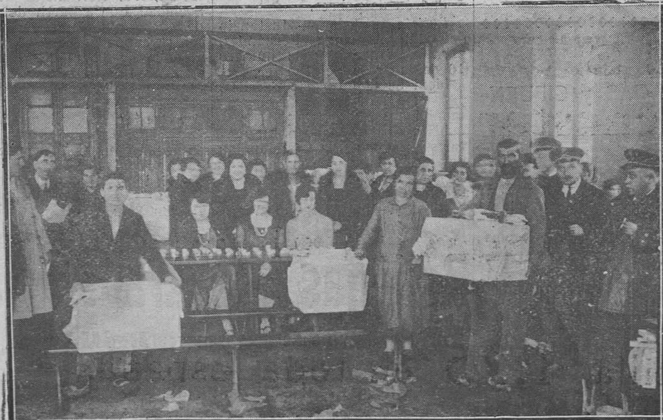
Trubia.-El reparto de turrónes y donativos en metálico a los obreros parados.