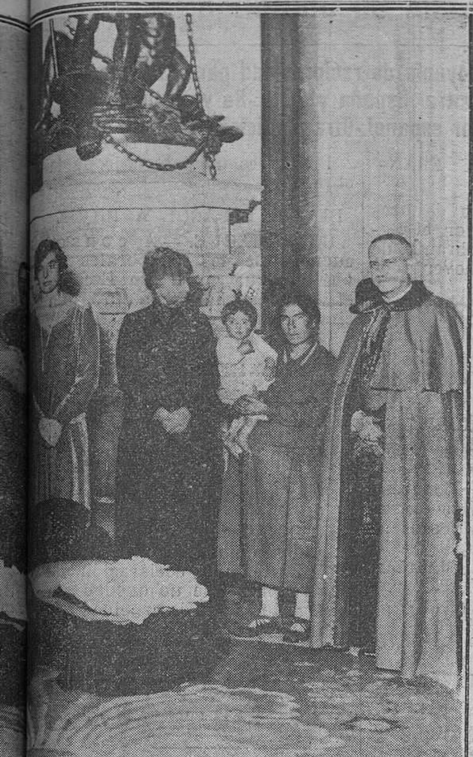
Madrid, con SS. AA. las Infantas doña Beatriz y doña Cris- teína, con el Ropero de Santa Victoria.