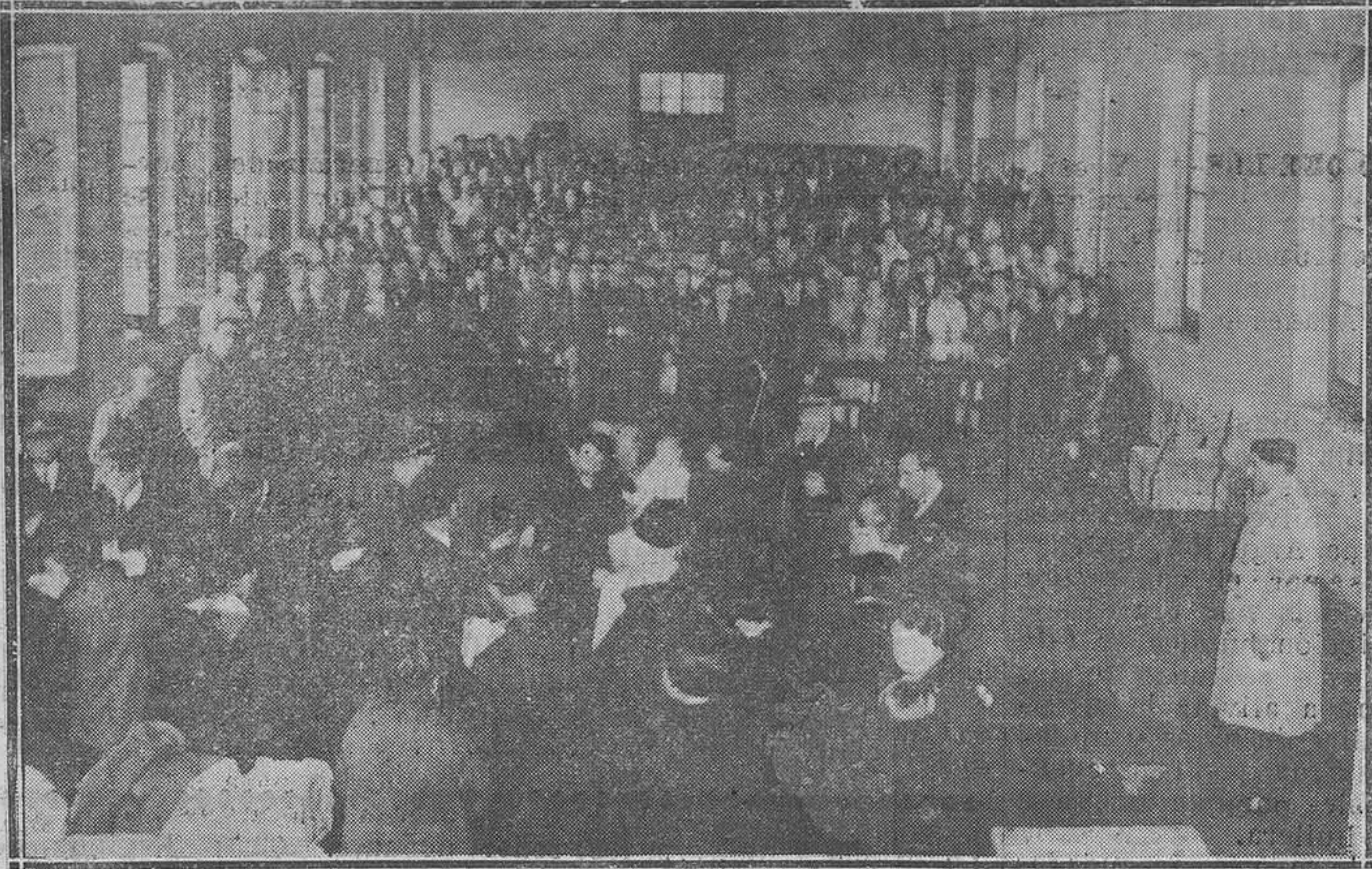
Trubia.-El comedor de la Fábrica, durante el reparto de turronec a las familias de los obreros parados.

Se aumentan 1.250 pesetas, a la renta que se satisface por la Diputación por el local en que se halla instalada la Escuela Pericial de Comercio de Oviedo.