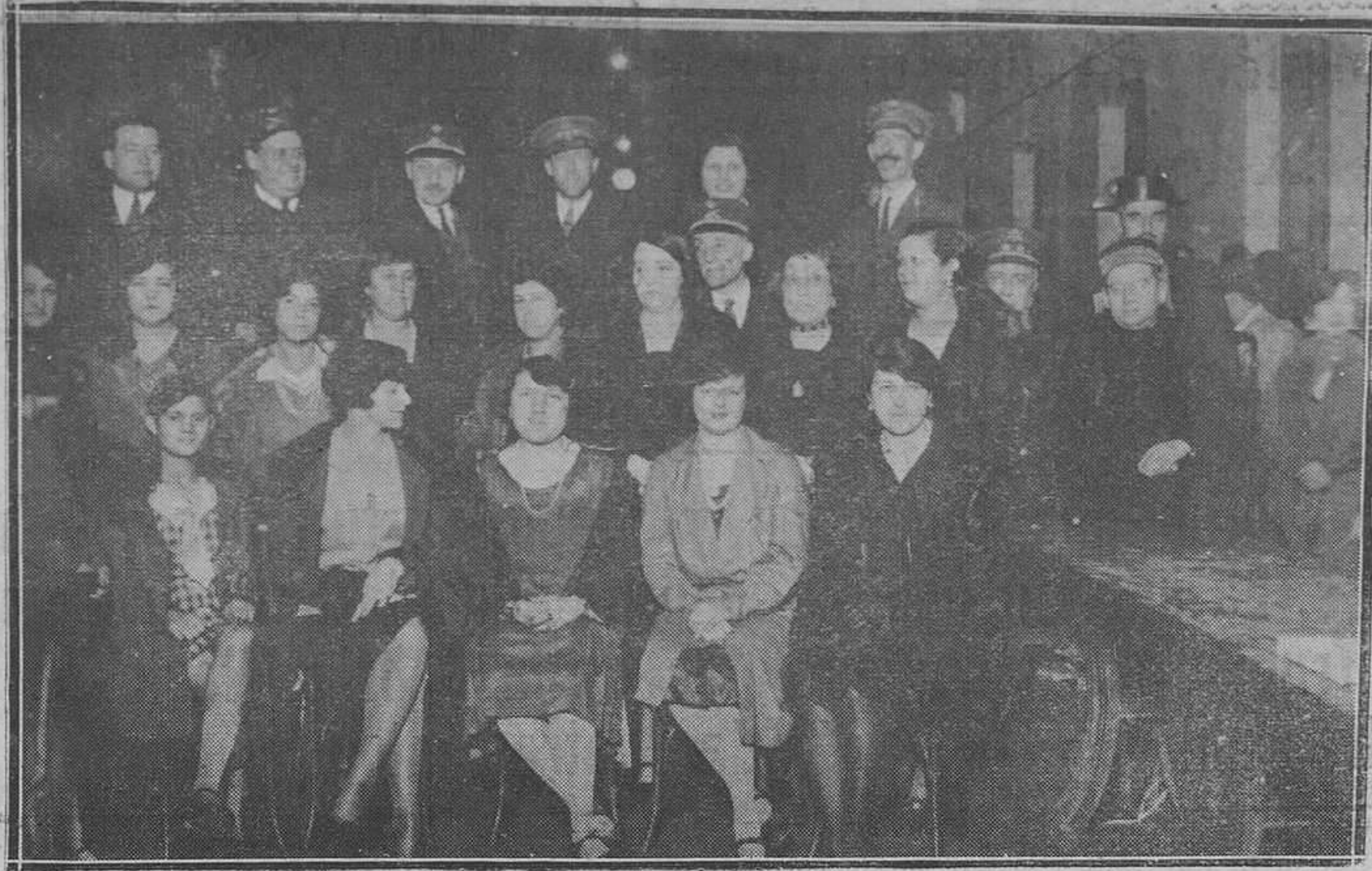
Trubia.-Familias de los jefes y oficiales de Artillería, que hicieron el reparto de los donativos a los obreros parados.

Y así en lista interminable hasta sumar unos cuatrocientos los niños socorridos.