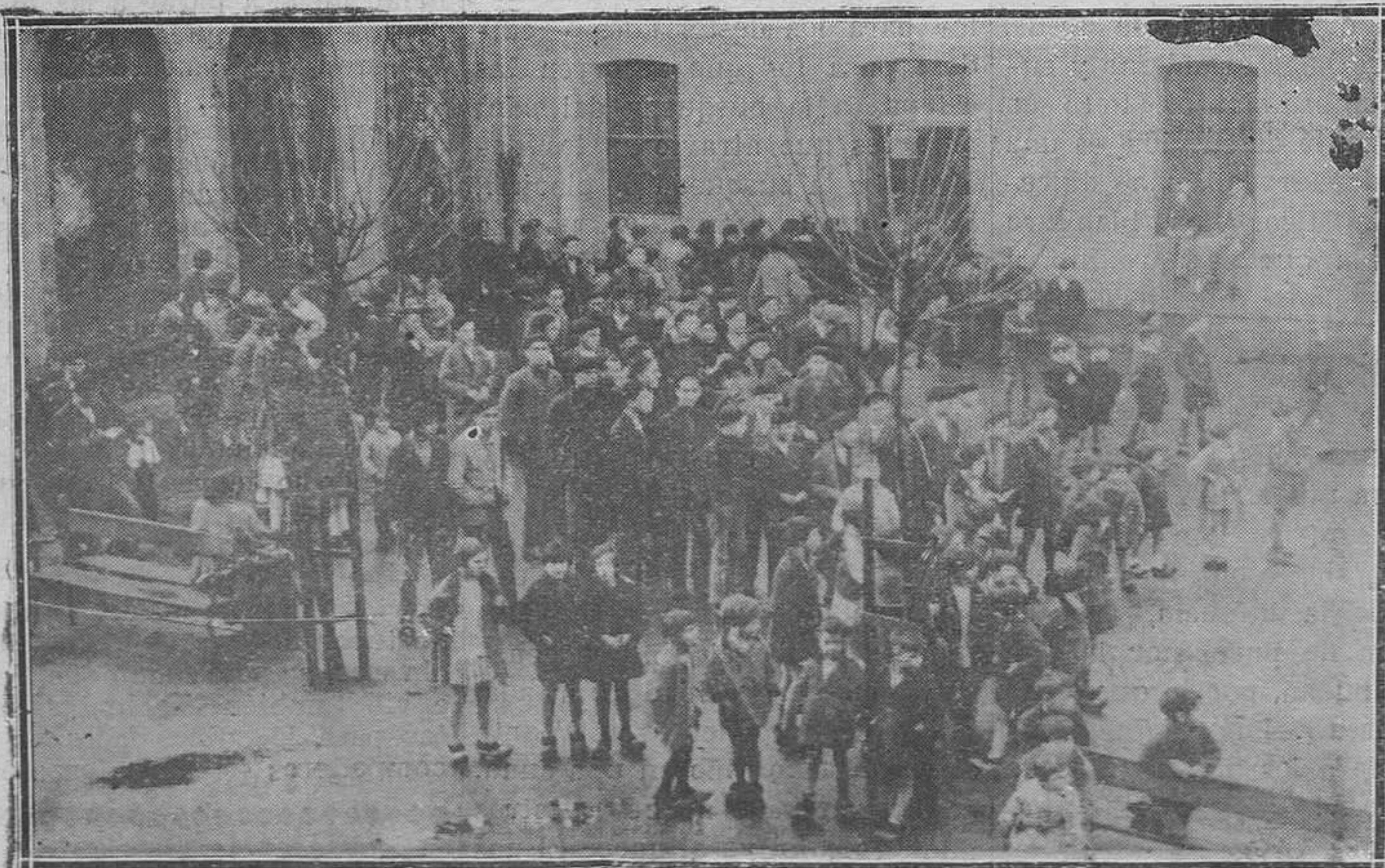
Trubia.-El público esperando el momento del reparto de donativos a las familias de los obreros parados.

Mieres, 20 de diciembre de 1927.—El presidente.