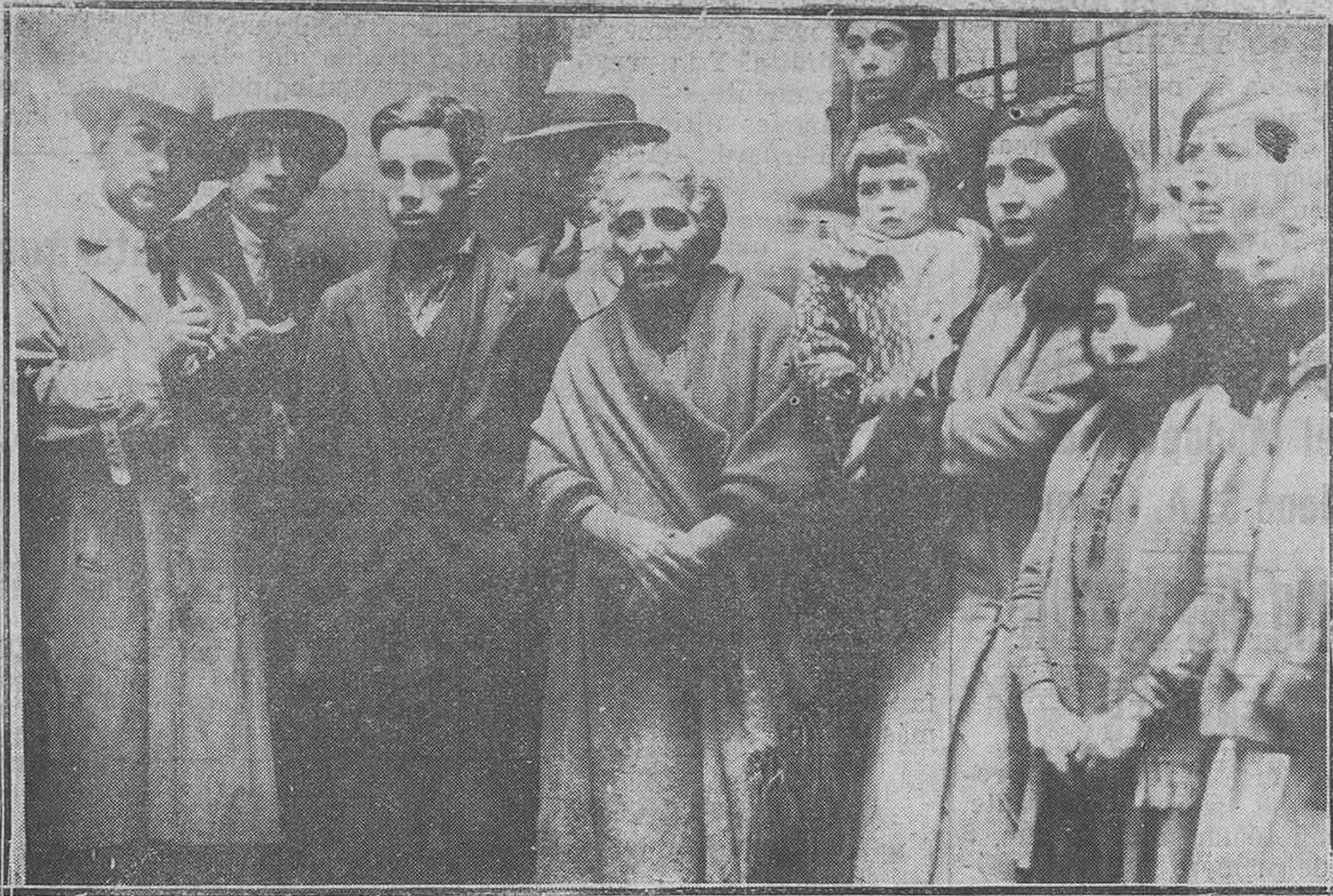
Madrid.—Vecinos de la casa número 4 de la calle de San Carlos, participantes del premio mayor.

F. Balbuena Suspende sus consultas hasta nuevo aviso