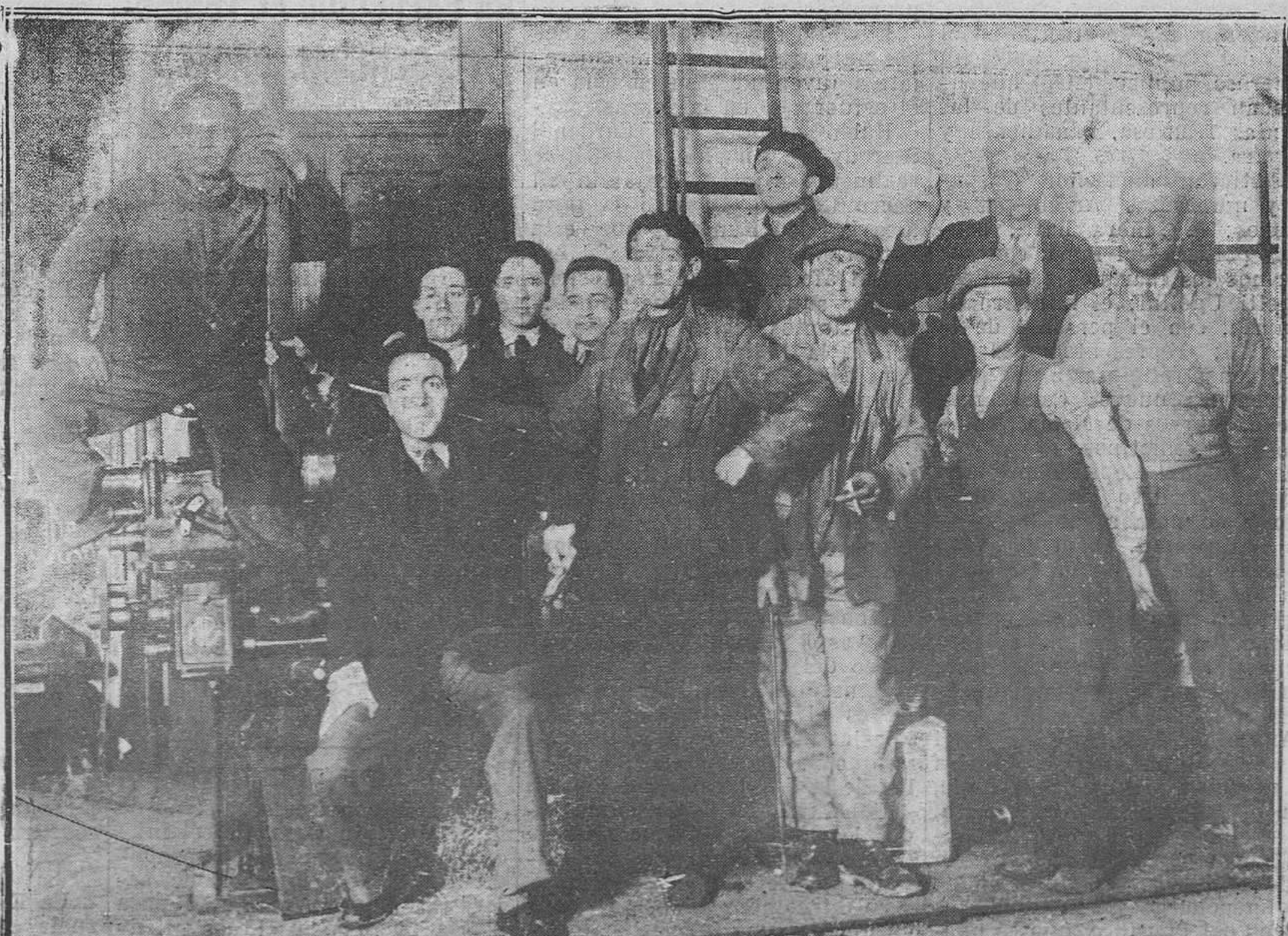
Madrid.-Empleados de los talleres del ferrocarril.