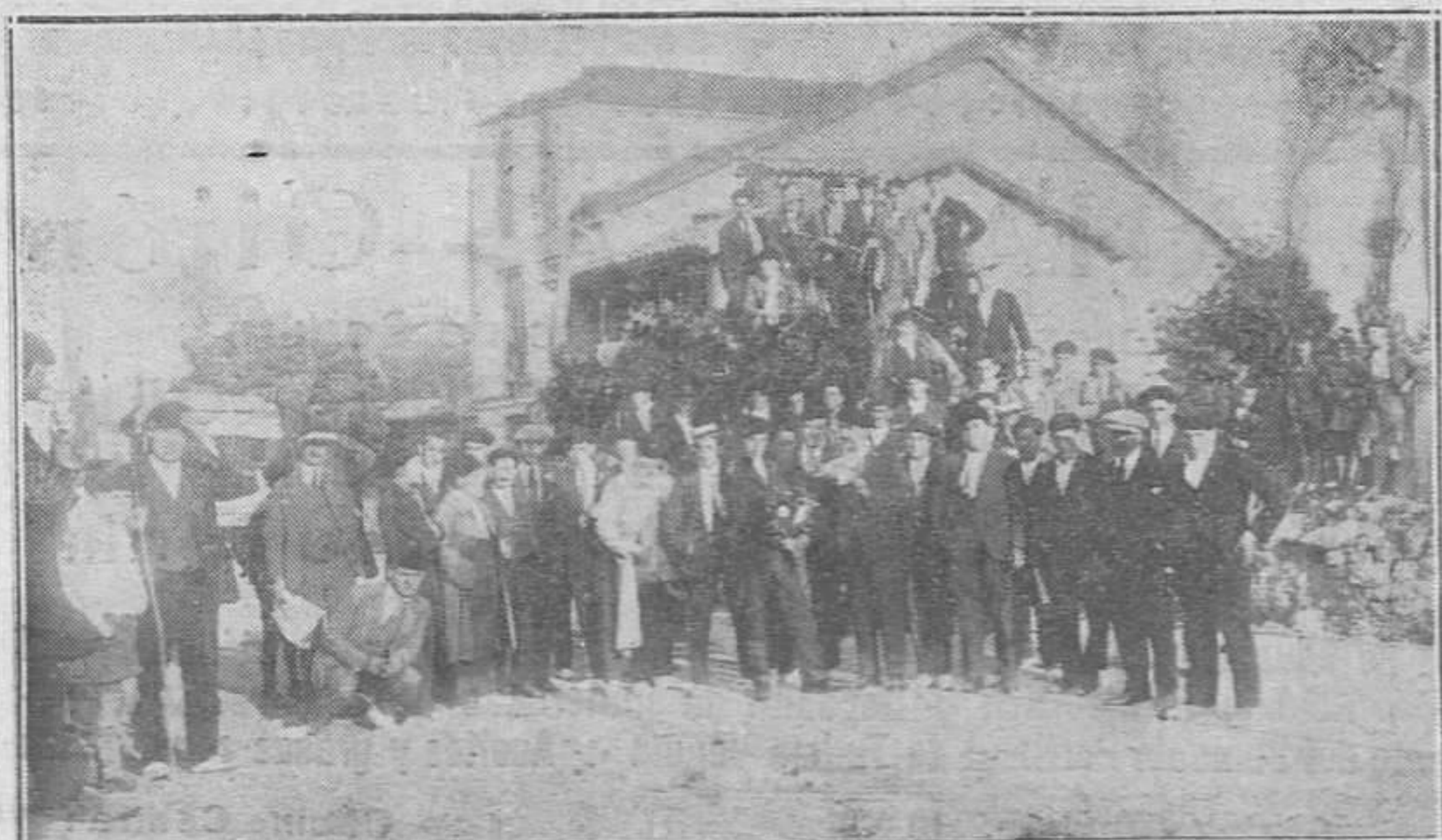
Los excursionistas de la Playa, al momento de partir hacia la costa para recorrer todas sus villas.