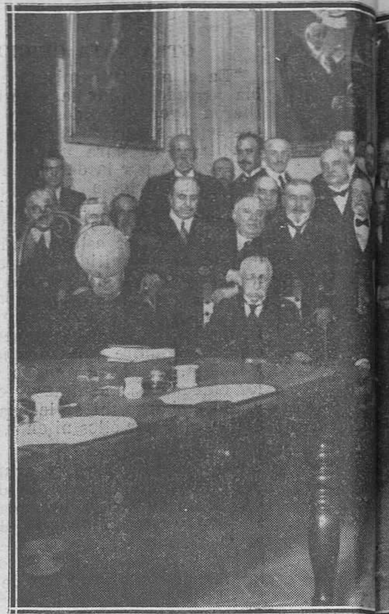
Los nuevos consejeros de Instrucción Pública, que han tomado posesión de su cargo.

Realizados con la mayor economía y a la vez con evidente solidez la estructura subterránea de la construcción en la Plaza de España, se acometió desde luego la elevación del basamento mediante sucesivos contratos de albañilería y cantería, en que llevamos invertidas pesetas 128.554,17 de las 139.405,31 que puso a nuestra disposición el ministerio, del resto de la suscripción nacional del Centenario. El Estado, por su parte, ha de atender a sufragar las 105.000 pesetas