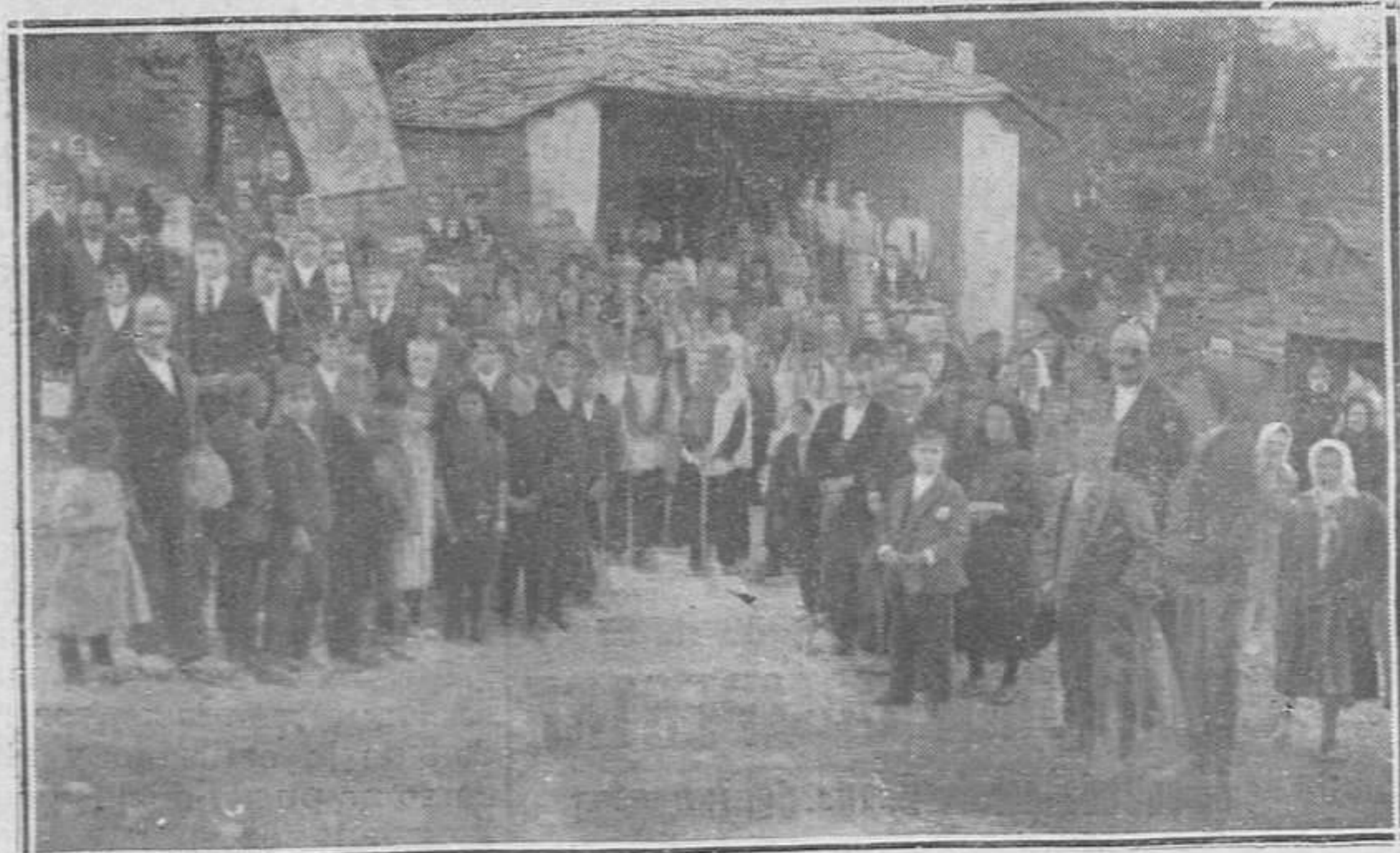
BALDEDO (VILLAYOR).-Una procesión al salir de la capilla de San Cipriano