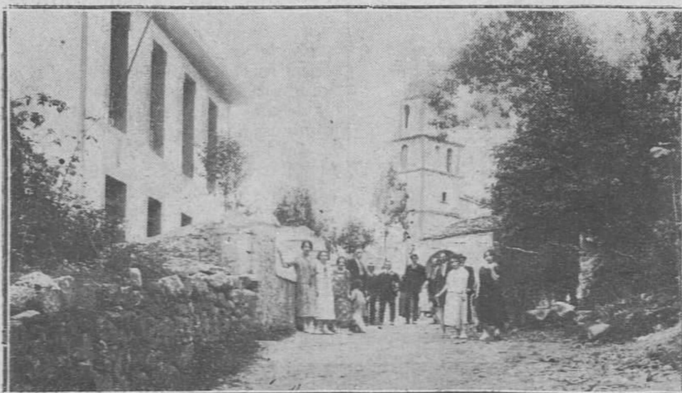
SOTO DE AGUES (SOBRESOBIÓ).-La Iglesia y Escuelas donde se levanta el busto del inolvidable don Fermín Canella. (Coto Corián)

En Pesetas o Moneda Extranjera, a la vista y a plazos, con abono de intereses a tipos muy favorables