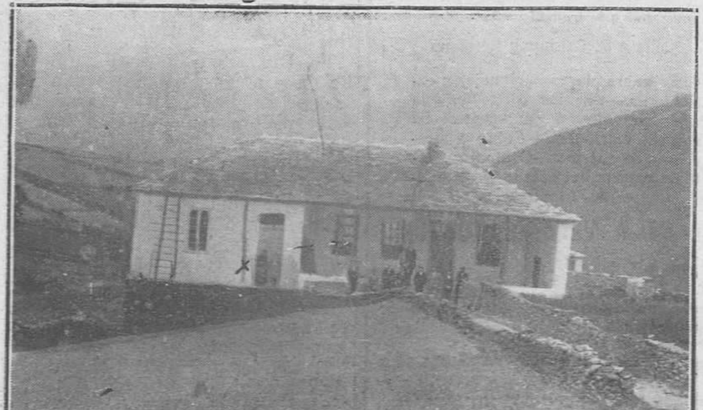
Local-escuela de Lendiglesia (Boal), últimamente bendecido.-(X). La señora maestra de dicha escuela.