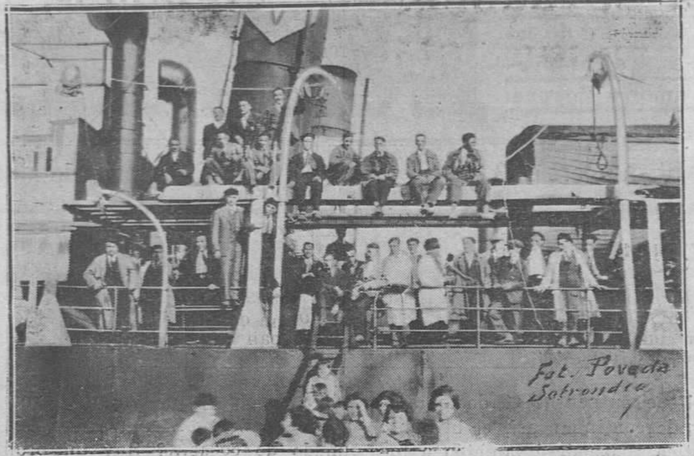
Los excursionistas de San Martín del Rey Aurelio a bordo del vapor J. Villaonga, anclado en el puerto de San Esteban.