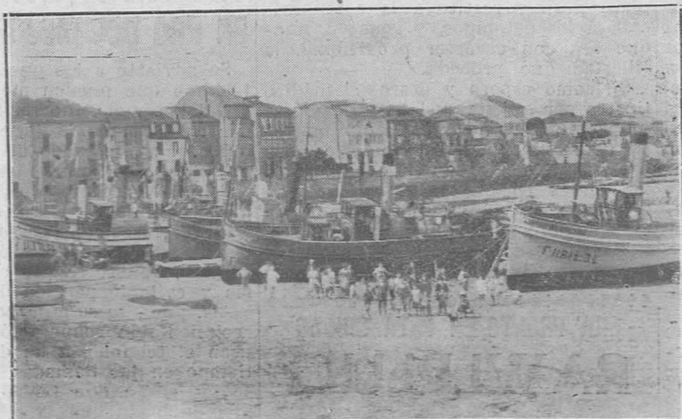
LLANCO.-Los vaporcitos pesqueros preparándose para la próxima costera de honito.

Igual que la romántica república española cayó una tarde muerto sobre la senda sola, como en la selva un roble con el ramaje en flor