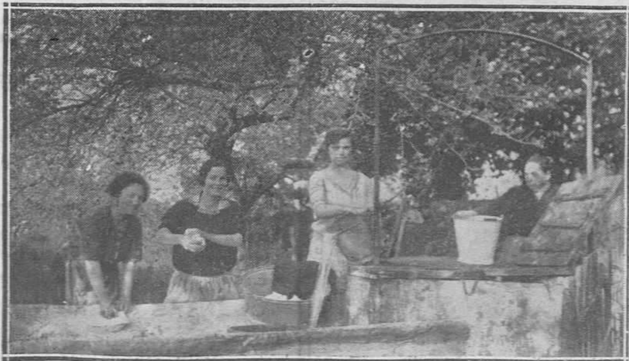
MOREÑA.—En la posesión del señor Cuesta, gobernador civil de Palencia.