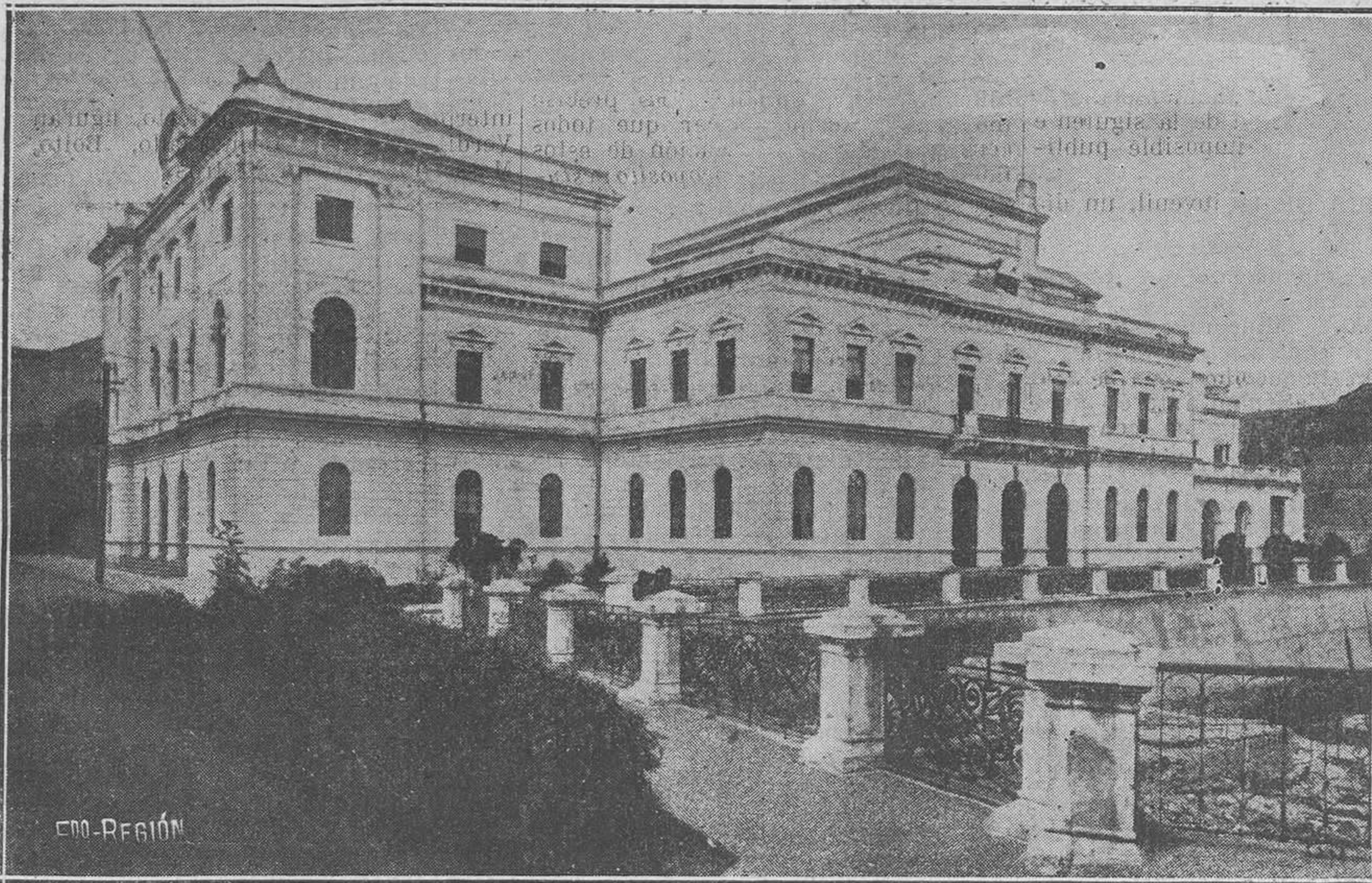
BUENOS AIRES.—Un Asilo.

conducir desde Arriondas a Covadonga a los peregrinos.