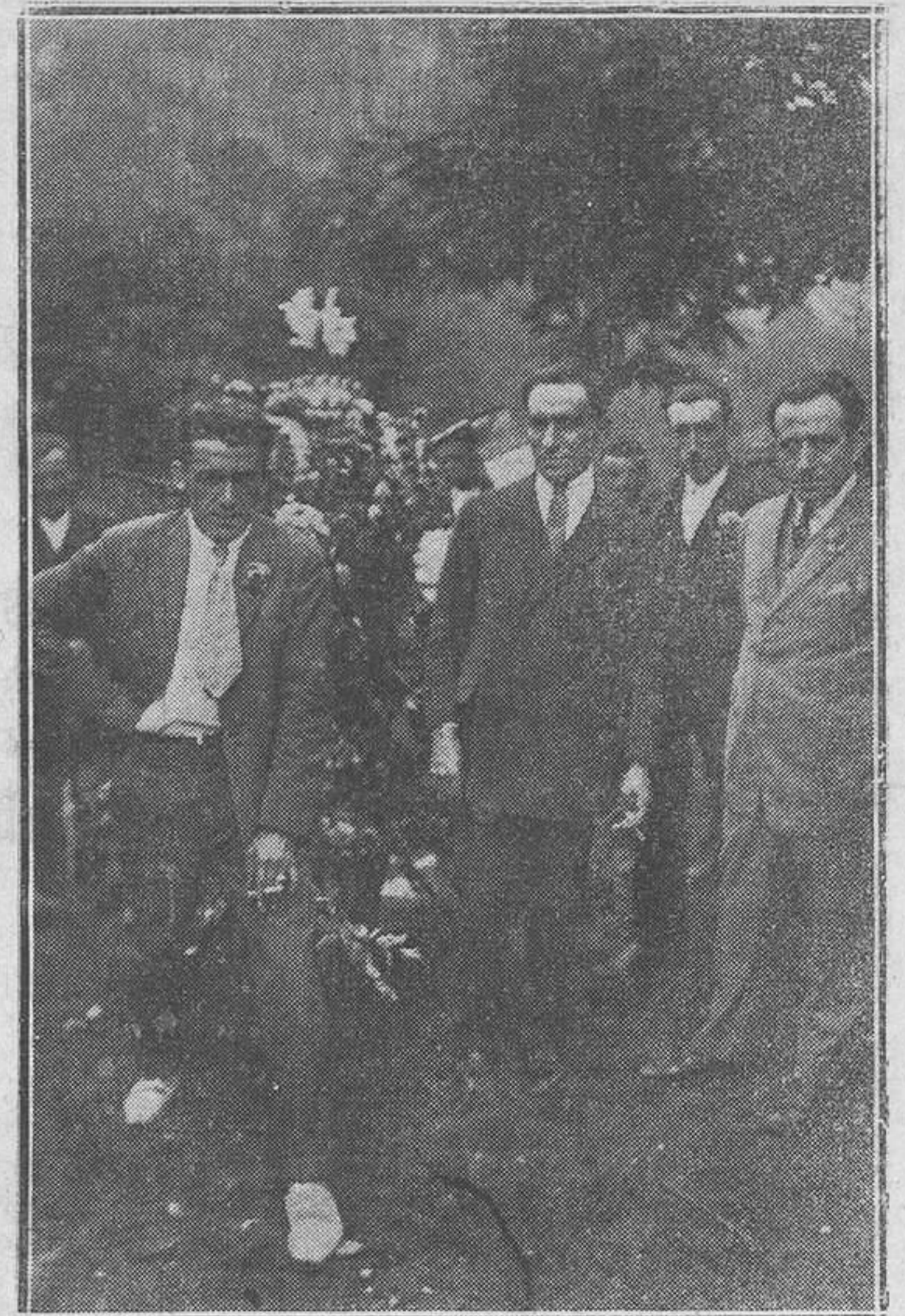
CAMPO DE CASO.-Distinguidos jóvenes de la localidad, portadores del ramo de pan.

En lo que concierne al cumplimiento de la honrosísima misión que Vuestra Majestad se dignó confiarnos cúmplenos, Señor, solicitar reverentes la indulgencia que merezca nuestro buen deseo, reconociendo que tal vez no hemos desplegado siempre toda la actividad enérgica que requería la solución de las dificultades naturales en empresa tan compleja, y prometiendo fervorosamente no desmayar en adelante, con la ayuda que esperamos de todas las naciones, entidades y personas