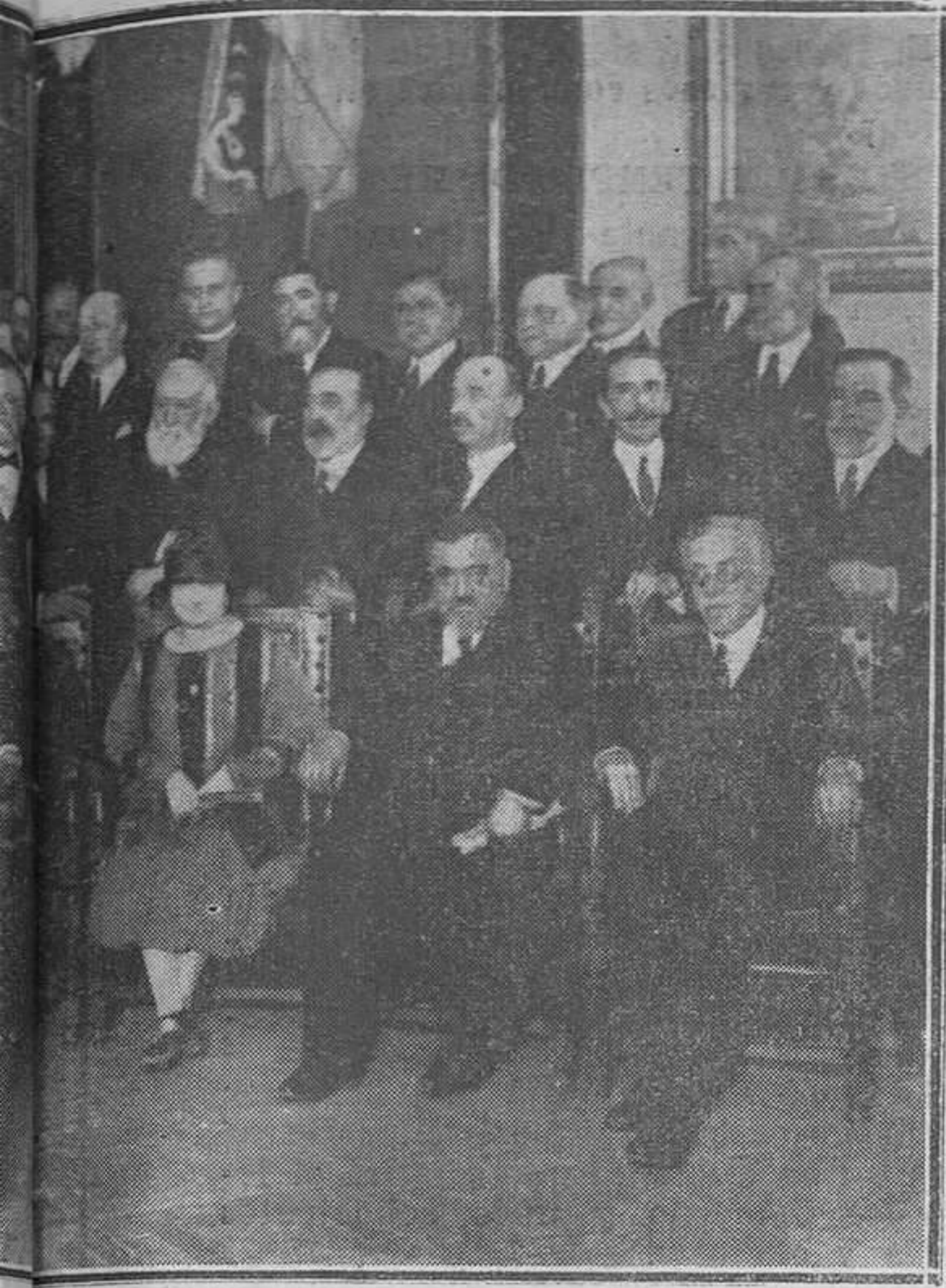
de su cargo, en sesión presidida por el ministro del ramo, señor Callejo.

... cree llegado el caso de dar gran impulso a la suscripción en toda España y en las naciones de habla española, porque ya no se trata de una de tantas primeras piedras, sino de la prosecución activa