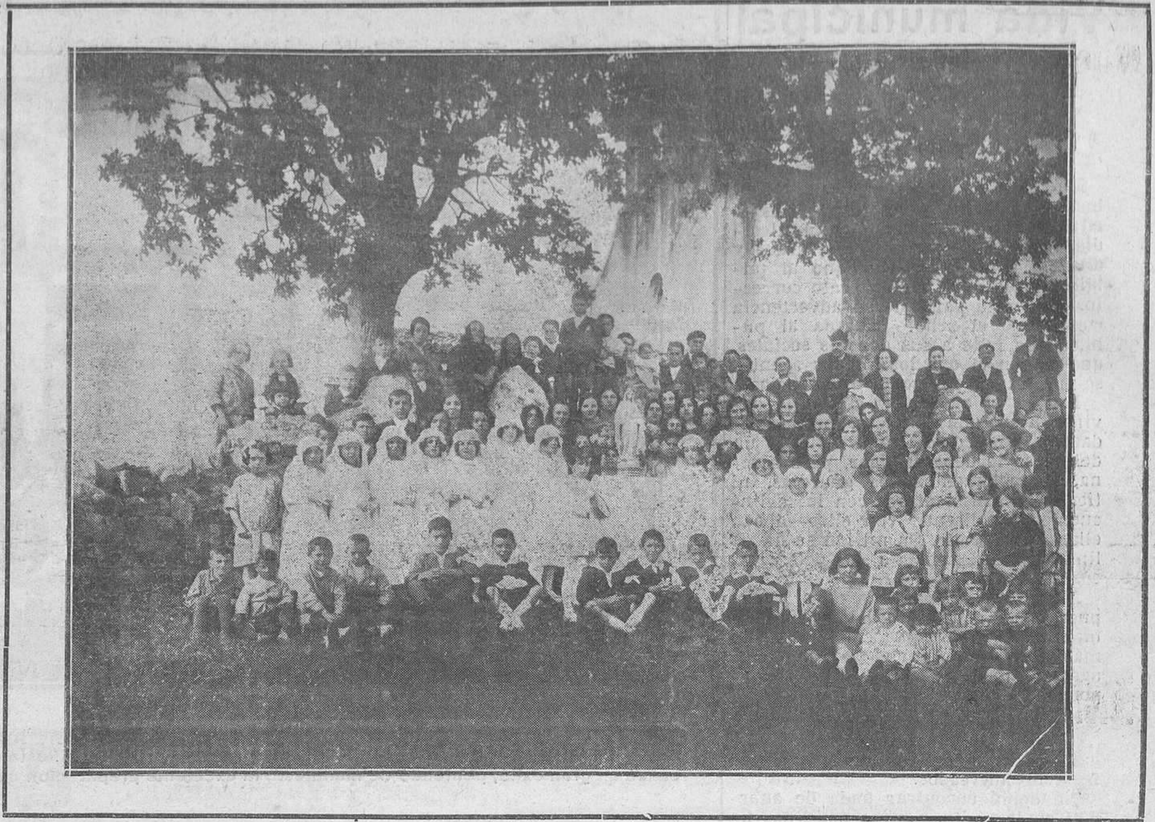
RANÓN (SOTO DEL BARCO).--Grupo de niñas que celebraron su primera comunión y demás niños pertenecientes al Catecismo de la parroquia.

La falta de viviendas en Trubia, propiamente dicho, y la nombrada Fábrica de Trubia, encerradas en el ángulo formado por las envidiables vías de comunicación del ferrocarril del Norte y Vasco, entorpece el ensanchamiento comercial, por no contar casi con otras viviendas que las que la Fábrica de Cañones ha construído para sus obreros, siendo un problema insoluble para empleados y obreros que no pertenecen a la Fábrica de Cañones, encontrar el alojamiento cerca de los talleres donde prestan sus servicios. La huida de trabajado-