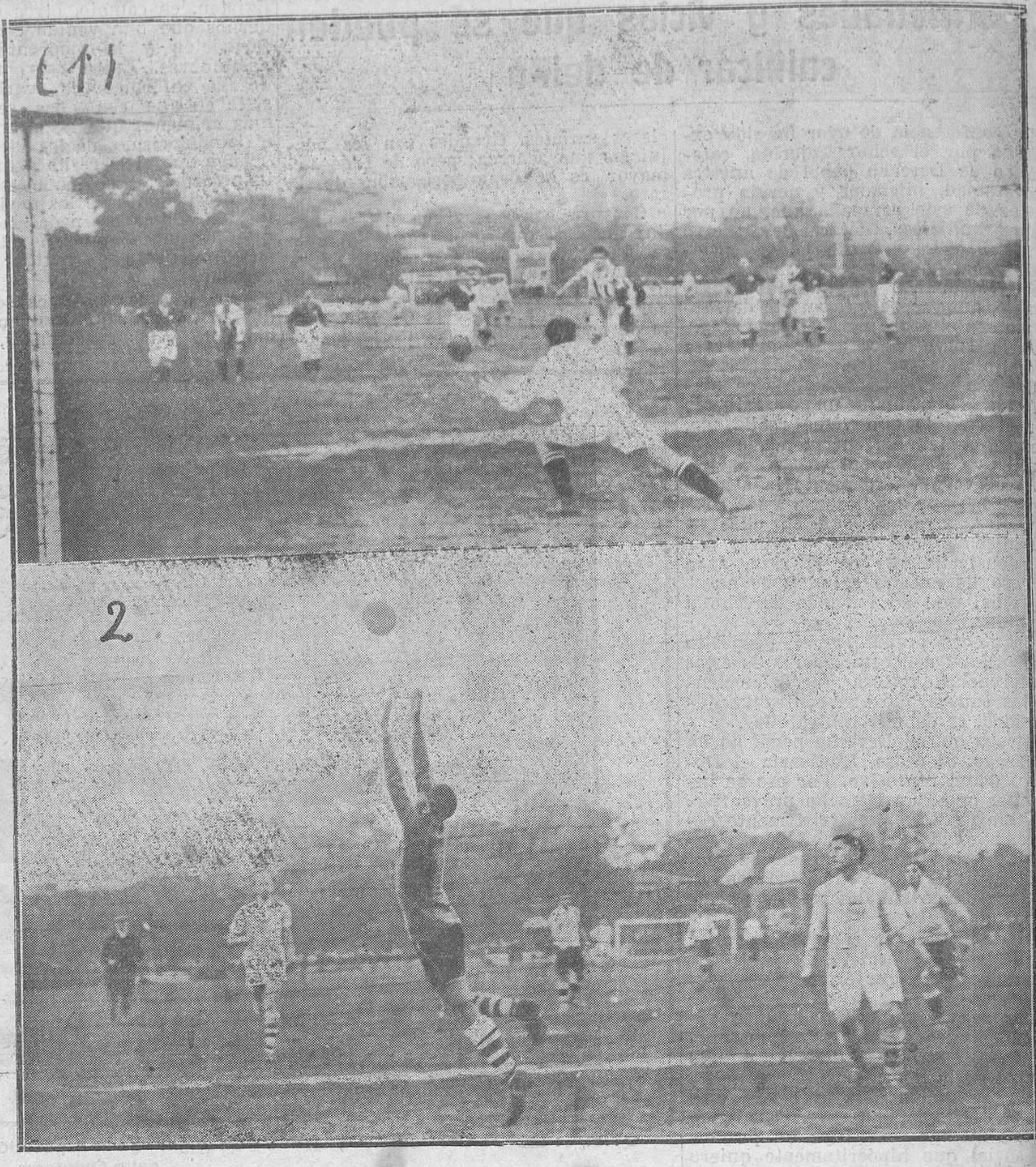
EL FUTBOL EN LA OLIMPIADA DE PARIS.—(1) Un momento del partido "Checo-Eslovaquia-Suiza". (2) Un momento del partido "Uruguay-Estados Unidos".

El Unión Arenas Astur y el Sporting de Santo Domingo dilucidaron ayer su partido de desempate pendiente. El triunfo, que llevó consigo el titularse campeón de Oviedo en segunda categoría, correspondió al Unión Arenas Astur por una diferencia de dos tantos. El juego de ambos equipos, sólo