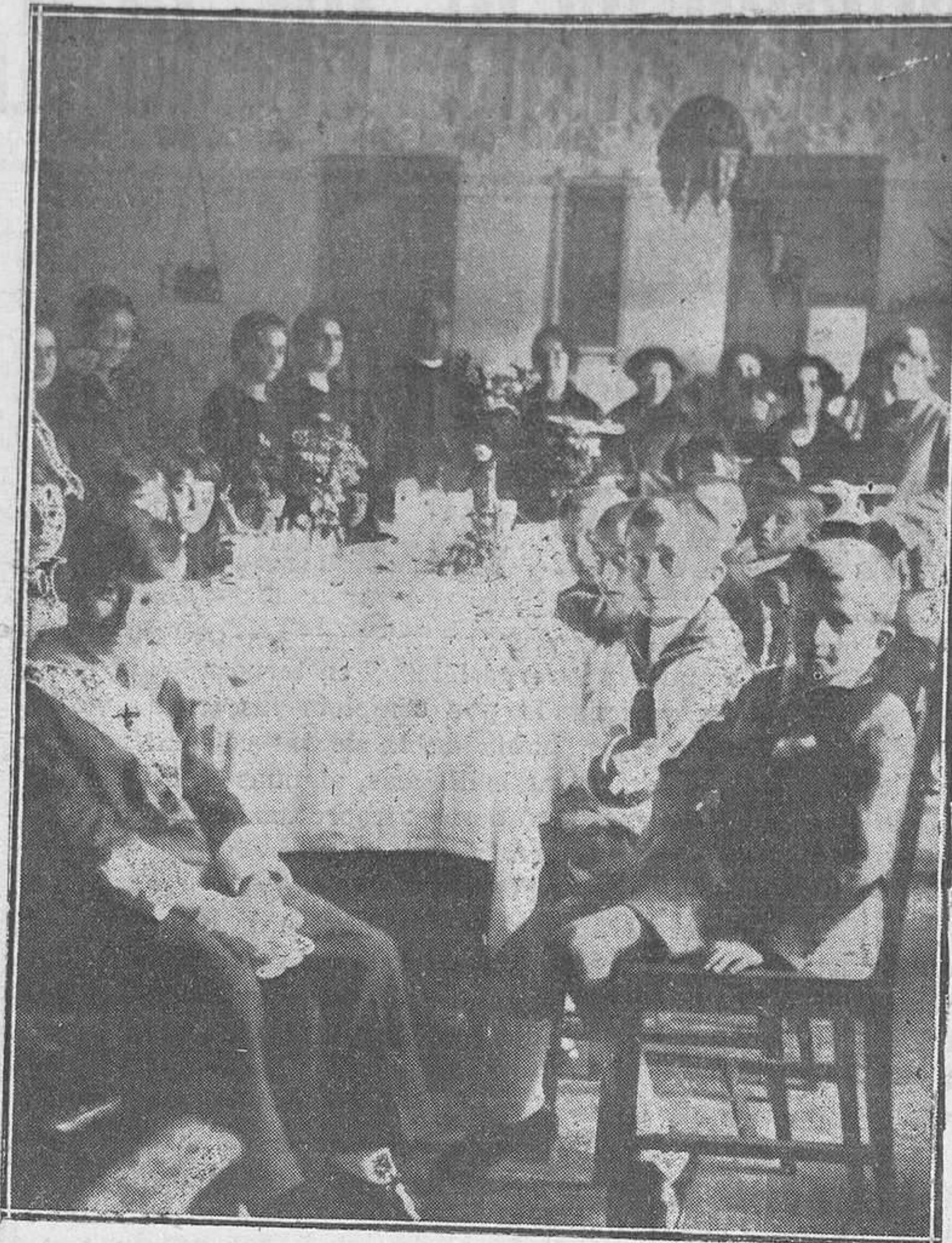
NAVIA: PRIMERA COMUNIÓN DE NIÑOS. —Los niños de familias humildes que asistían al Catecismo e hicieron la primera comunión, con el hijo del dueño del Hotel Mercedes. Fueron obsequiados por su compañero con un espléndido almuerzo ese día. La sección de la Acción Católica de la Mujer "Ropero de los pobres" donó a cada uno de los niños un traje y los hermosos lazos y medallas de primera comunión.

Segundo. Dirigirse a los Ayuntamientos y entidades industriales de la provincia para que contribuyan a la