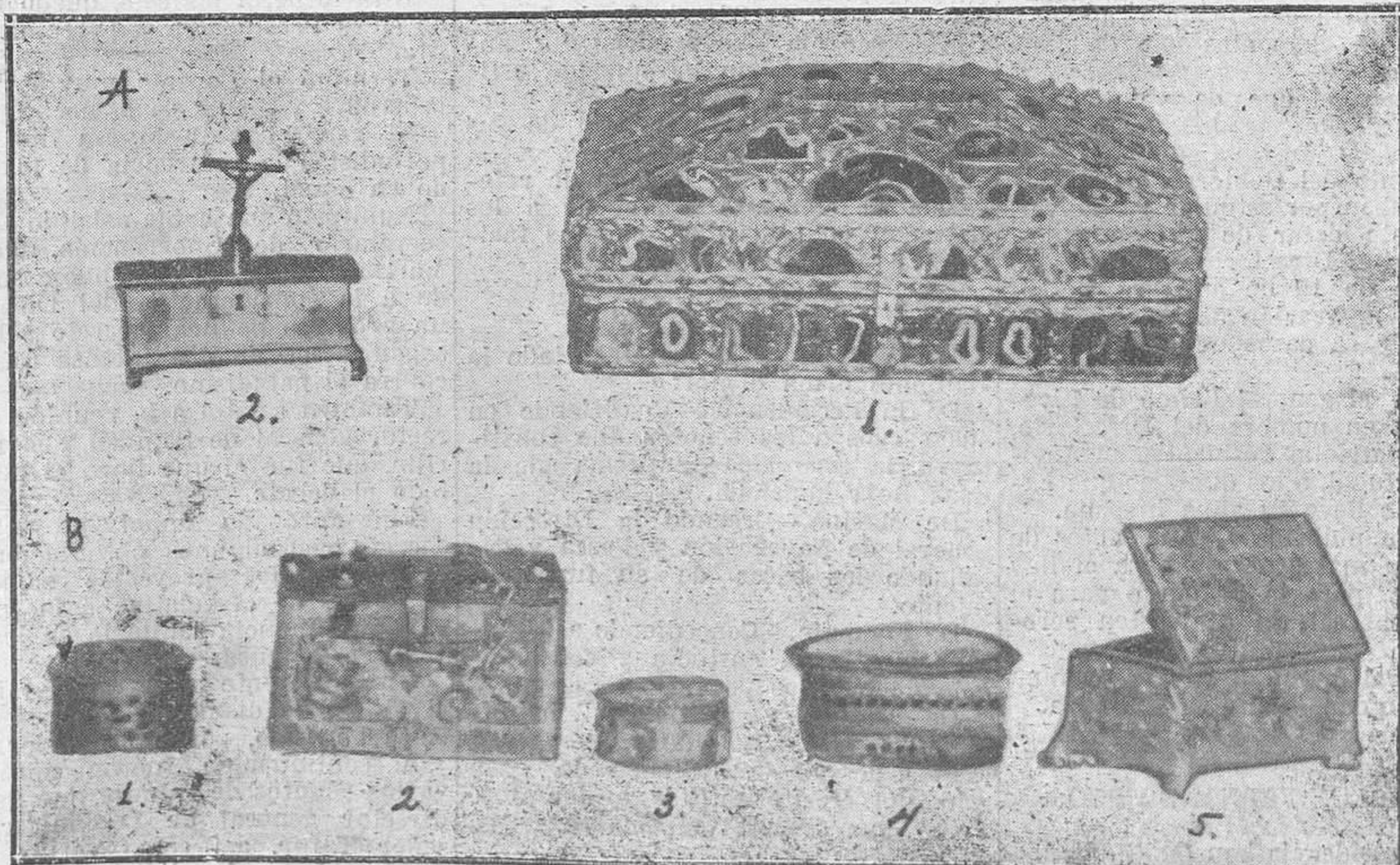
GRABADO A.—(1) Cofre llamado de las "Calcedonias"; (2) cajita de plata denominada de la Virgen María, en los que aparecieron los cinco estuches conteniendo innumerables reliquias. GRABADO B.—(1) Cajita de oro y coral. (2) Cofre de oro y piedras preciosas. (3) Cajita de plata cincelada. (4) Cajita de oro y piedras preciosas con tapa y fondo de cristal. (5) Cofre de oro y coral, de la misma factura que la señalada con el núm. 1.

hubo aún tiempo material para dedicar a estas reliquias el detenido estudio que hemos de hacer, pero lo que he observado ya he advertido lo bastante para convencirme de que las mismas reliquias, no me la forma en que están clasificadas, no hacen falta para confirmar su perfecta autenticidad, desde luego, si se ha reparado por ningún objeto de cuántos los pasa-