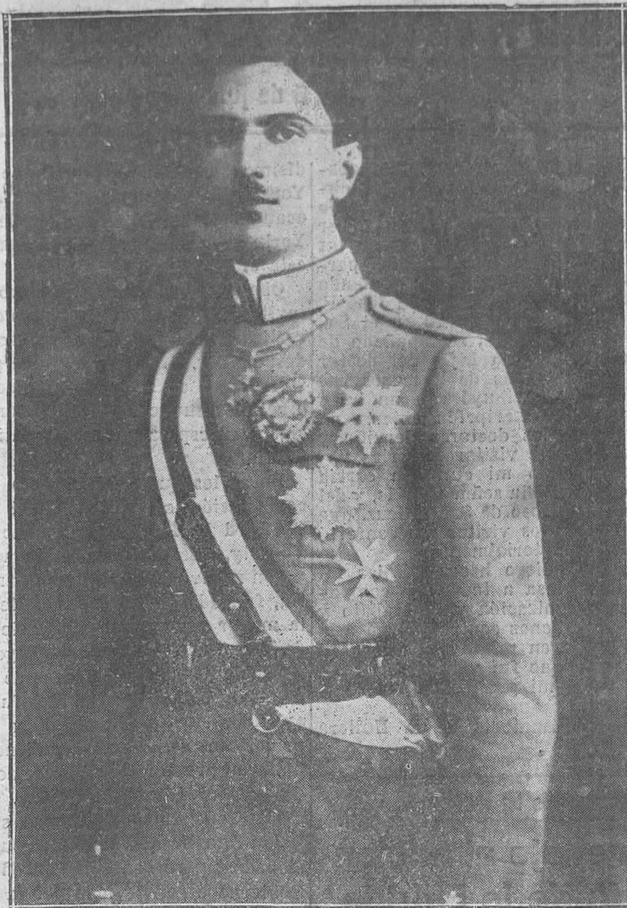
El príncipe del Piemonte, heredero del trono de Italia, que acompaña a sus augustos padres en su viaje a España.