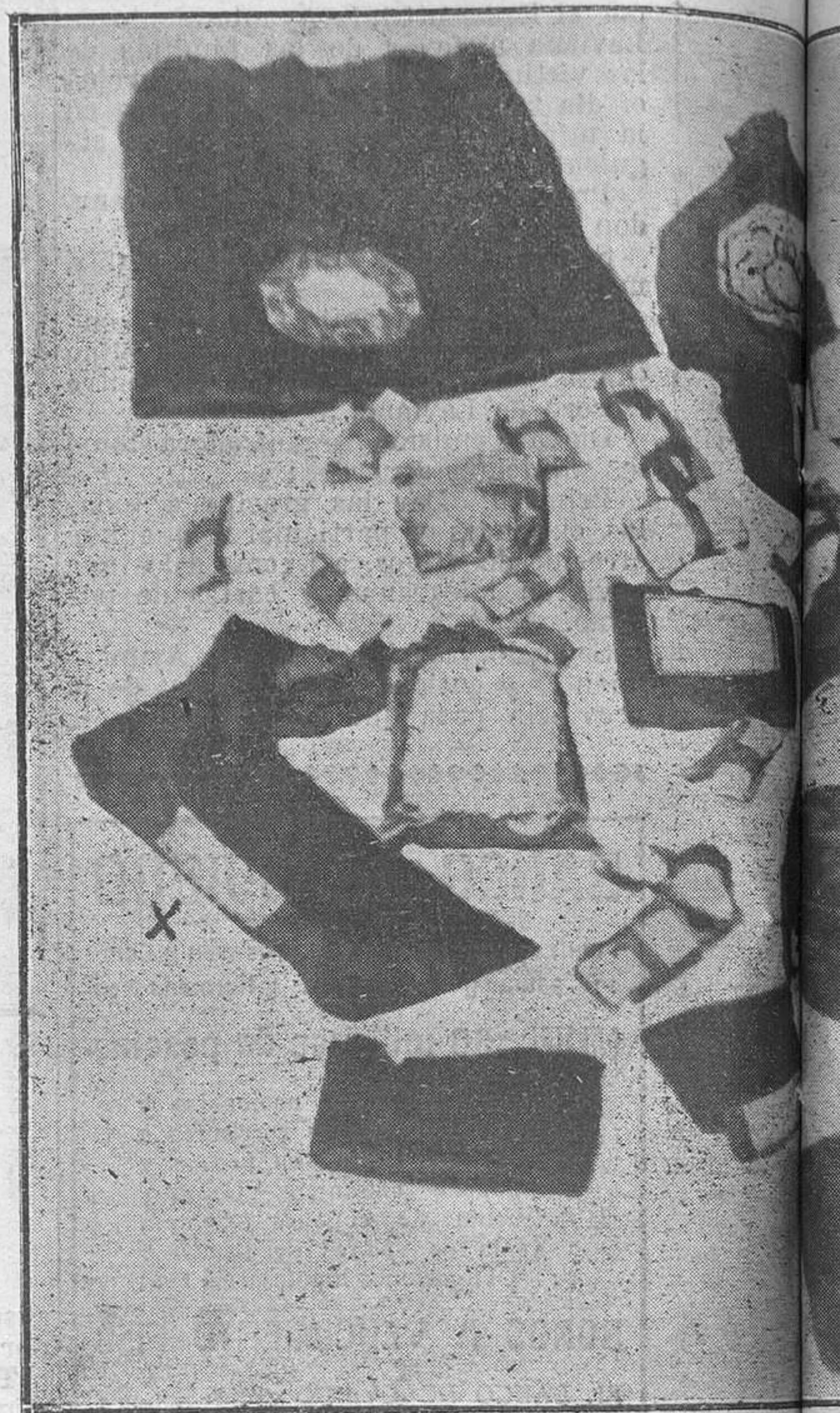
Una pequeña muestra de las innumerables bolsitas que hay en el Arca que se conservaba en la Cámara Santa de la costilla de Santia.

—¿Puede caber en la cabeza de nadie que los primitivos cristianos, que los discípulos de los Apóstoles y del mismo Jesucristo, no se hubieran preocupado de recoger recuerdos y reliquias de todo género, relacionados con Nuestro Señor, con su Madre Santísima y con los Apóstoles? Si los griegos, ante Troya, se disputaron, como