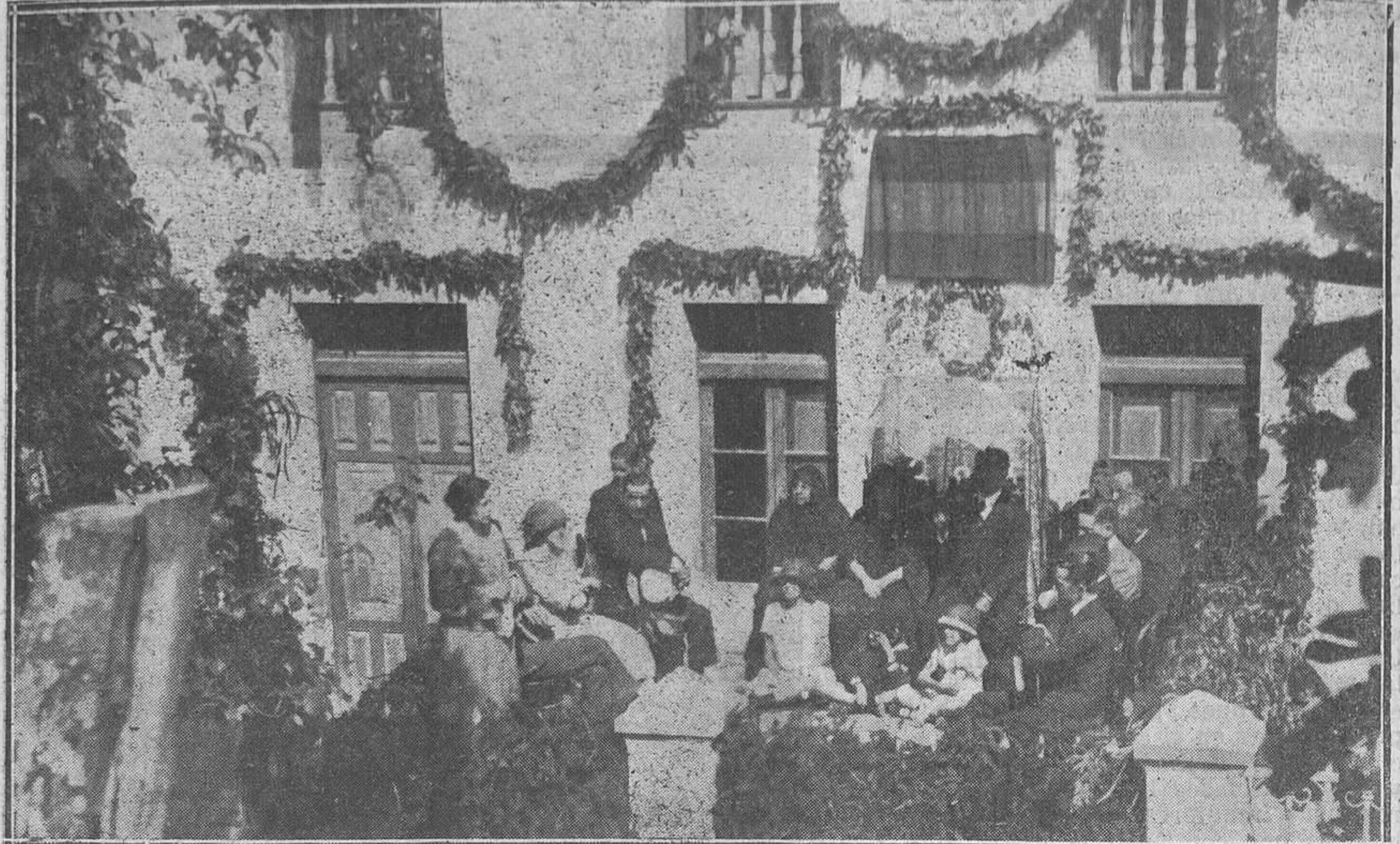
SOTO DE AGUES (LAVIANA) SOBRESOBIO.--Presidencia de la fiesta escolar celebrada recientemente y que alcanzó un gran éxito, poniendo de manifiesto la excelente preparación de los alumnos que concurren a las Escuelas.

Desde tiempo inmemorial las autoridades han dictado enérgicos bandos para combatir el feo y soez vicio de la blasfemia; aquellos bandos, por su incumplimiento, pasaban a ser letra muerta.