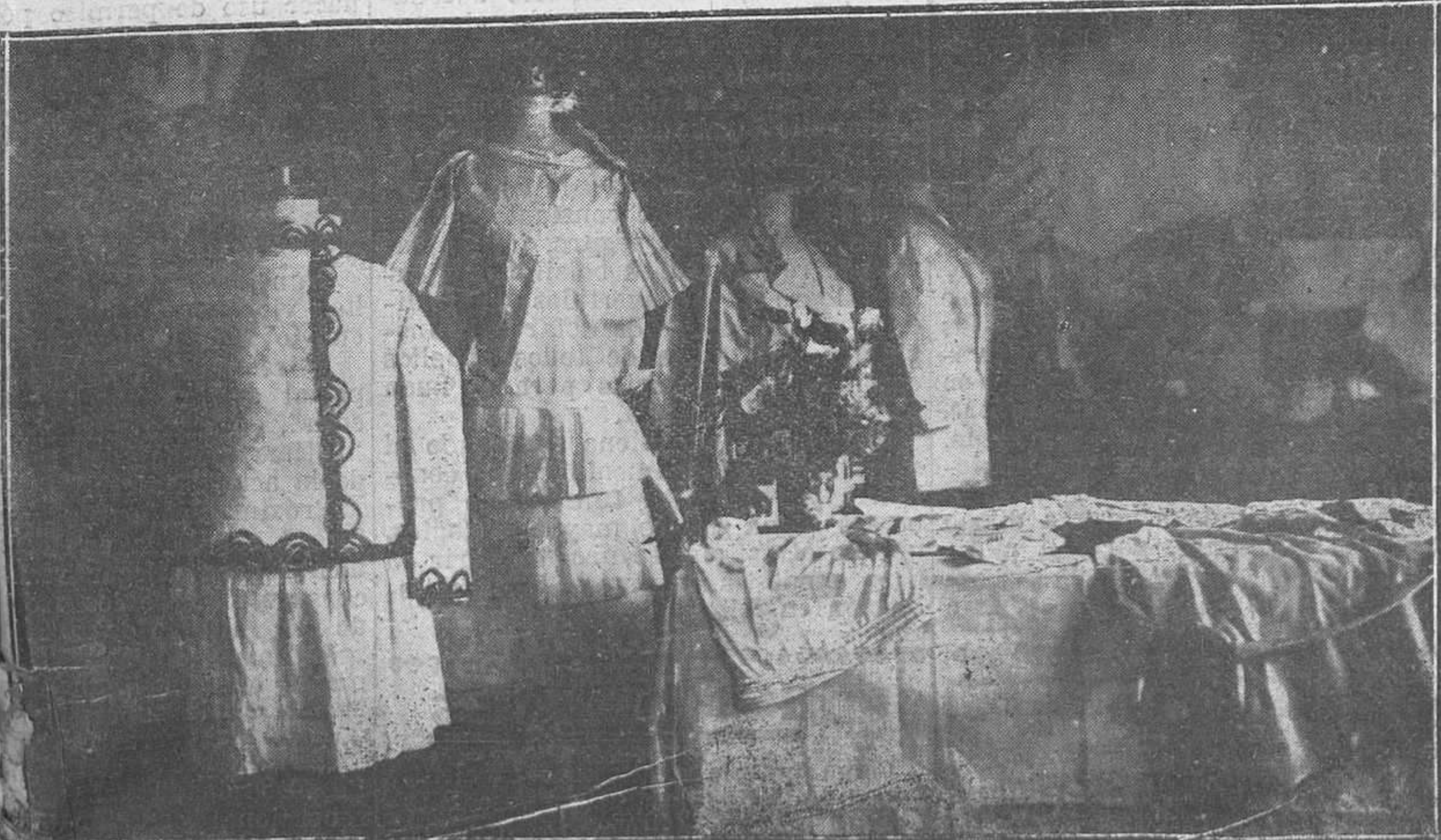
OVIEDO: EXPOSICIONES ESCOLARES.—Una sección de corte y confección de la Exposición instalada en las Escuelas del Postigo.

Pañería fina y géneros ingleses por metros