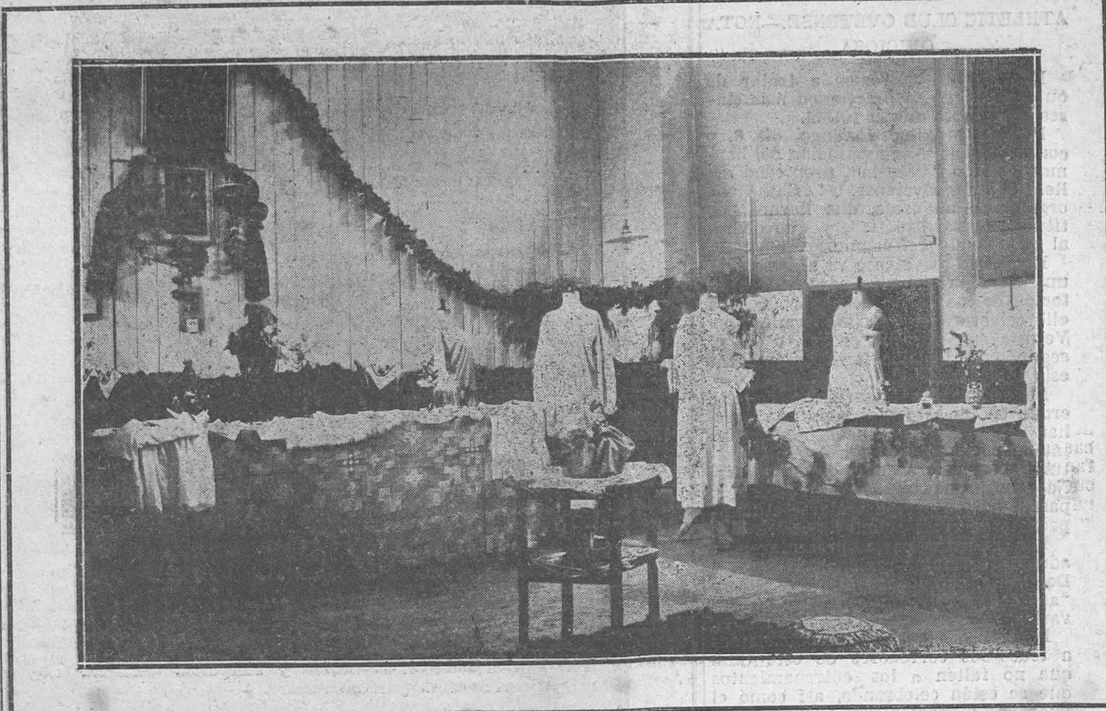
OVIEDO: EXPOSICIONES ESCOLARES.—Un ángulo de la Exposición de corte y confección en las Escuelas de la calle Quintana.

Trata a continuación de la tuberculosis, que califica de delito cuando se contagia por matrimonio u otra suerte de medios.