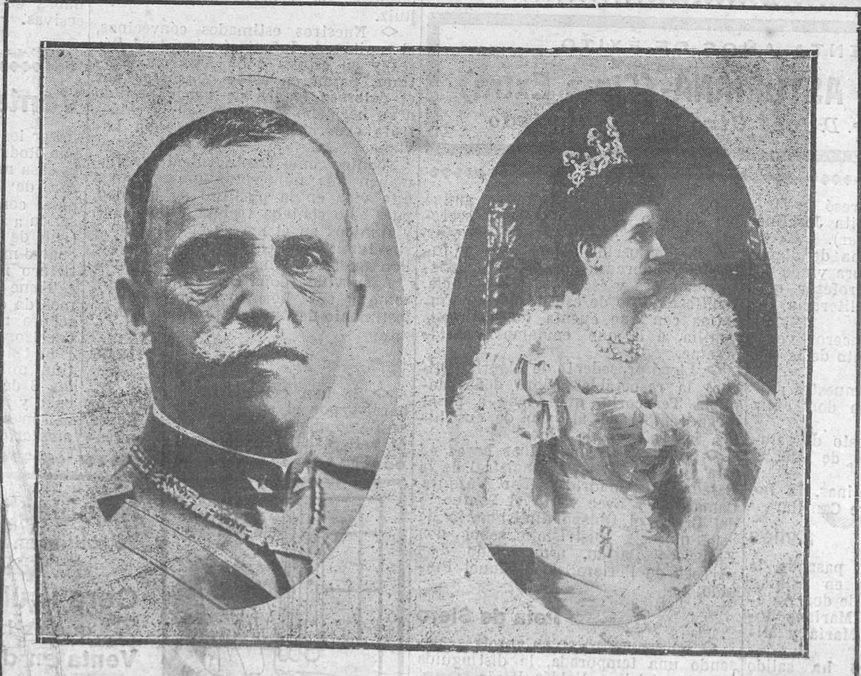
SS. MM. los Reyes de Italia. Victor Manuel y Elena de Montenegro, que llegarán hoy a España.

No te preocupe el que te envidien o te odien. Bástete saber que los malos envidian y odian.