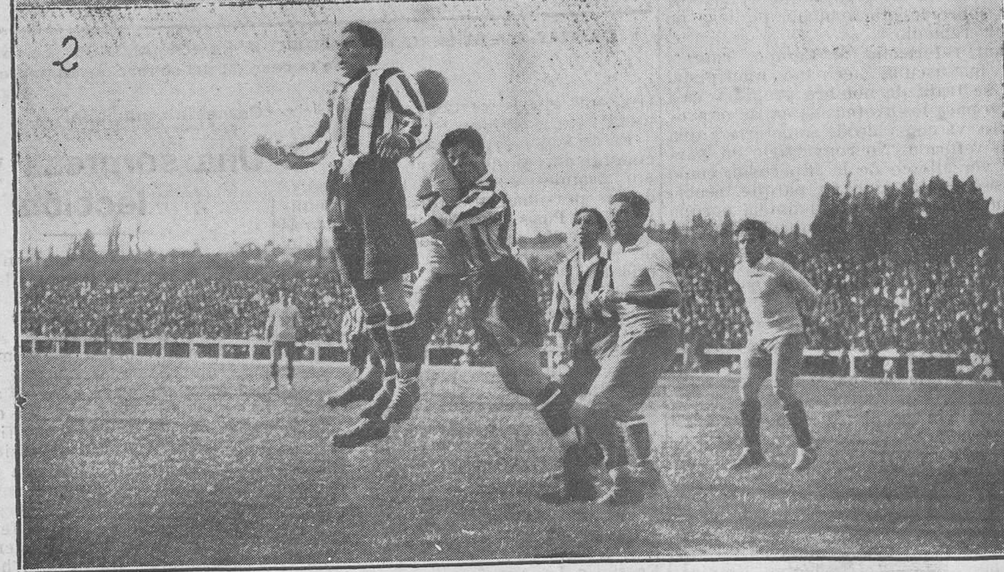
MADRID: DEL PARTIDO DE FUTBOL JUGADO ENTRE EL EQUIPO DEL URUGUAY Y LA SELECCIÓN DEL ATHLETIC.—(1) El equipo del Uruguay. (2) Un momento del partido.

sucitarlas, pero las gestiones fracasaron.