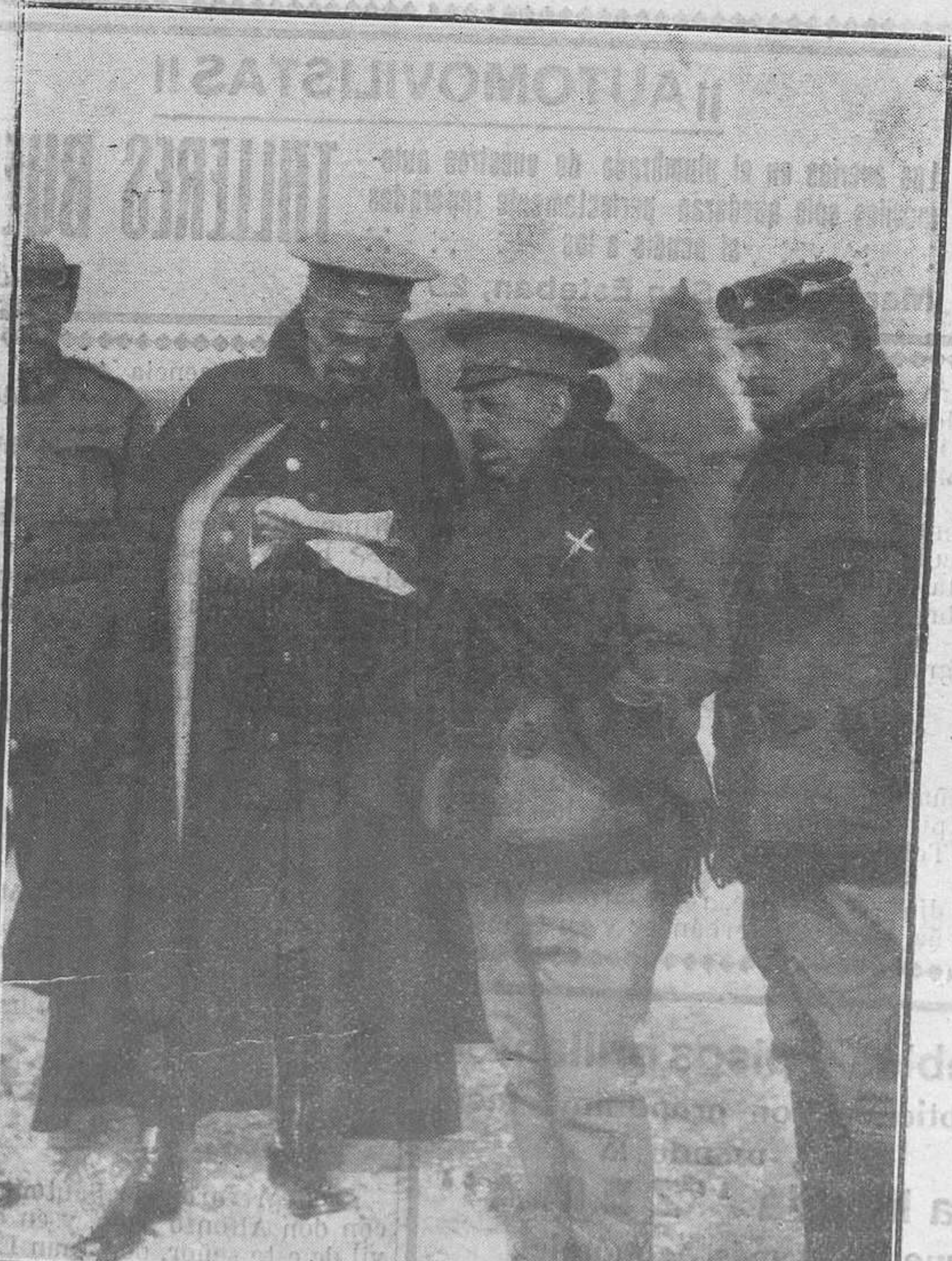
El general Sanjurjo (x), que ha sido nombrado comandante general de Melilla, en sustitución del general Marzo

Cuando te consideres aludido en algún "consejo", es prueba evidente que lo necesitas; no te engañes a ti mismo, y síguelo; lo contrario sería una necedad, con la que tú solo perderías.