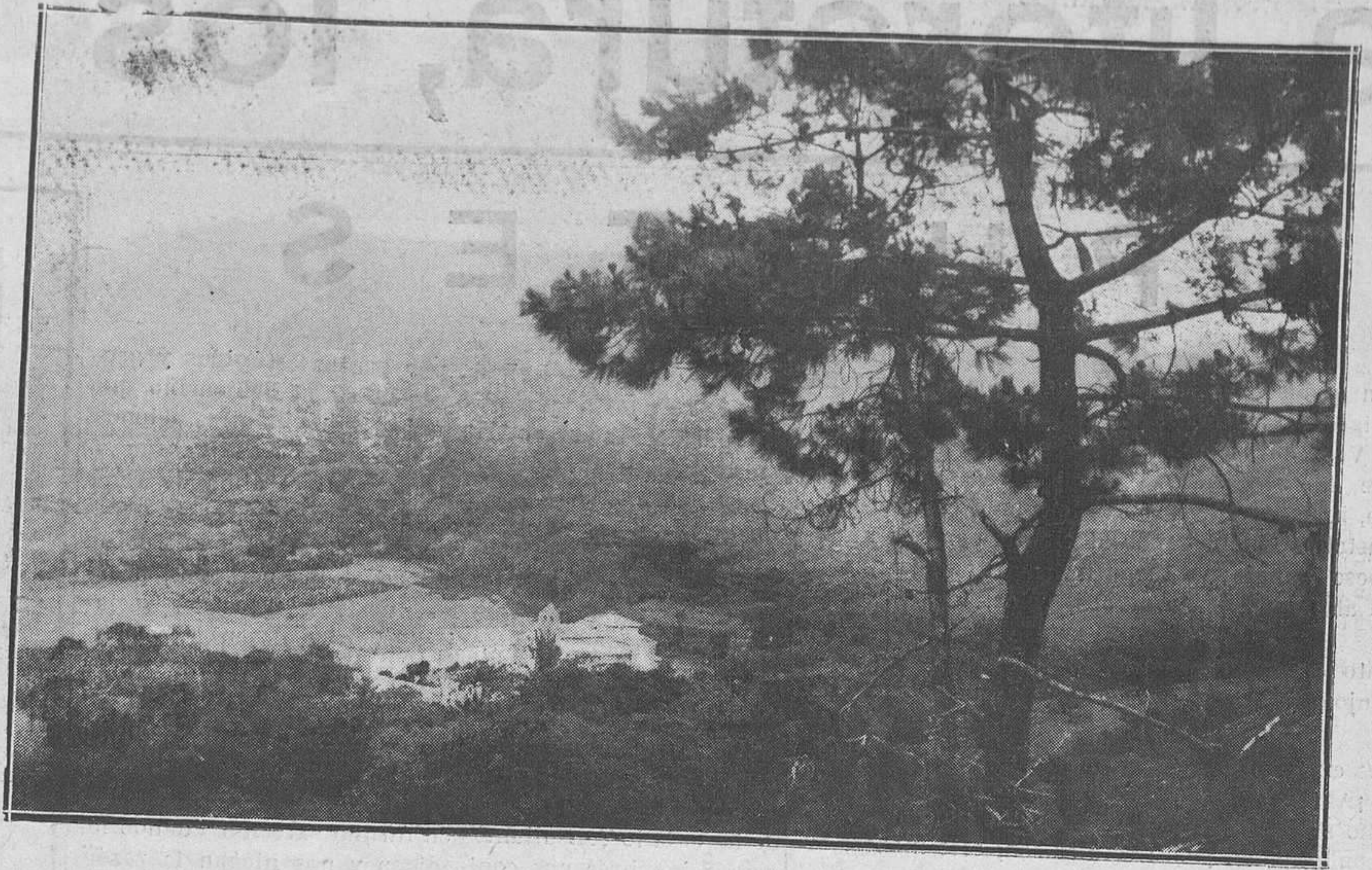
ASPECTOS ASTURIANOS.—Monasterio de San Antolín de Bedón (Llanes), visto desde la montaña.

Todos escuchamos en silencio y conmovidos. Oyendo a nuestro amigo el malagueño, sentimos dentro de nosotros algo común que nos une en hermandad de sangre. Una corriente mis-