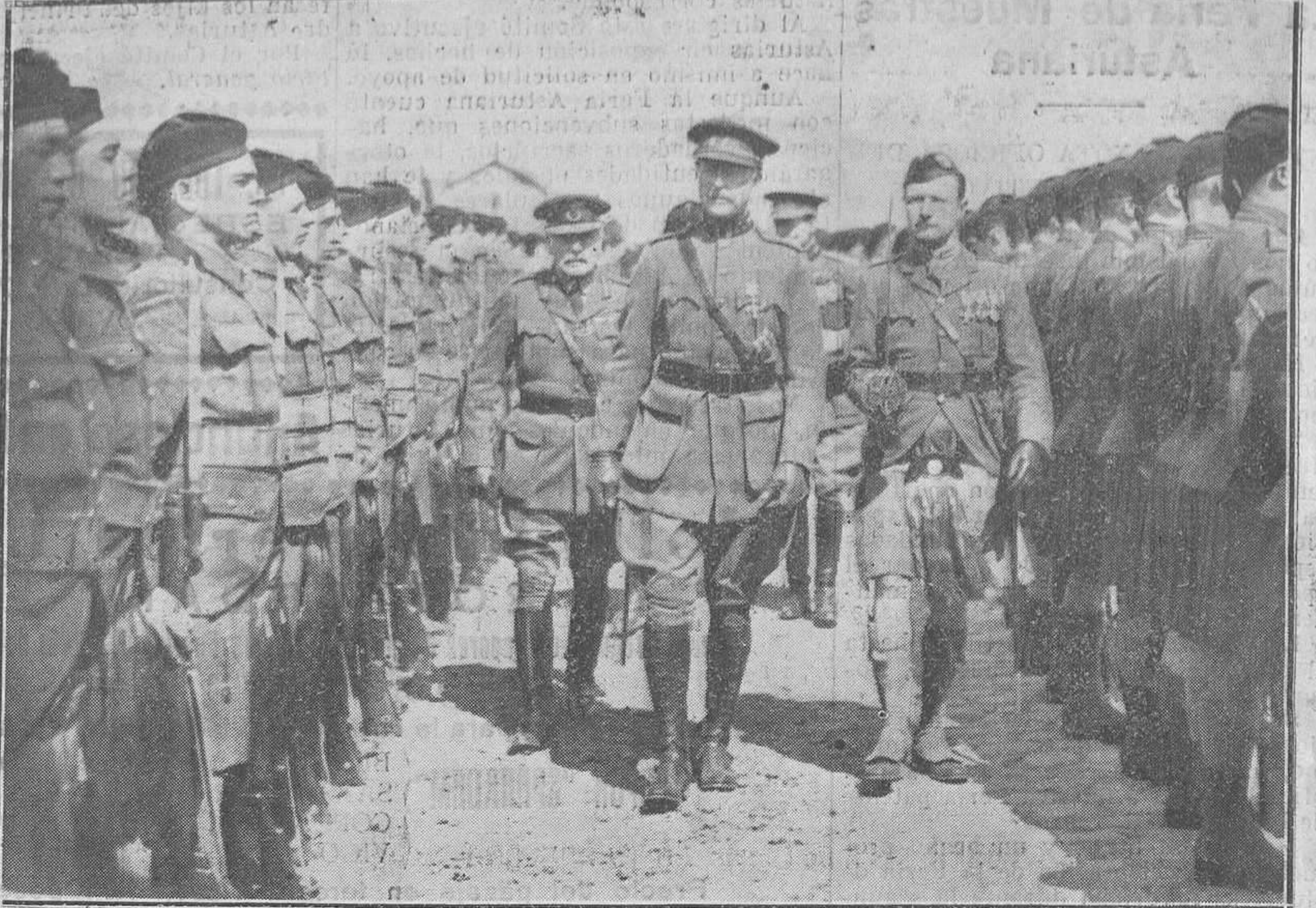
BRUSELAS: INAUGURACIÓN DEL MONUMENTO A LOS SOLDADOS INGLESES QUE MURIERON EN BÉLGICA DURANTE LA GRAN GUERRA.—Su Majestad el Rey de Bélgica pasa revista a los "London Scottish" que han asistido al acto.

Este reo oyó de rodillas las dos misas, y repetía frecuentemente: