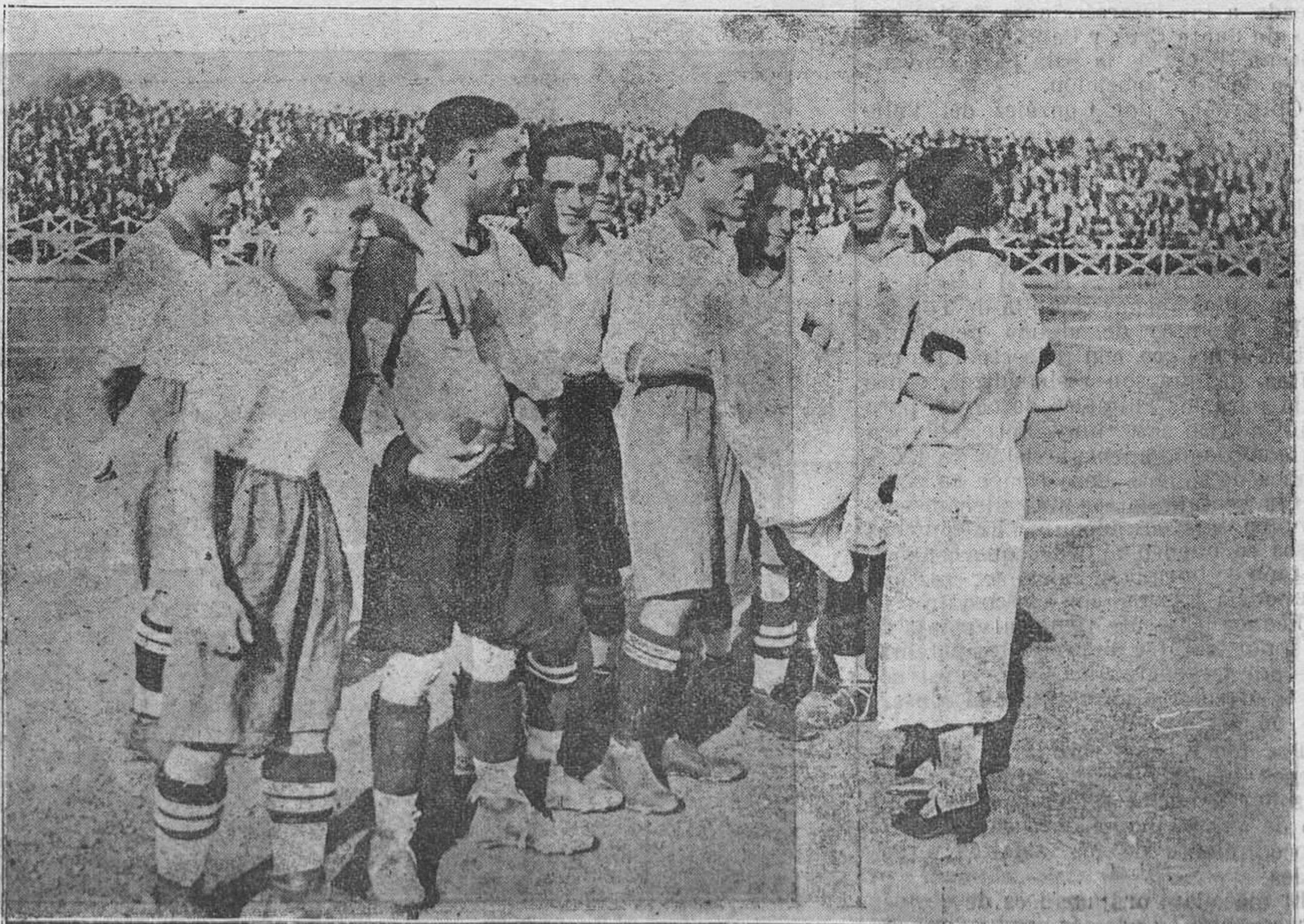
BARCELONA.—Las socias de C. D. Europa, entregando al equipo del mismo la nueva bandera.

De confianza, de Villaviciosa. Casa Pedro Alvarez, Dueñas, 12, Oviedo.