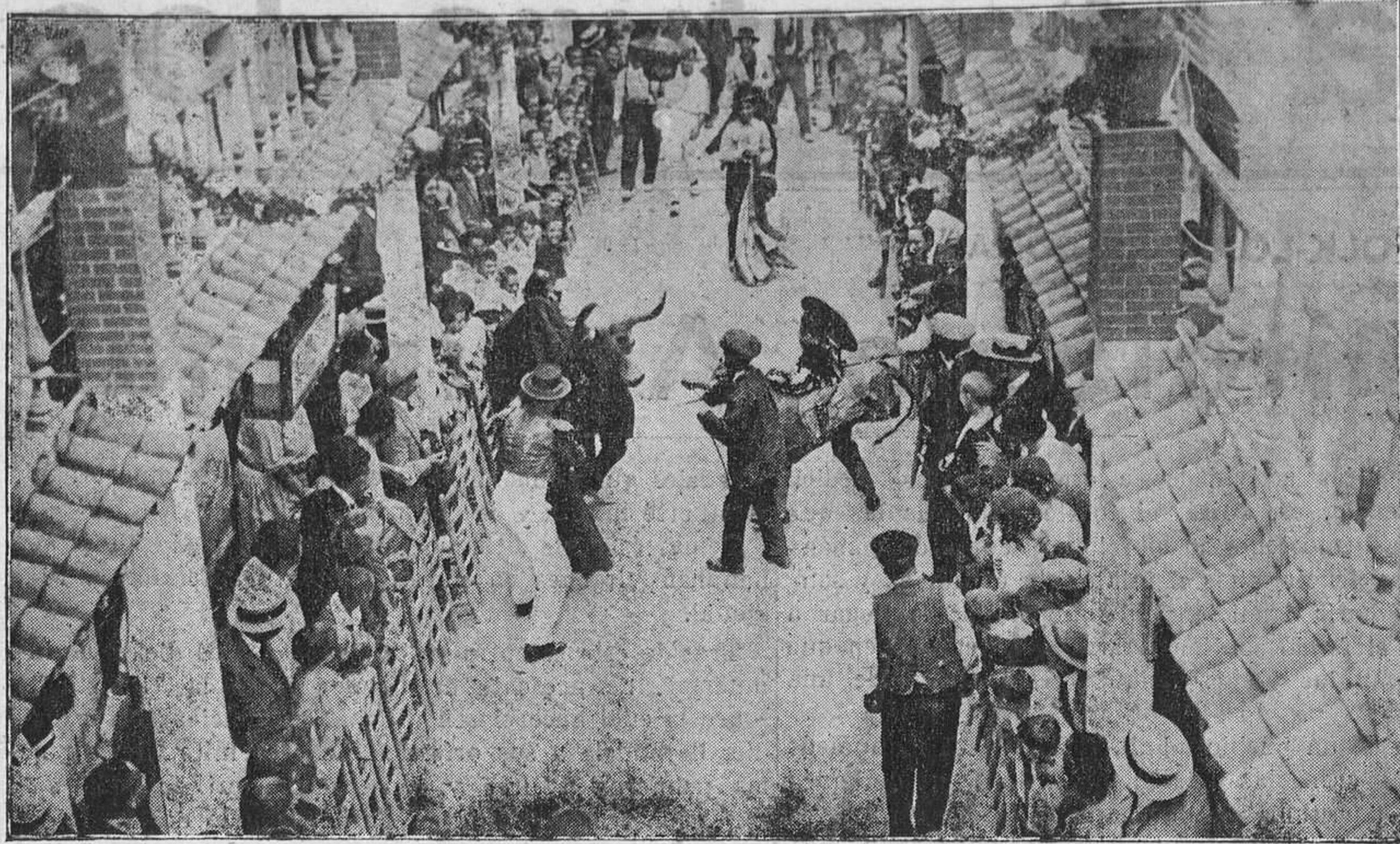
BARCELONA: FIESTAS DE LA BARRIADA DE GRACIA.--Una corrida de "toros", o el "humour" catalán.

El Sindicato dice que si de las averiguaciones que el puesto de la Guardia civil de Santa Cruz está llevando a la práctica resultara algún socio culpable, procederá inexorablemente en contra de él.