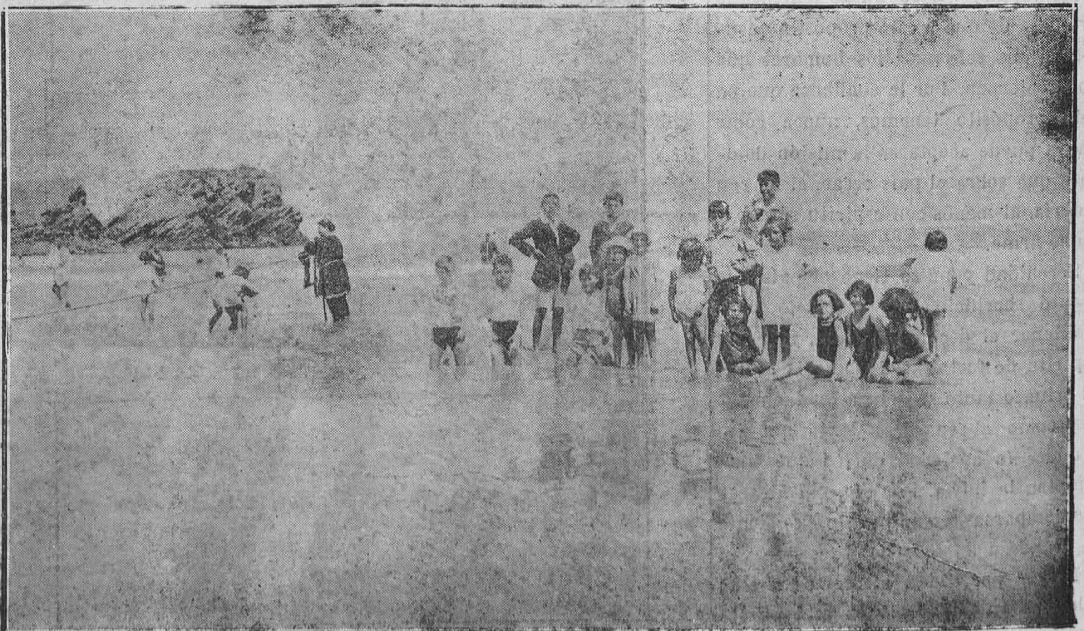
EL VERANEO EN ASTURIAS.--Grupo de nenes de los muchos que disfrutan de la bella playa de Salinas.