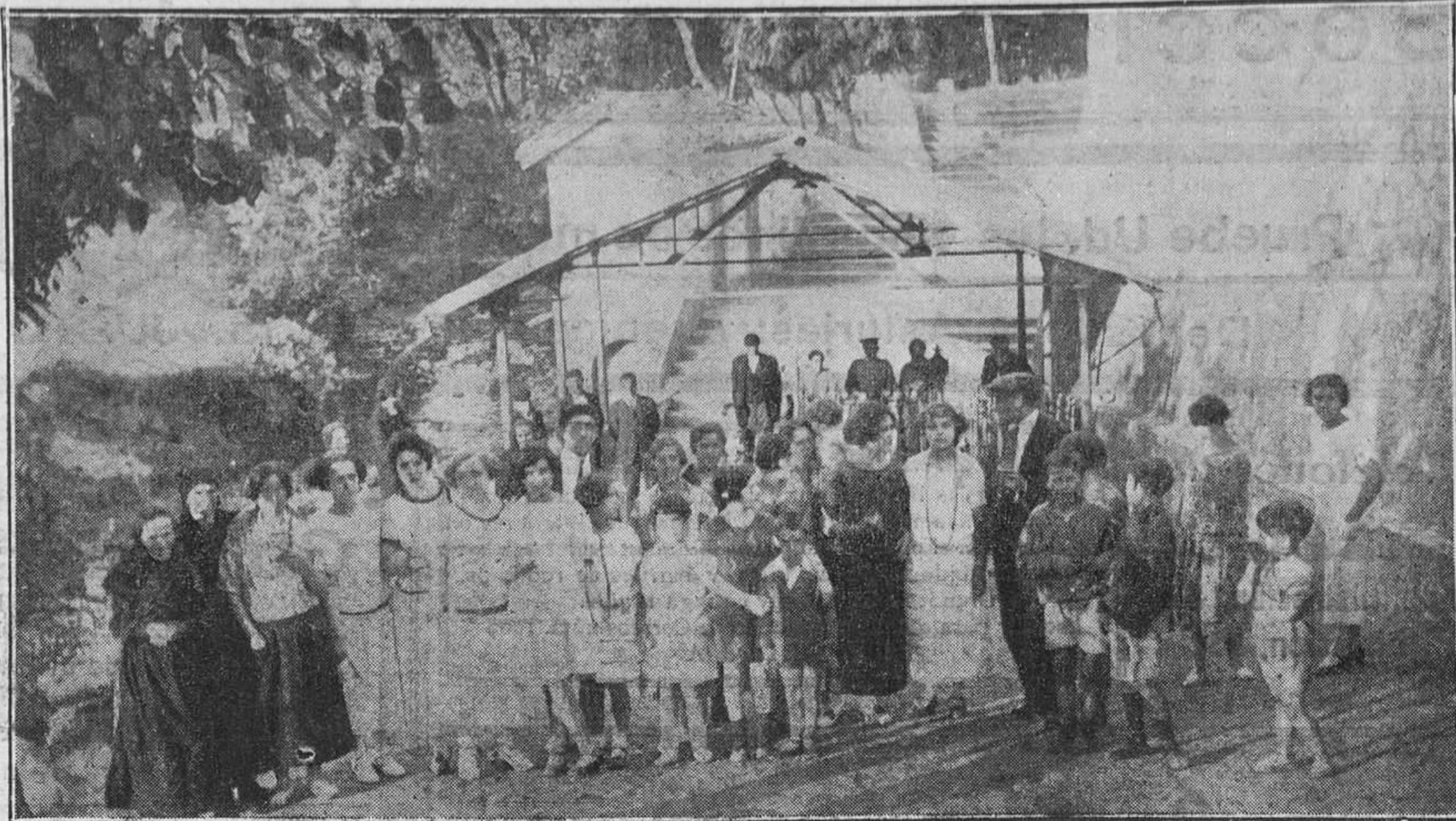
LADA.—Algunos bañistas que veranean en este balneario.