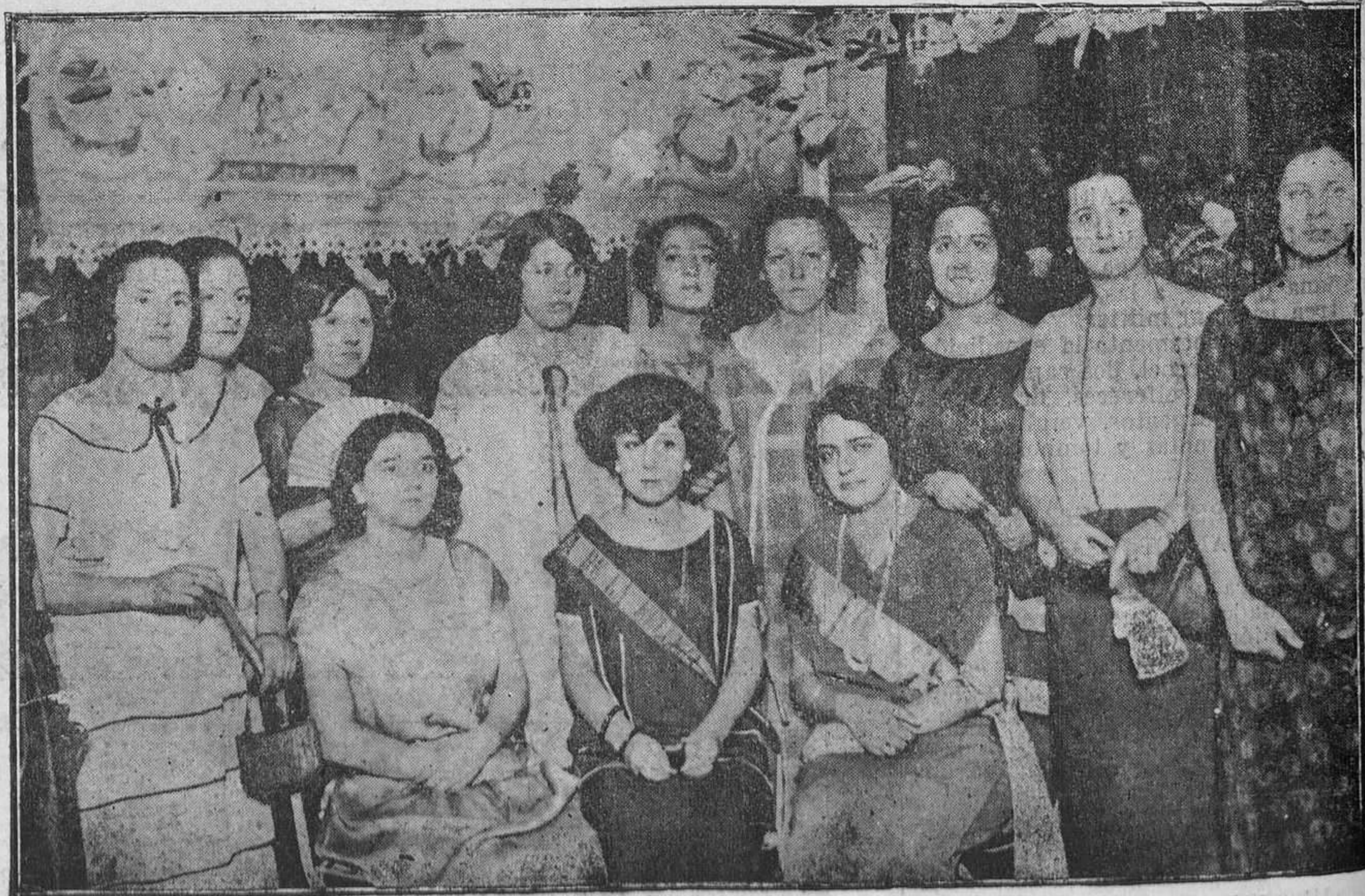
MADRID: CONCURSO DE BELLEZA EN LA KERMESSE DE LA VERBENA DE LA PALOMA.--La Reina de la Belleza y su Corte de Amor

Por lo tanto, y en bien principalmente de las personas mordidas, debe siempre que ello sea posible, cumplirse el artículo 165 de la Ley de epizootias, y cuando haya sido preciso matar al animal que mordió, se enviará cuanto antes, (porque, putrefacción avanzada dificulta o imposibilita el análisis) la cabeza a un laboratorio biológico, procurando, además, que se haga la autopsia completa por un veterinario, ya que algunas particularidades, como el encontrar cuerpitos extraños en el estómago del animal, la existencia en el mismo órgano de un líquido oscuro, parecido a la infusión de café, y la presencia en la mucosa gástrica y duodenal de equimosis, tienen tan gran valor, que, por sí solas bastarían para poder afirmar el diagnóstico de rabia, y en cualquier otro caso el profesor veterinario podrá encontrar datos que complementen el análisis micrográfico que practique el Laboratorio.