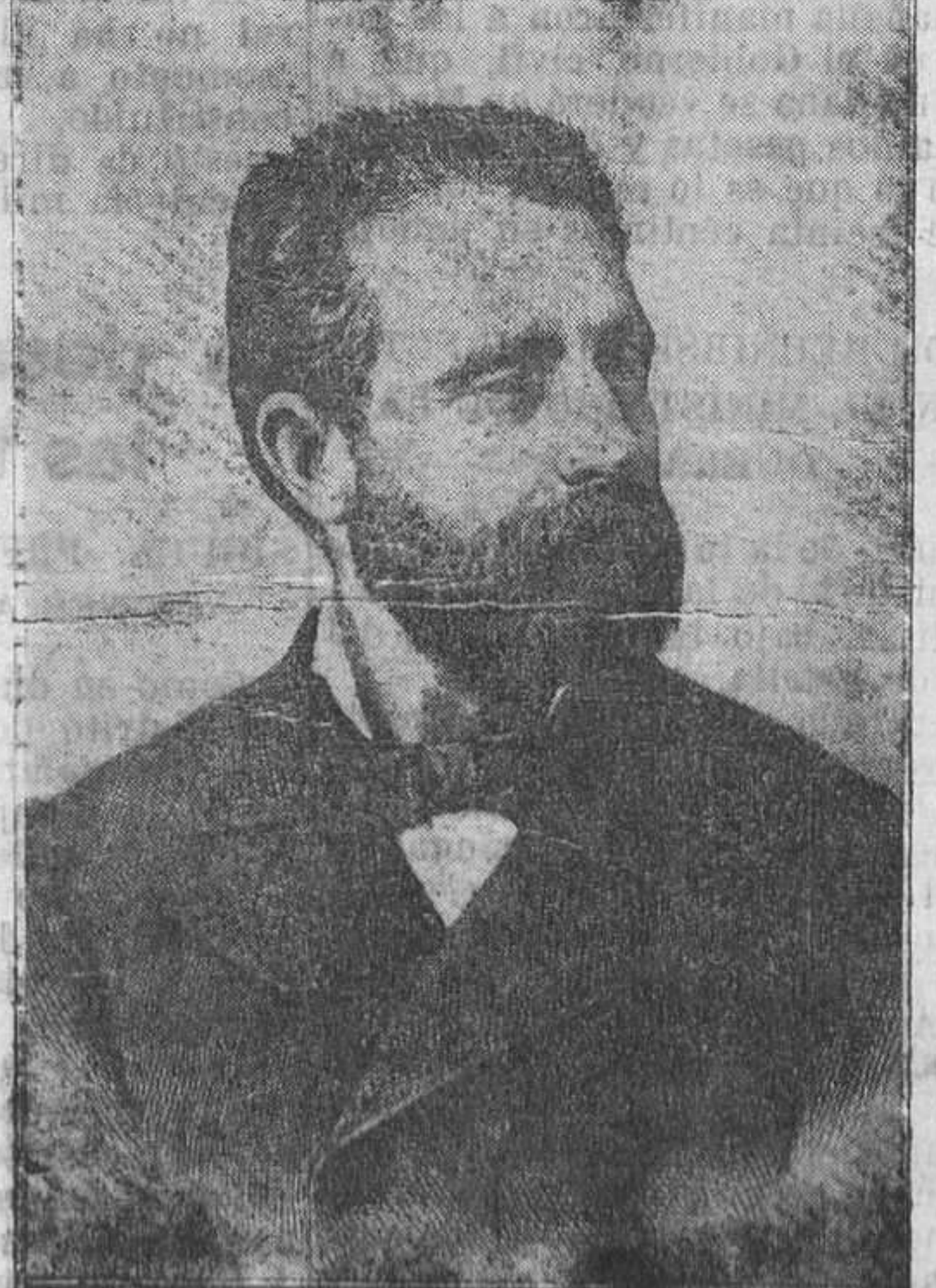
LITERATOS ESPAÑOLES DEL SIGLO XIX.—D. Gaspar Núñez de Arce.