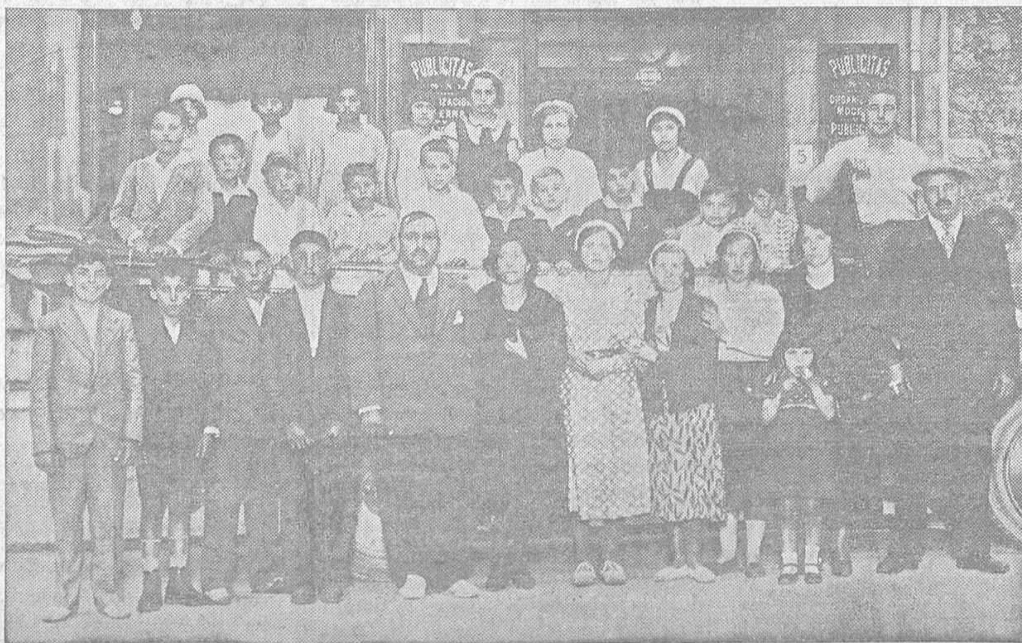
Los niños de las escuelas de Villanueva y Tuñón, en el concejo de Santo Adriano, que acompañados de sus profesores y algunos vecinos, visitaron nuestros talleres.