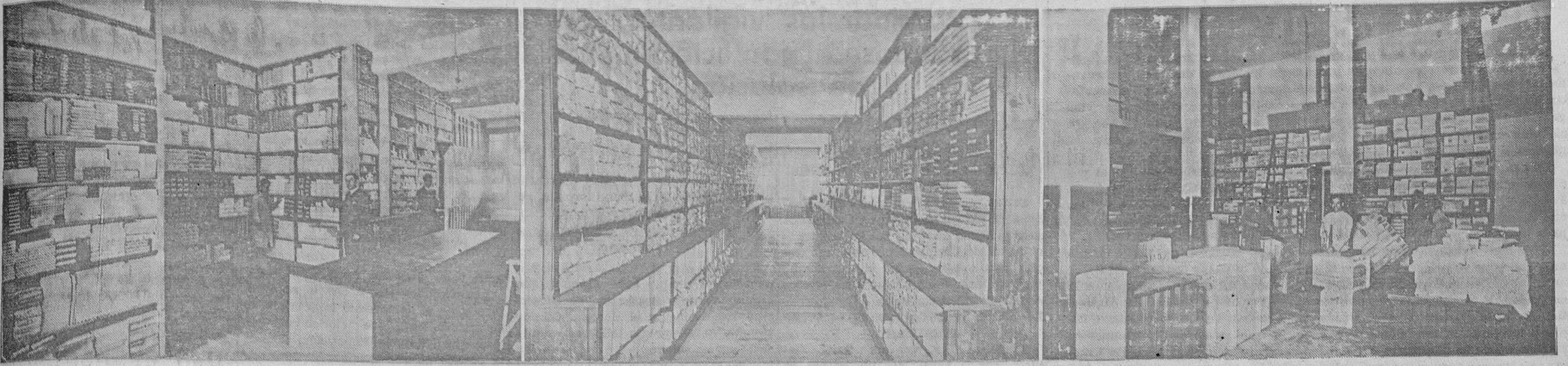
Sección de paquetería y despacho de mayor