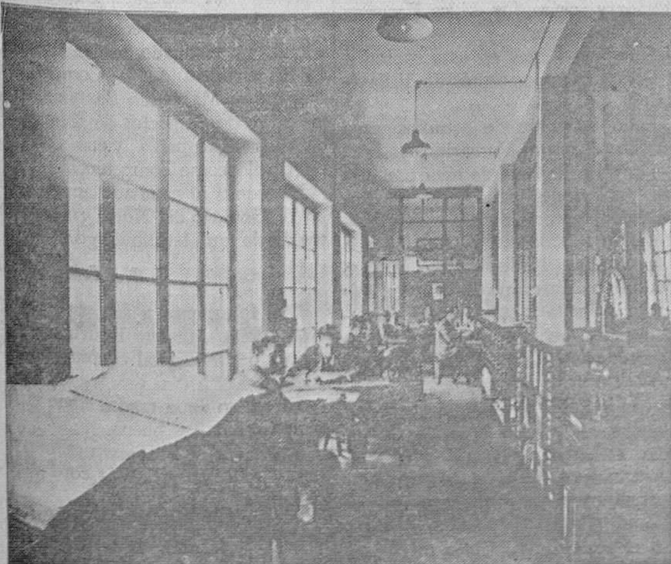
Un detalle de las oficinas, en el primer piso