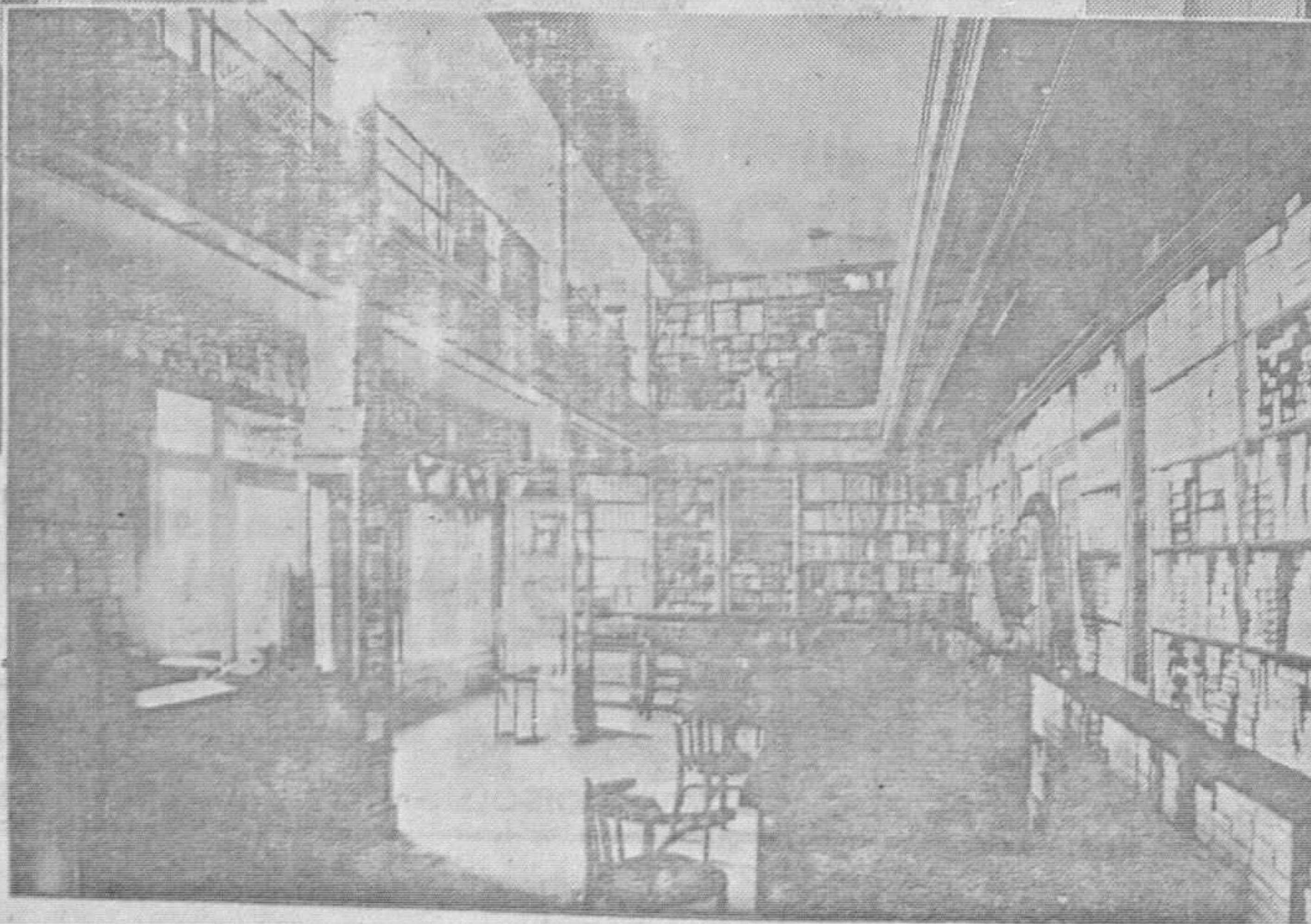
Primer piso: Toda esta estantería está abarrotada de medias de seda. En este departamento está el despacho para el público de mayor