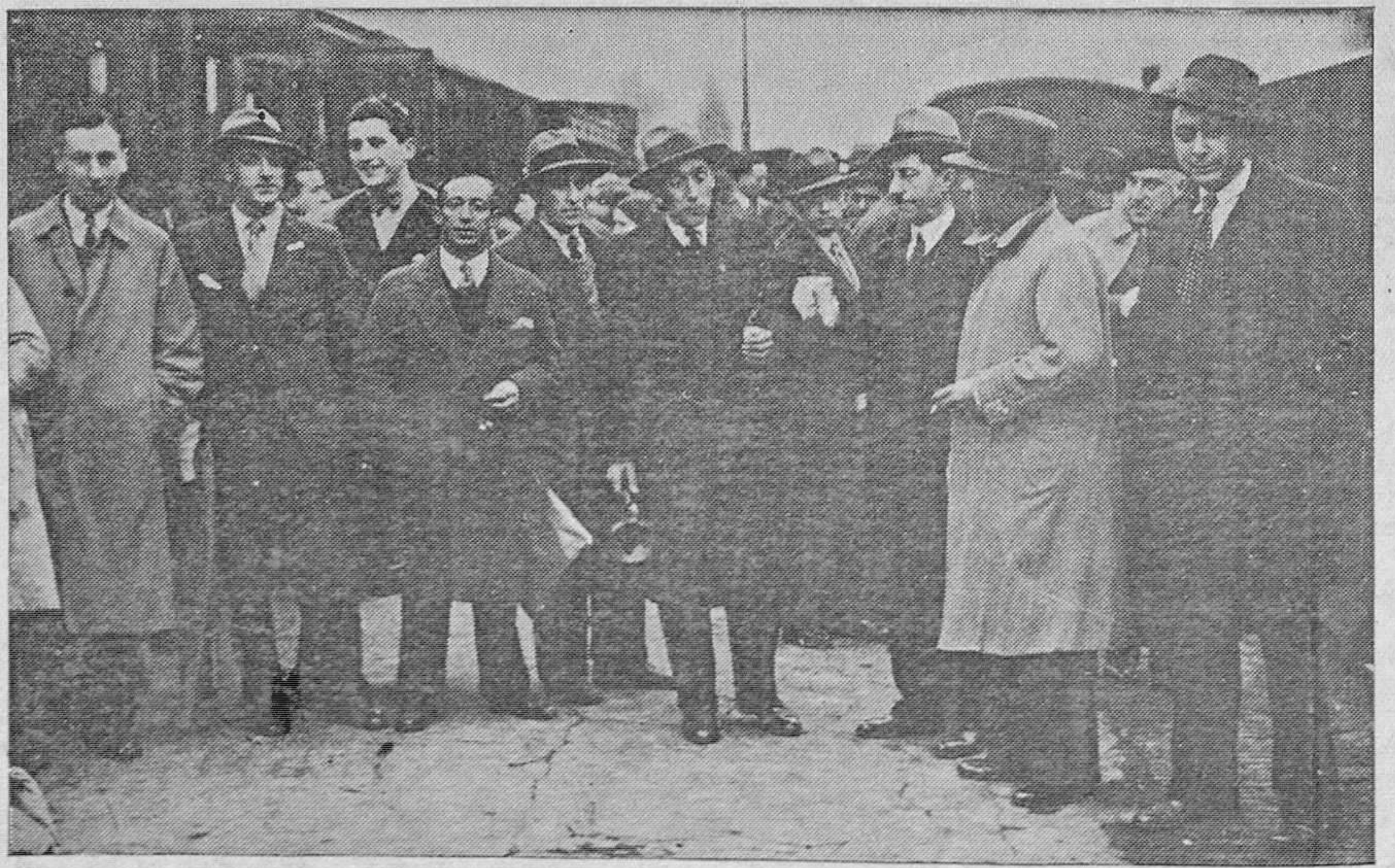
LA VISITA DE LOS MONTAÑESES.—Con motivo del partido de hoy en Buenavista, se desfilan de Santander unos mil quinientos aficionados y ayer llegaron ya los cronistas deportivos, directivos de la Federación los organizadores del viaje, cuya llegada recoge la presente fotografía

Finalmente rechazamos las palabras dichas por el Sr. González Peña en el terreno particular, para devolvérselas genéricamente, seguros de que le cuadran bastante mejor que a nosotros. Y reiteramos que la medida del traslado de los enfermos, cuyos nombres poseemos y no damos para no herir a sus familias, es una de las mayores torpezas de esta Diputación, ya próxima a librarse, por fortuna, de la influencia de los socialistas y presidida por el ex-diputado provincial de la Dictadura, don Ramón González Peña.