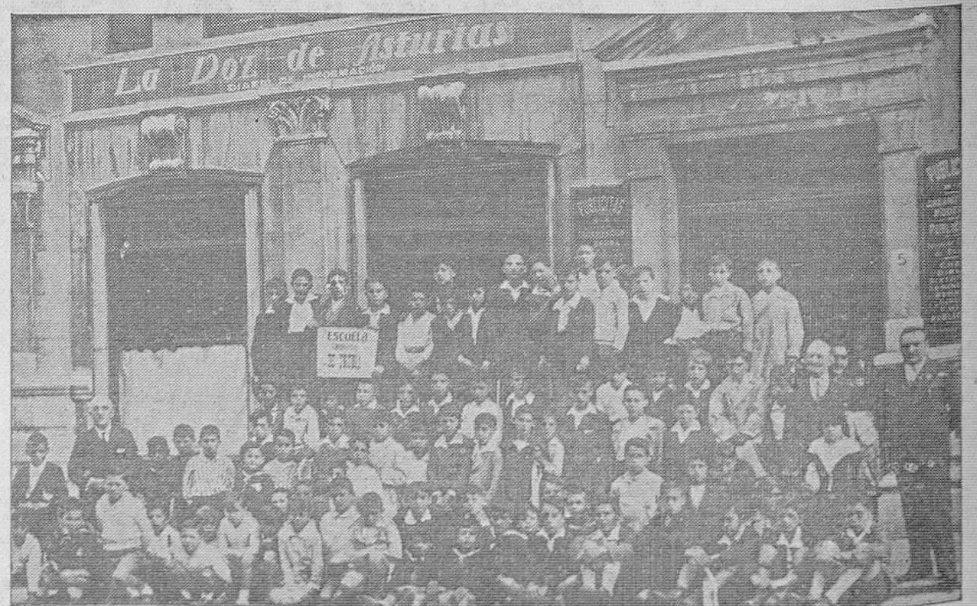
EXCURSIONES ESCOLARES.—Numeroso grupo de alumnos que visitaron nuestros talleres. Se trata de los niños de las graduadas de Trubia que con sus cultos profesores al frente posan para «La Voz de Asturias»