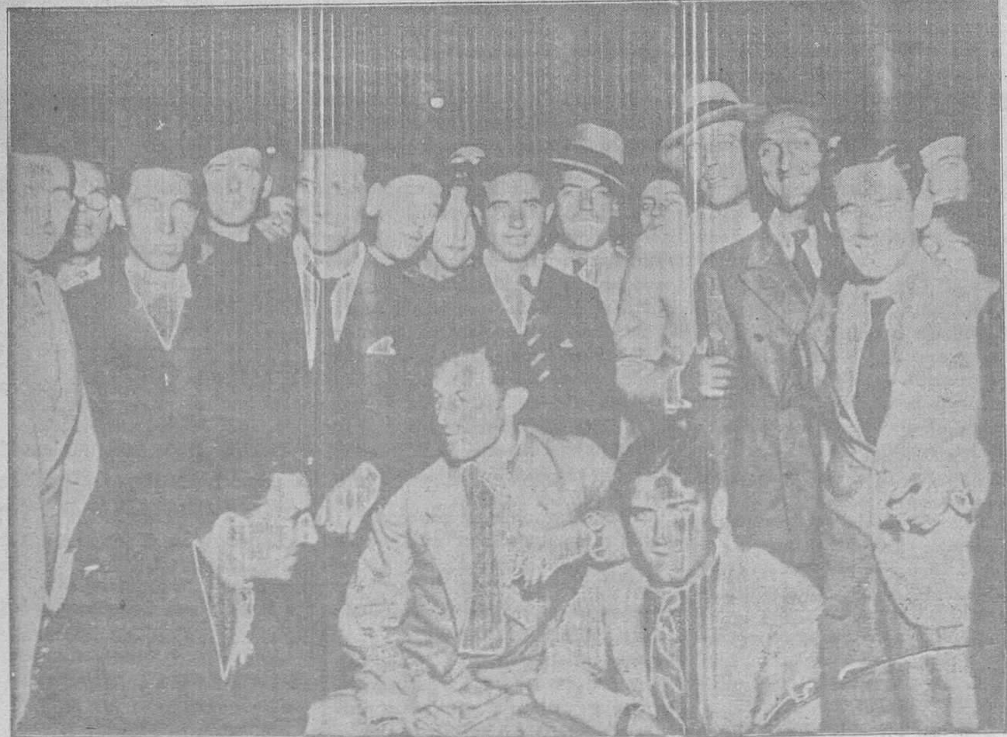
EN LA ESTACION DEL NORTE.—El equipo del Madrid que hoy jugará en Buenavista, a su llegada a la capital en el rápido de ayer