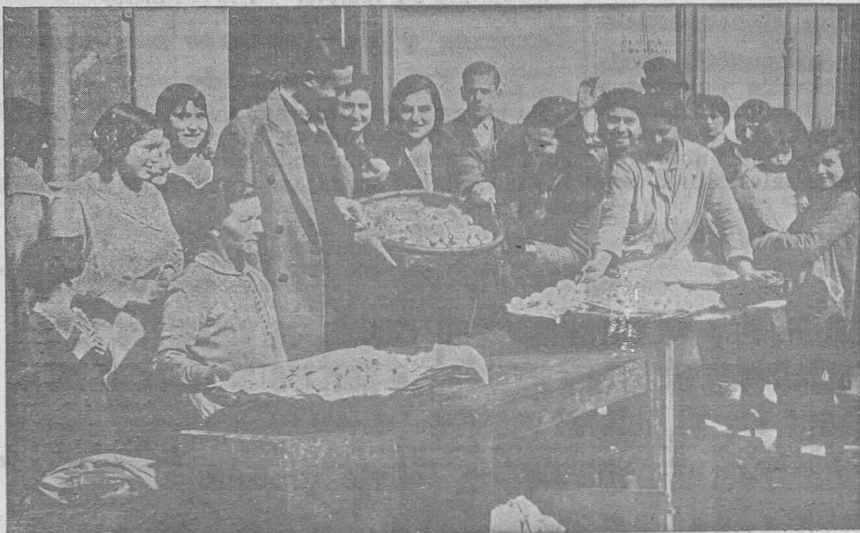
EL MARTES DE LOS HUEVOS EN LA POLA.—Es la fiesta tradicional, a la que presta su concurso Oviedo, como se lo prestó este año al acudir gran número de ovetenses, y que ayer se celebró en la villa hermosa con todas sus características de animación y brillantez.

Después del mítin, en el que el ilustre pensador estudiará la situación política, se celebrará un banquete en honor a los distinguidos oradores, para los que se despachan tarjetas en los Cafés Peñalba y Niza, Peluquería Calzón y Ferretería de la calle de San Francisco.