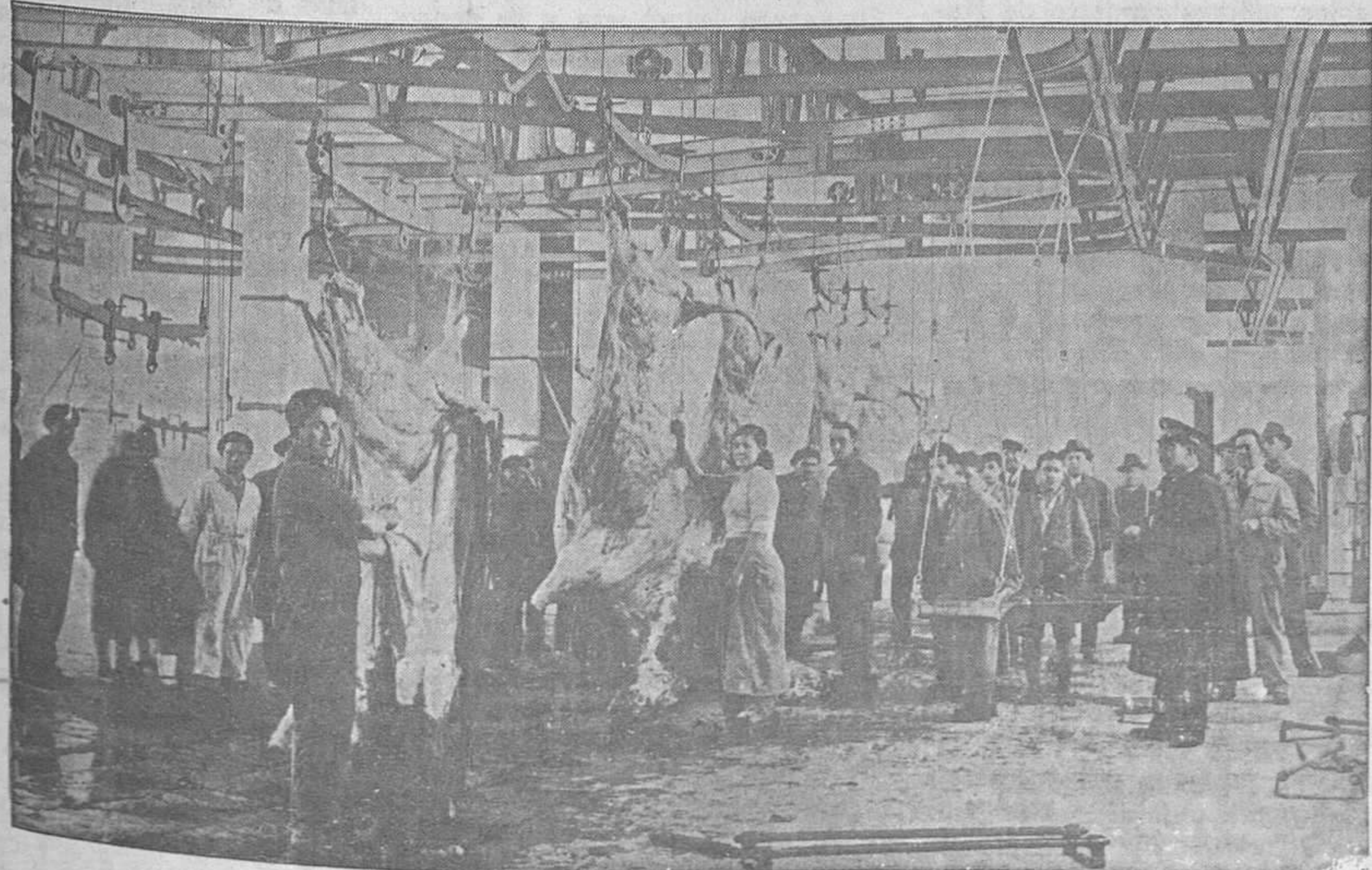
EN EL NUEVO MATADERO.—Ayer se verificaron en las amplias naves de este Matadero municipal ovetense, las operaciones de degüello de reses con el resultado más satisfactorio

El señor IRANZO formula algunas observaciones y llama la aten-