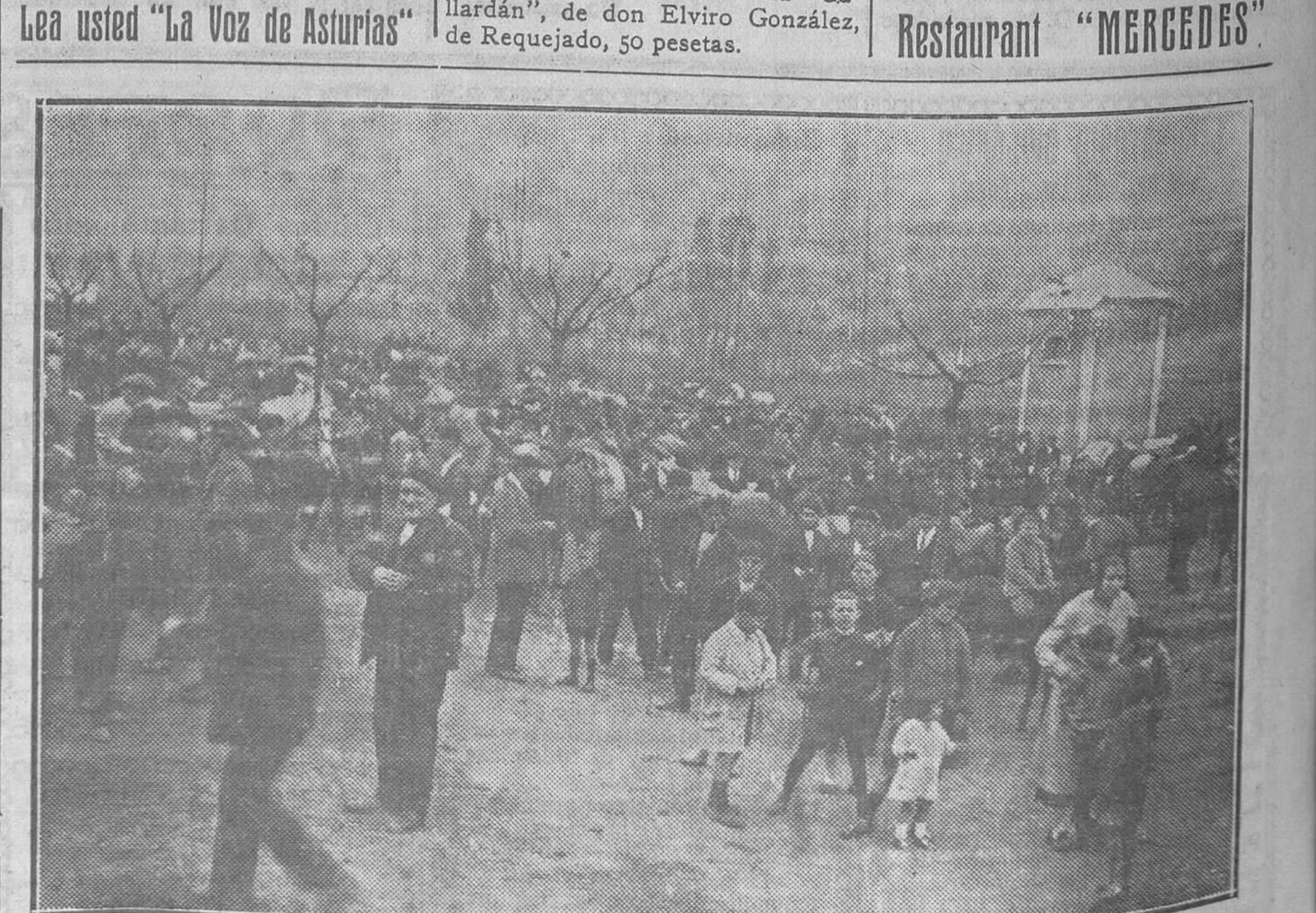
UN ASPECTO DE LA FERIA DURANTE LA MAÑANA

VISITAD EN GIJON EL RESTAURANT "MERCEDES"