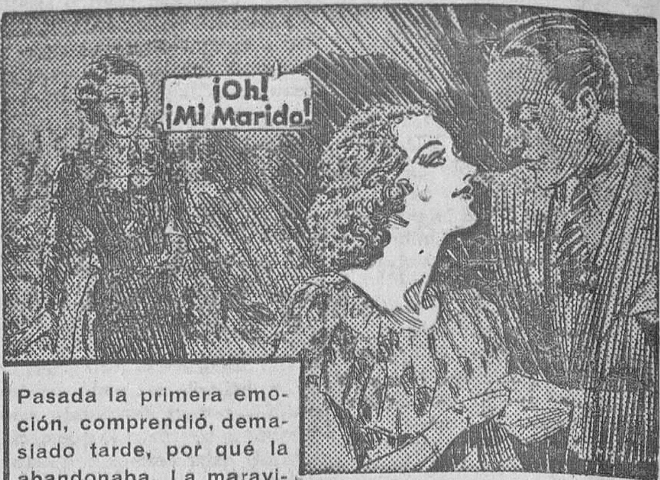
Pasada la primera emoción, comprendió, demasiado tarde, por qué la abandonaba. La maravillosa tez, el blanquísimo cutis de una rival, fueron la única causa de eso.