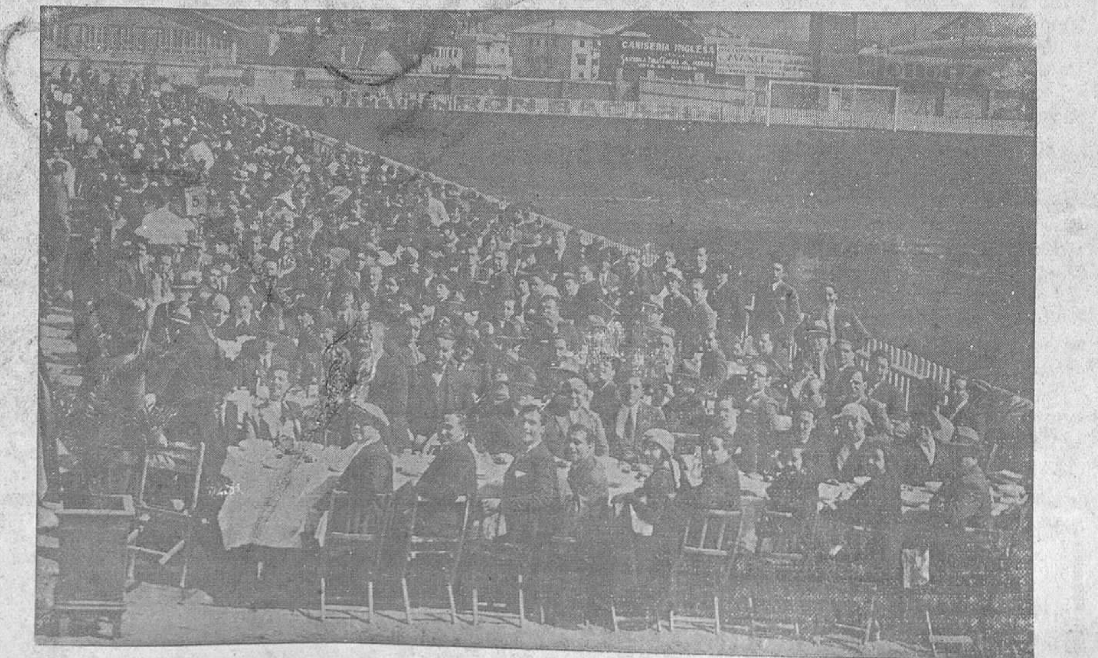
EL DOMINGO, EN EL STADIUM.—Sobre el maravilloso fondo del nuevo campo de deporte, escenario de los triunfos del Oviedo, los «hinchas» se congregaron el domingo en un acto de combatividad y de entusiasmo.