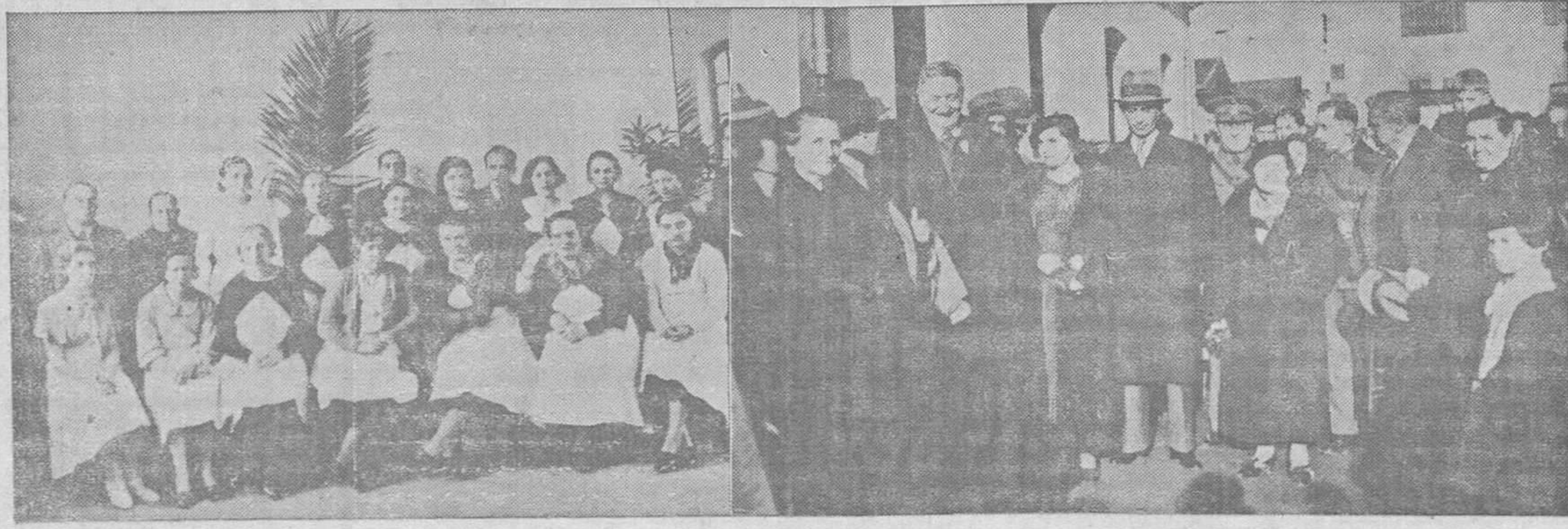
EL ACTO DE AYER EN TRUBIA.—Grupo de señoras y señoritas que sirvieron la comida a los niños de Trubia, con motivo de la inauguración de los Comedores de la Cantina Escolar.—A la derecha, el gobernador general y el alcalde de Oviedo, acompañados de sus respectivas esposas y de algunas personalidades que asistieron al simpático acto.

ES EL PERIODICO DE MAYOR TIRADA Y CIRCULACION DE LA PROVINCIA.