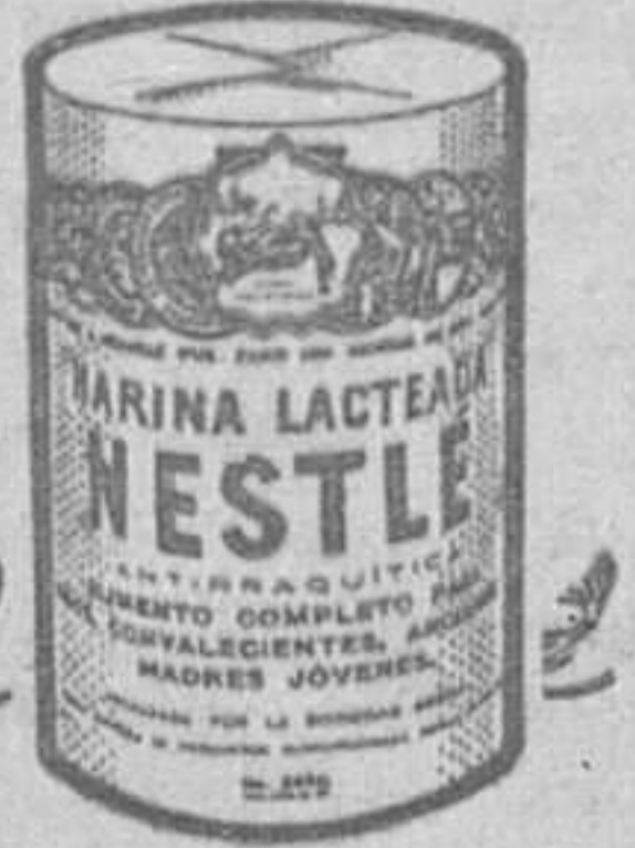
Ahora se ha puesto a la venta un nuevo tamaño de botes de Horino Lacteado Nestlé, llamado "bote degustación". Pida uno gratis a Sociedad Nestlé, Via Layetana, 41, Barcelona, (Sección HE "e").

No crece... Es que su régimen alimenticio es pobre en vitaminas indispensables al desarrollo de la infancia y necesita urgentemente tomar Horino Lacteado Nestlé alimento integralmente completo, rico en vitaminas, altamente nutritivo y fácil de digerir.