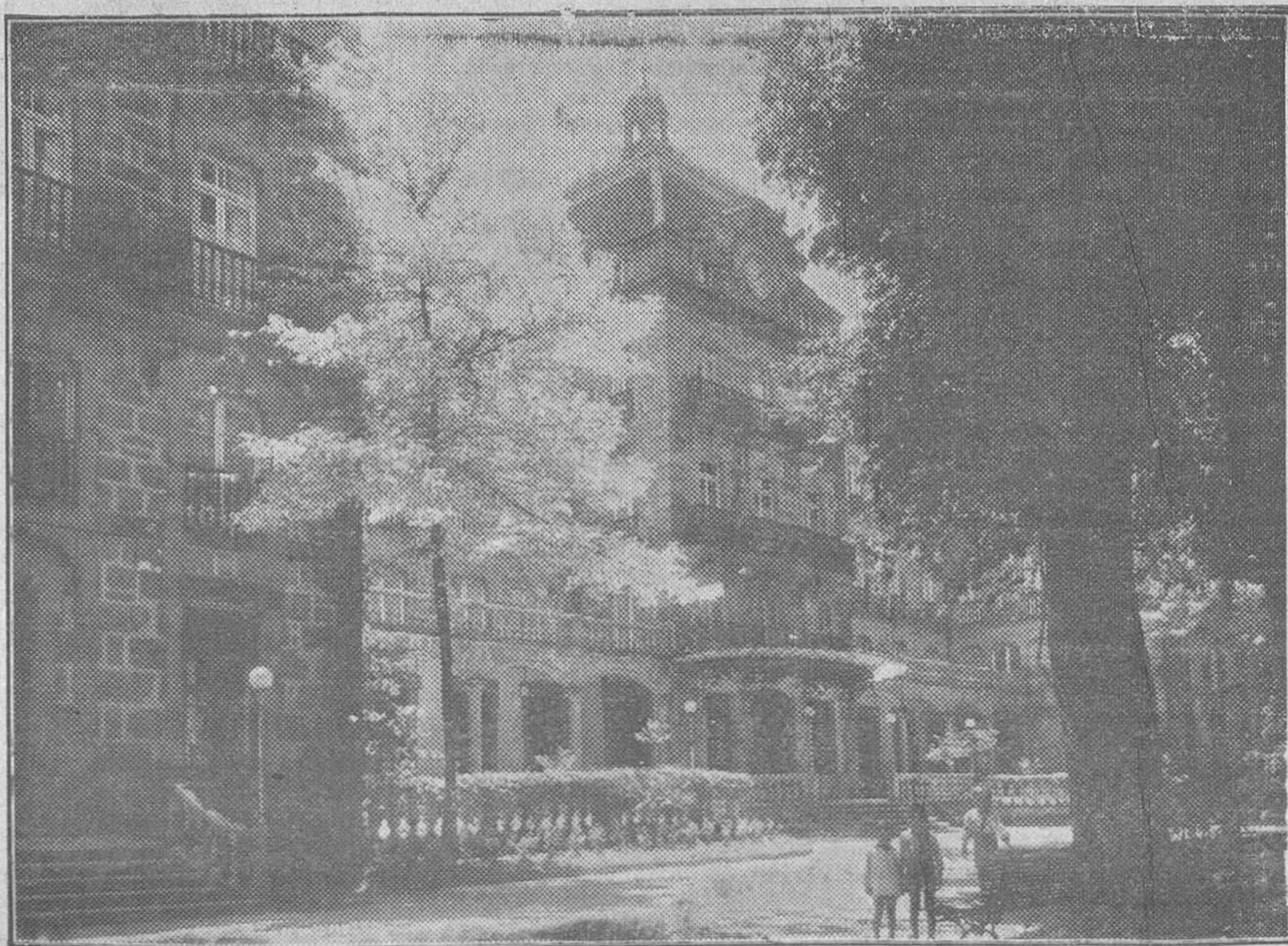
He aquí el remanso ideal para el turista ávido de gozar los encantos de la jornada estival en Galicia tan bella, ensalzadora y única como pródigo manantial de salud.