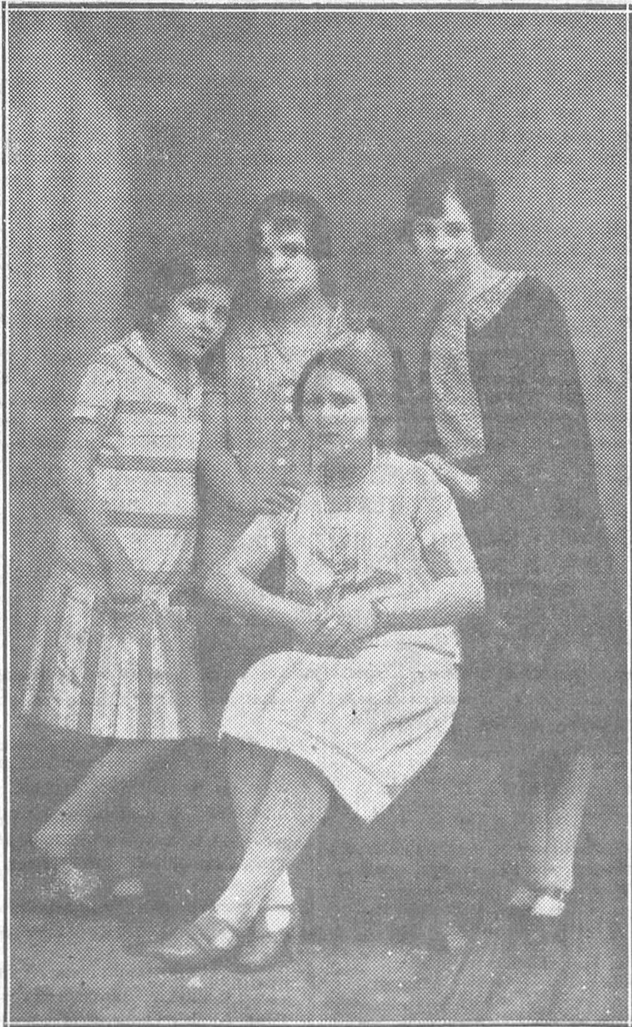
Grupo de bellas señoritas, que componen la comisión organizadora de las fiestas de San Juan de Nieva