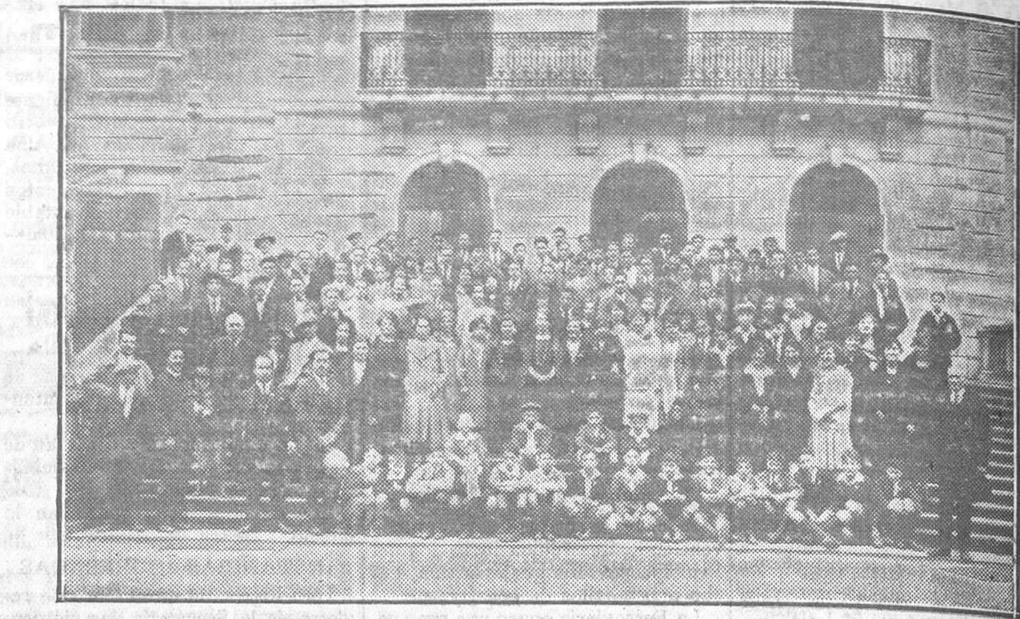
El 2 del actual hicieron un grupo de profesores y alumnos de la Sección Comercial de la Academia Ojanguren su excursión anual, correspondiendo este año visitar la Concha de Artedo. Esta fotografía fué tomada por el señor Collada durante un descanso en la hermosa posesión de los señores Selgas en el Pito (Cudillero)

muerzo de 160 cubiertos, con decir que fué servido por el Hotel Brillante, queda hecho su mejor elogio.