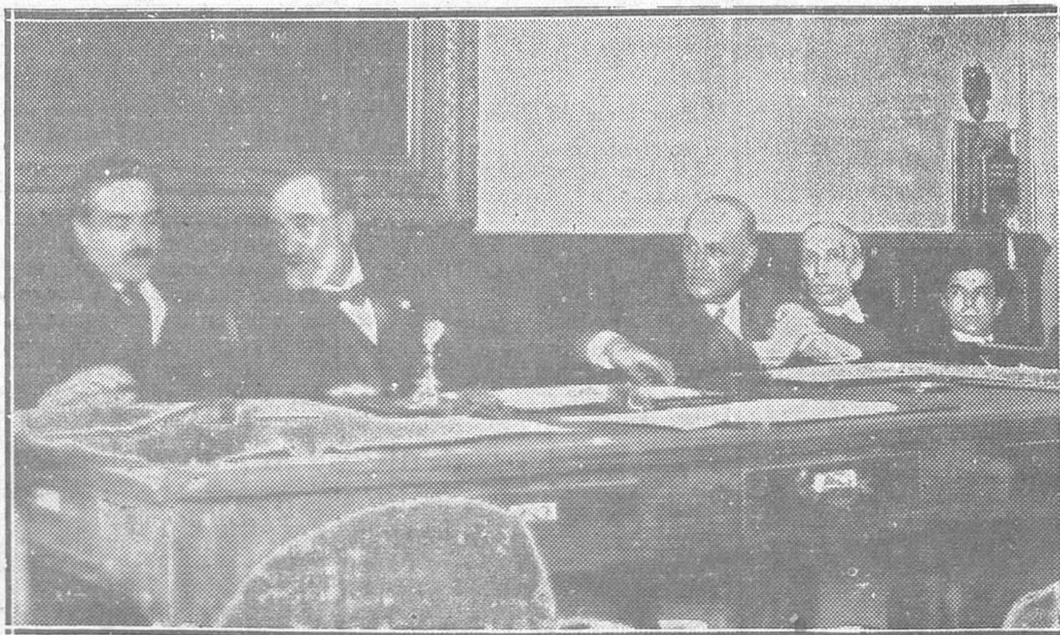
La presidencia de la magna Asamblea hullera celebrada ayer