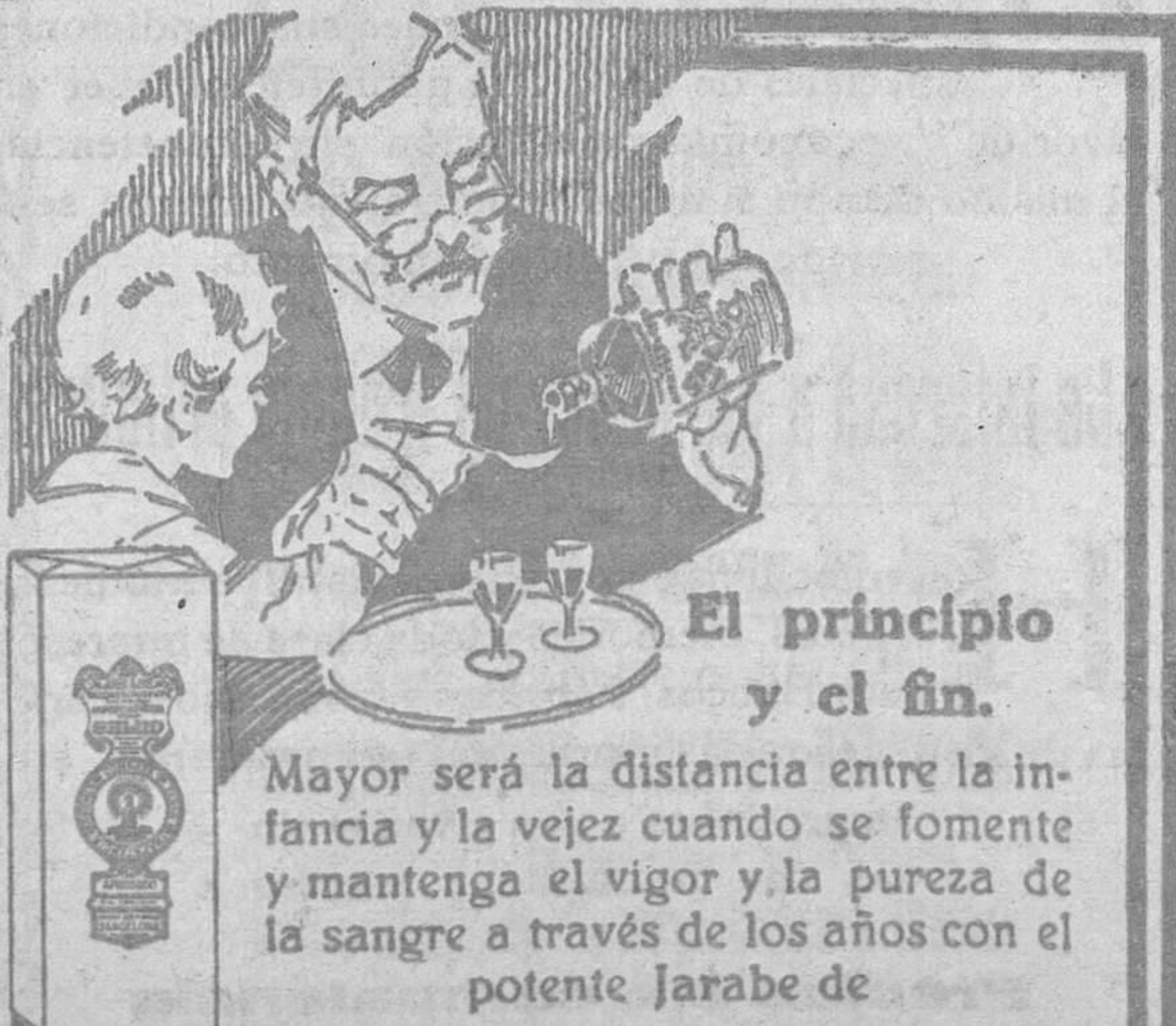
El principio y el fin.

Los jóvenes que forman la "Rondalla murense" amenizaban el espectáculo tocando escogidas piezas musicales, que eran escuchadas con deleite y aplaudidas con calor.