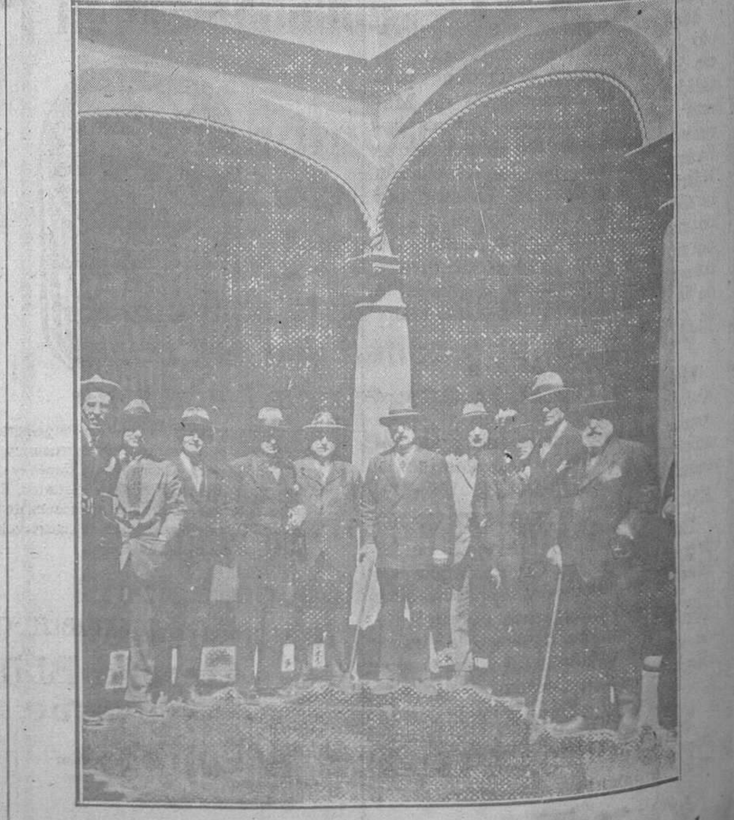
SEVILLA.—Las representaciones de nuestra provincia en el patio de la casa de Asturias.

En lo que se refiere a las notas de despacho nada existía para información.