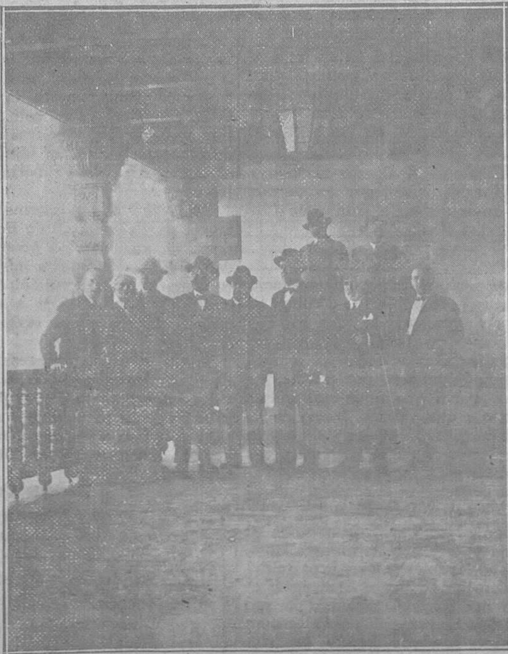
SEVILLA.—Alguno de los visitantes de la Casa de Asturias en el corredor.