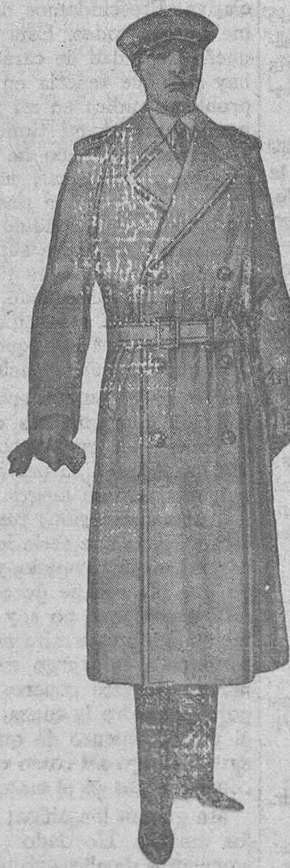
TRINCHERA inglesa, tres telas, botón cuero, distintos colores y modelos, desde