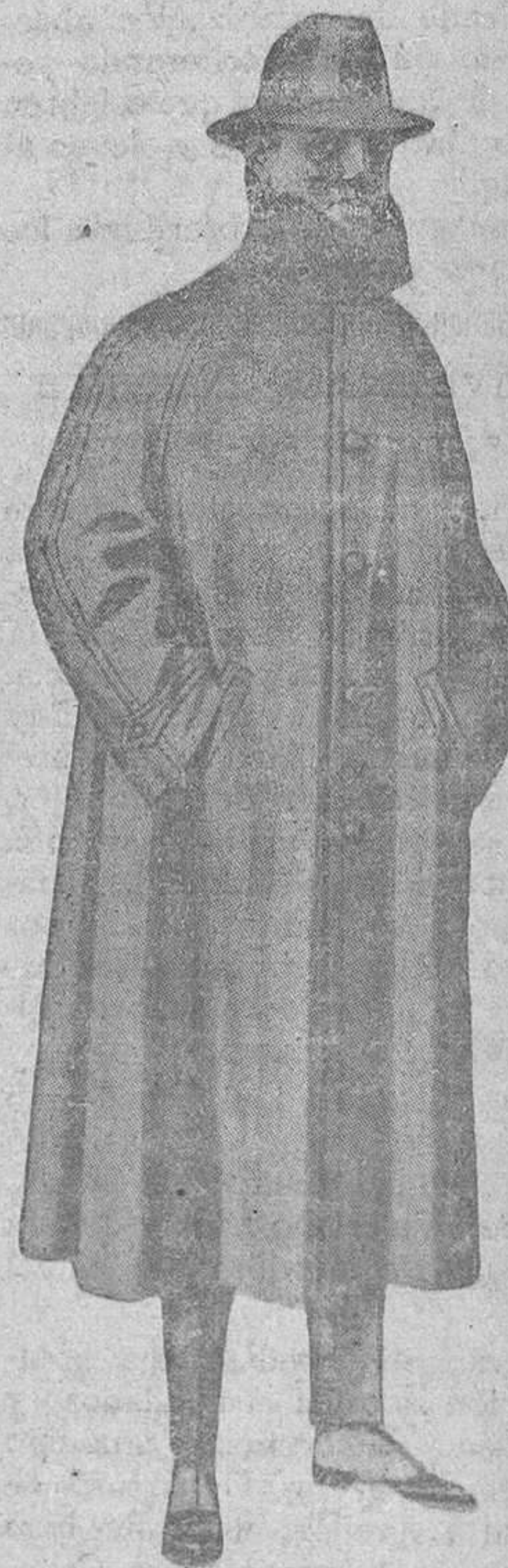
IMPERMEABLE hule negro o color, distintos modelos, muy práctico.