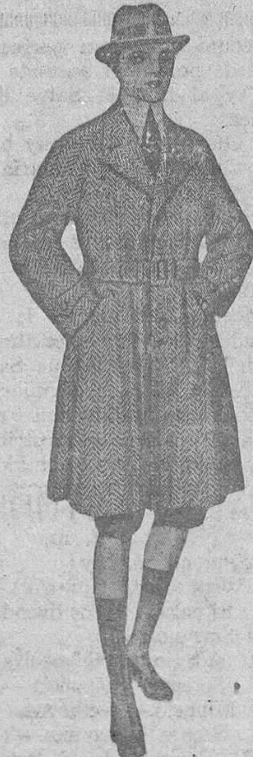
GABANCITO niño, recto, con o sin cinturón, muy sport, en cheviot de lana; para 12 o 14 años.