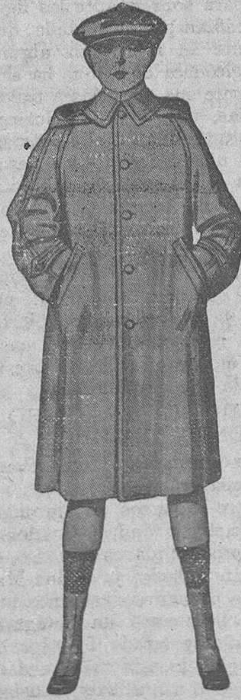
IMPERMEABLE niño, modelo cerrado o abierto, con o sin cinturón y capucha. En hule de primera, negro, gris y café; para 12 o 14 años.