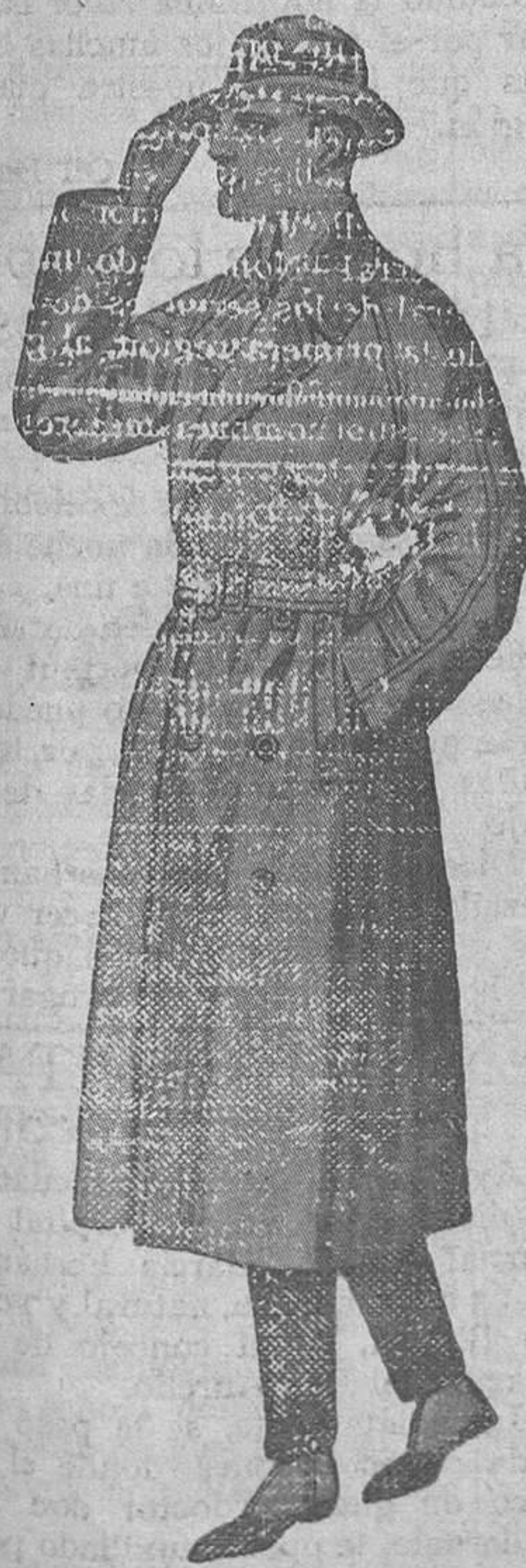
GABARDINA. Impermeable modelo cruzado. Lo más nuevo en puro estambre torzal.

LA CASA QUE MAS SURTIDO PRESENTA EN TODA LA PROVINCIA