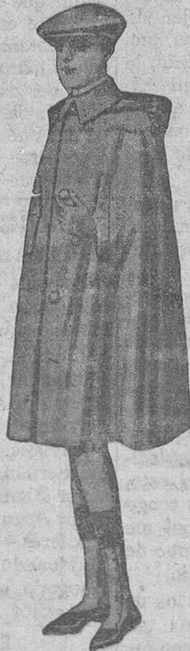
CAPITA impermeable, en negro, gris o café, calidad mejorable; tamaño 150 centímetros.