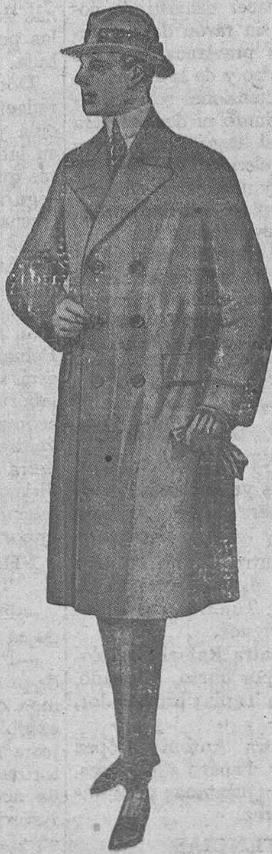
GABÁN cruzado, modelo recto gamuza o ratina superior, colores oscuros lisos.