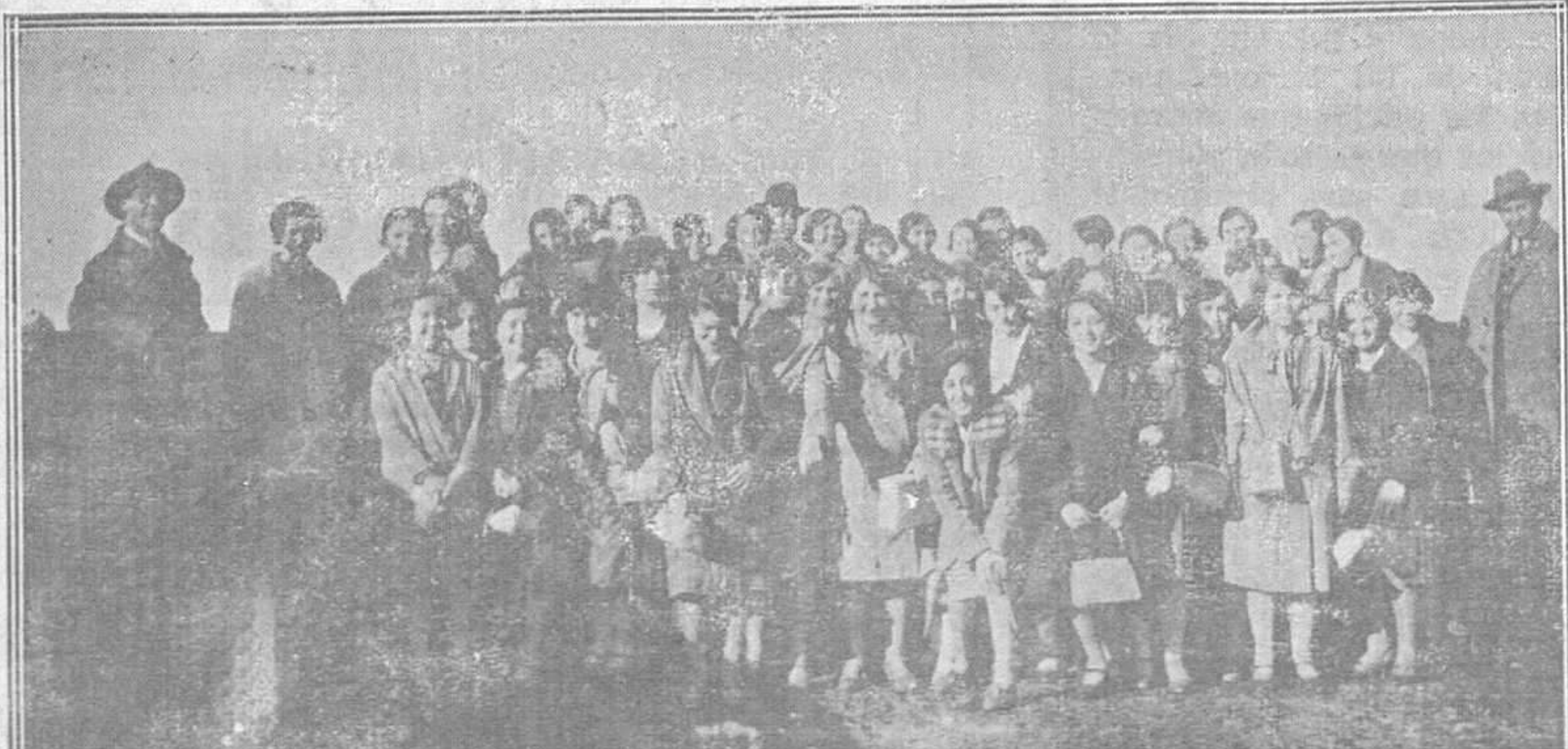
Un grupo de futuras opositoras a Escuelas, que se preparan en la Academia Ojanguren, durante su reciente excursión a San Esteban de Pravia.

La Sociedad, según parece, va regularizando el trabajo, sin la intervención de los citados maestros.