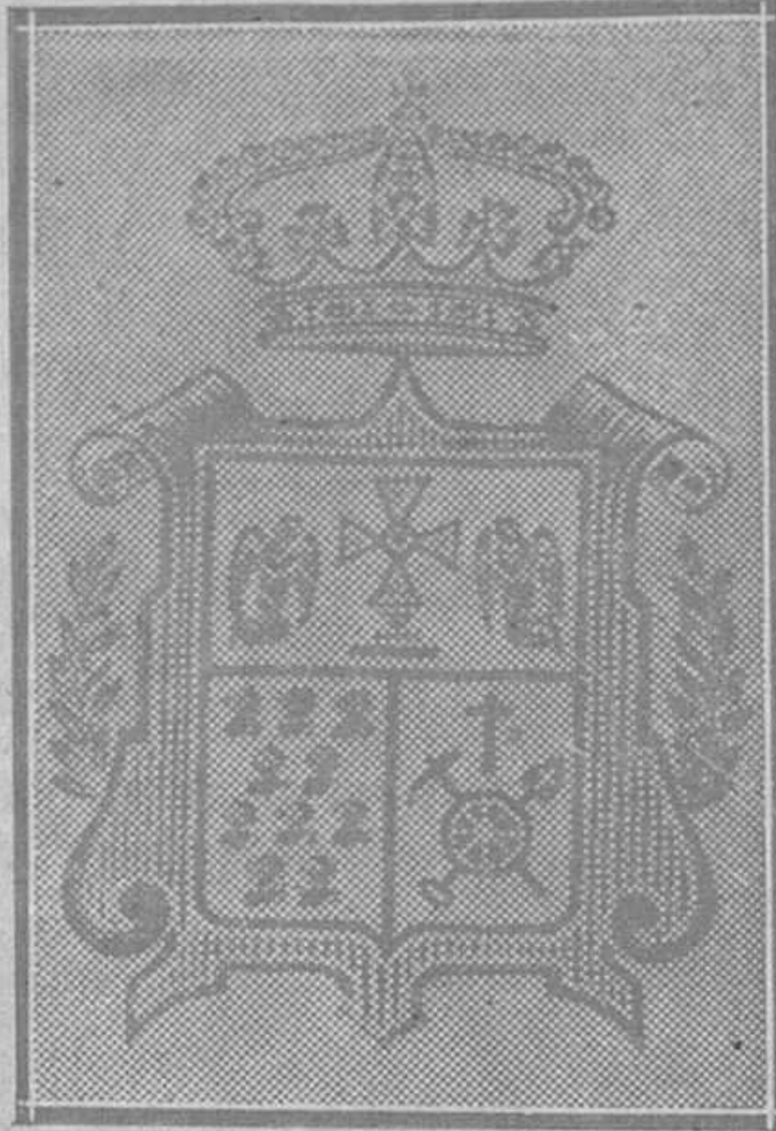
ESCUDO DE LANGREO

Habla de los cuatro años que pasó en la Siberia, en donde cogió la enfermedad que le acompañó toda la vida y le llevó al sepulcro.