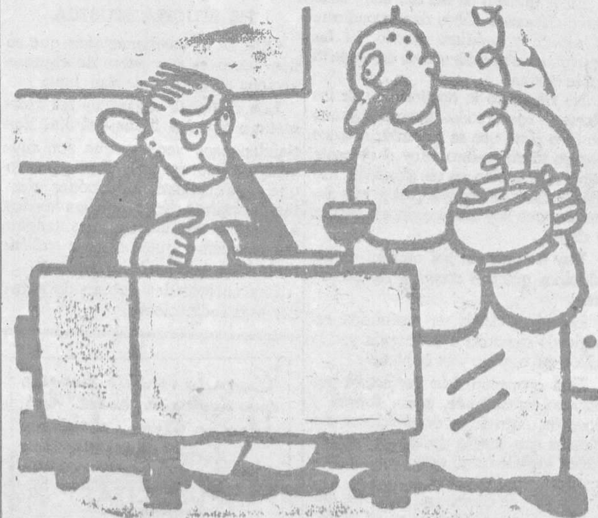
—¡Pero hombre, que está usted metiendo los dedos en la sopal —No importa. Voy a lavarme ahora las manos.