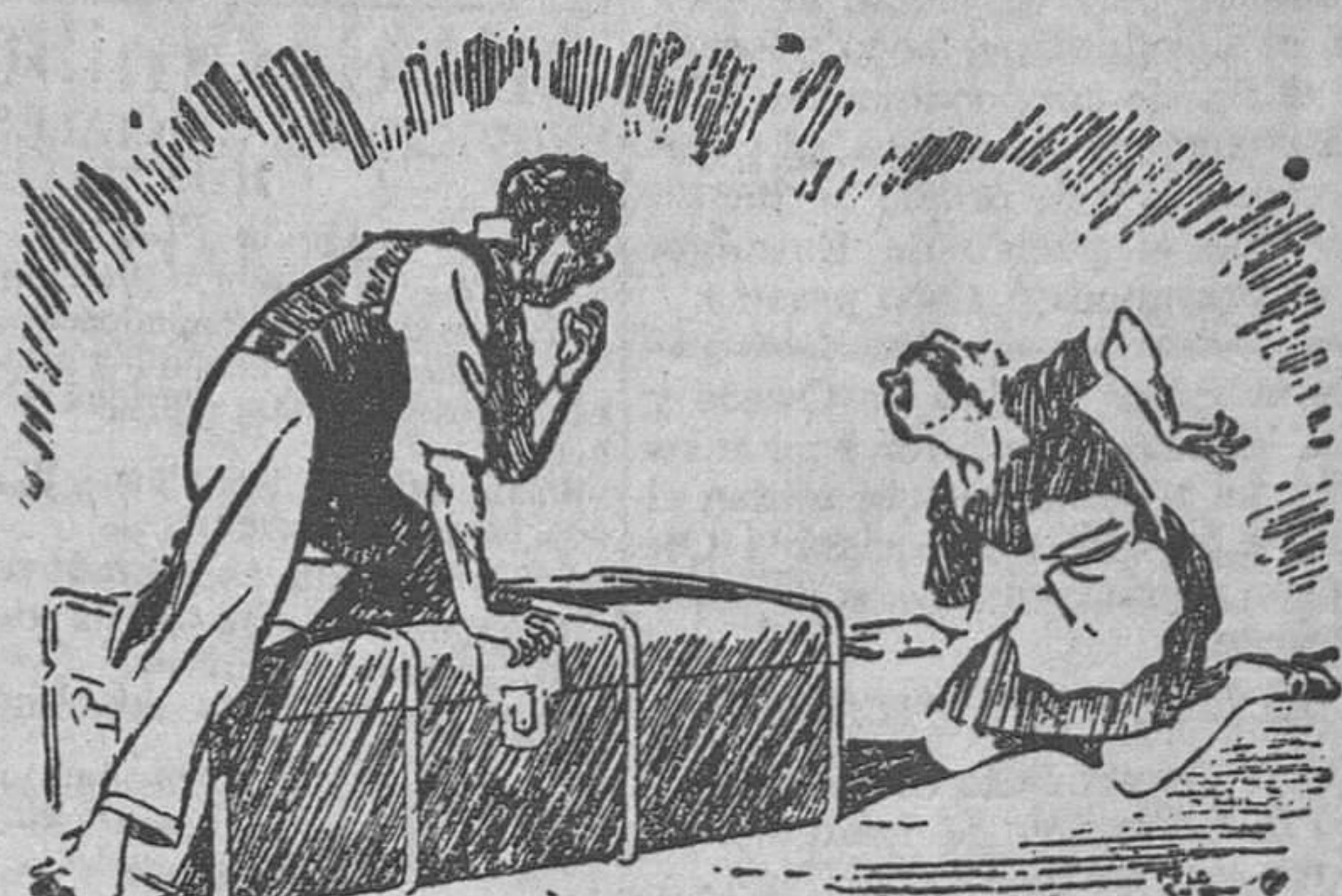
—¡Pero mujer! ¿Me vas a hacer que abra ahora el baúl, con el trabajo que me ha costado cerrarlo?