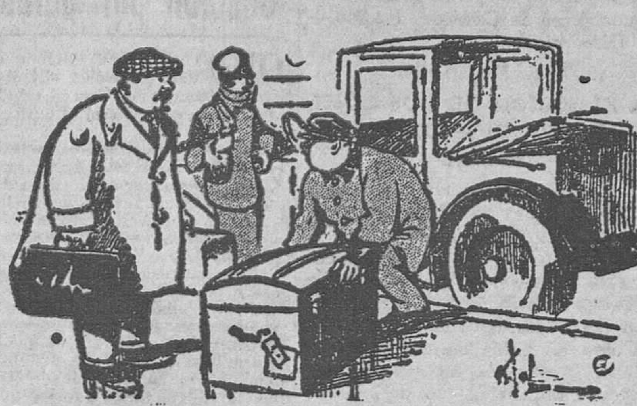
—¿Cómo pesa el baulito! —Como que son frutas y huevos que traemos del campo para el invierno.