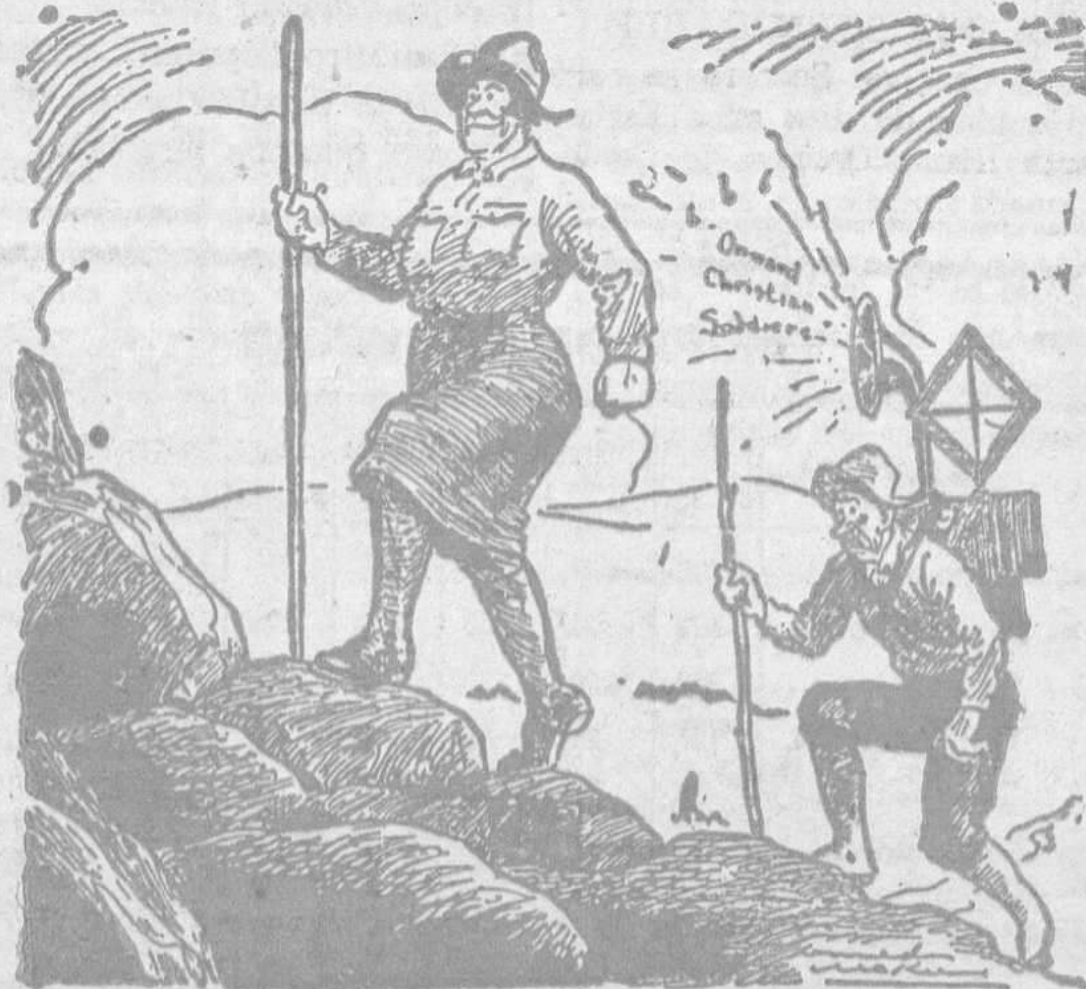
Ella.—Félix, encuentro muy agradable esalar las montañas sintiendo la caricia de la música. En lo sucesivo, siempre vendremos así.