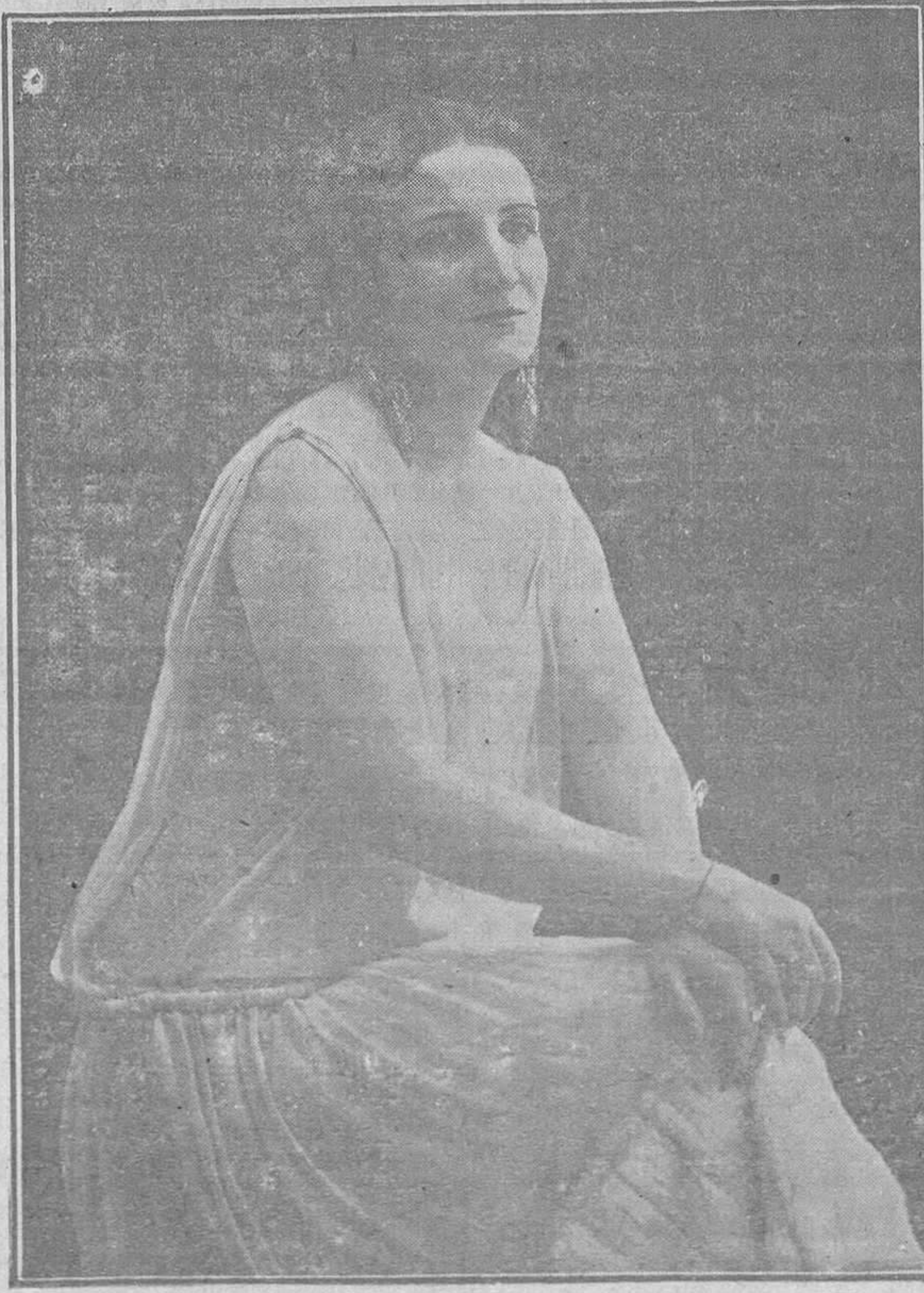
La ilustre actriz Irene López Heredia, que hoy se presentará con su compañía en el Teatro Campoamor

"INSUPERABLE" de Osoro, triunfa por su exquisita calidad.