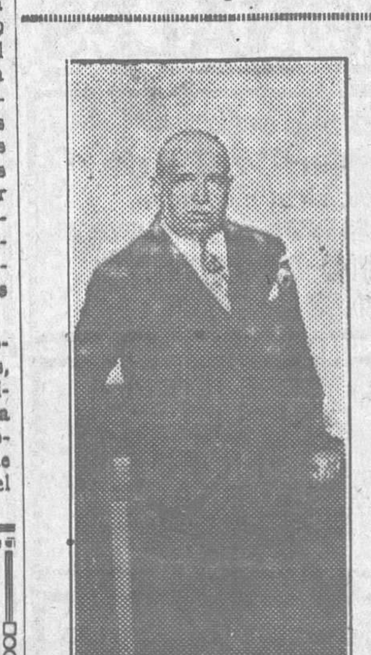
El ministro de Gracia y Justicia don Galo Ponte, que desde ayer es nuestro ilustre huésped