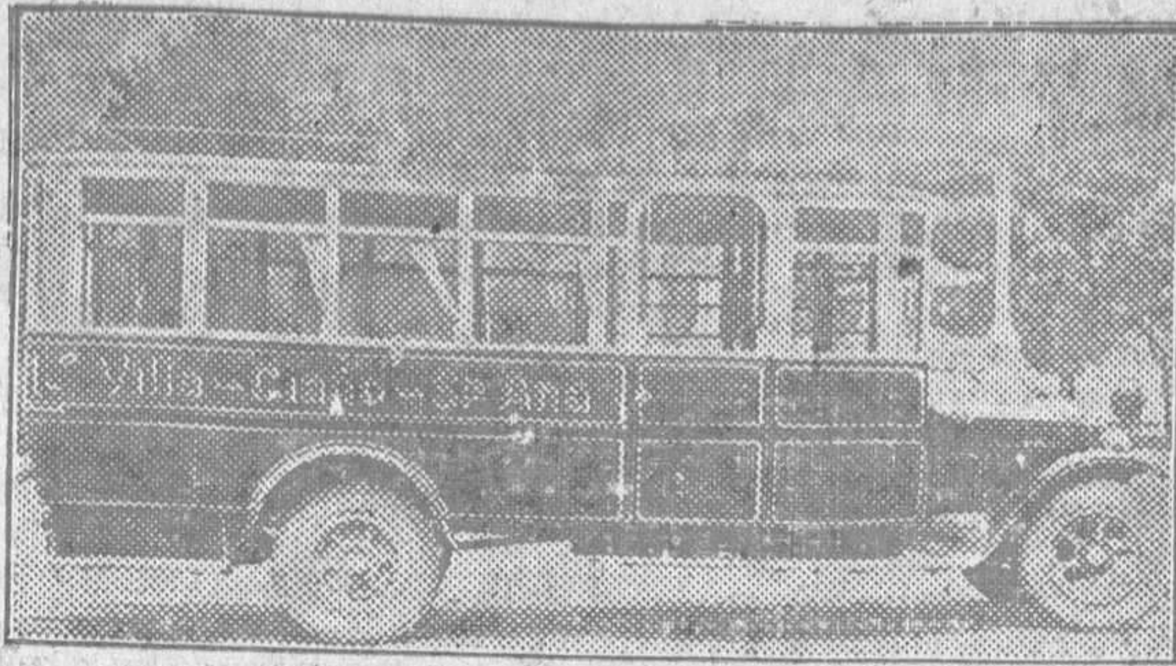
Uno de los autobuses que se han puesto recientemente al servicio público en Langreo

Y para completar todo esto, pudiera añadirse una escuelita, más bien un casa para niños de 3 a 8 años, por el estilo de la famosa "Maison des Petits", que el año pasado tuve el gusto de admirar en Ginebra y que se halla enclavada en un bosque lleno de árboles, flores y