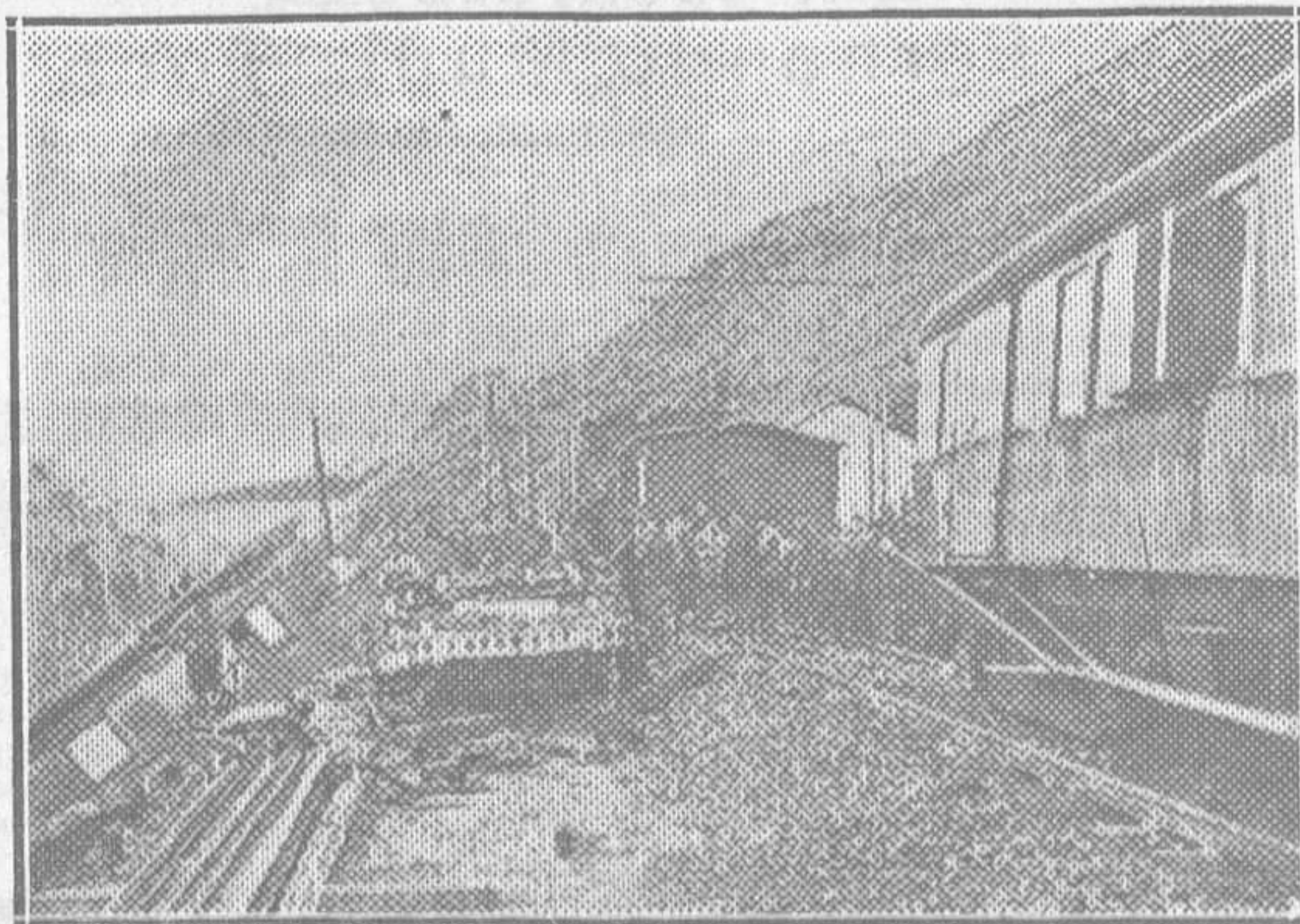
ACCIDENTE FERROVIARIO.—Estado en que quedó el tractor eléctrico como consecuencia del heroico esfuerzo realizado por el motorista para evitar una catástrofe ante un desprendimiento de tierras a la salida de un túnel en las cercanías de Fierros

—Idem al del número 8 de la calle del Ecce-Homo, para que pinte la fachada; y lo mismo al del número 10 de Cimadevilla.