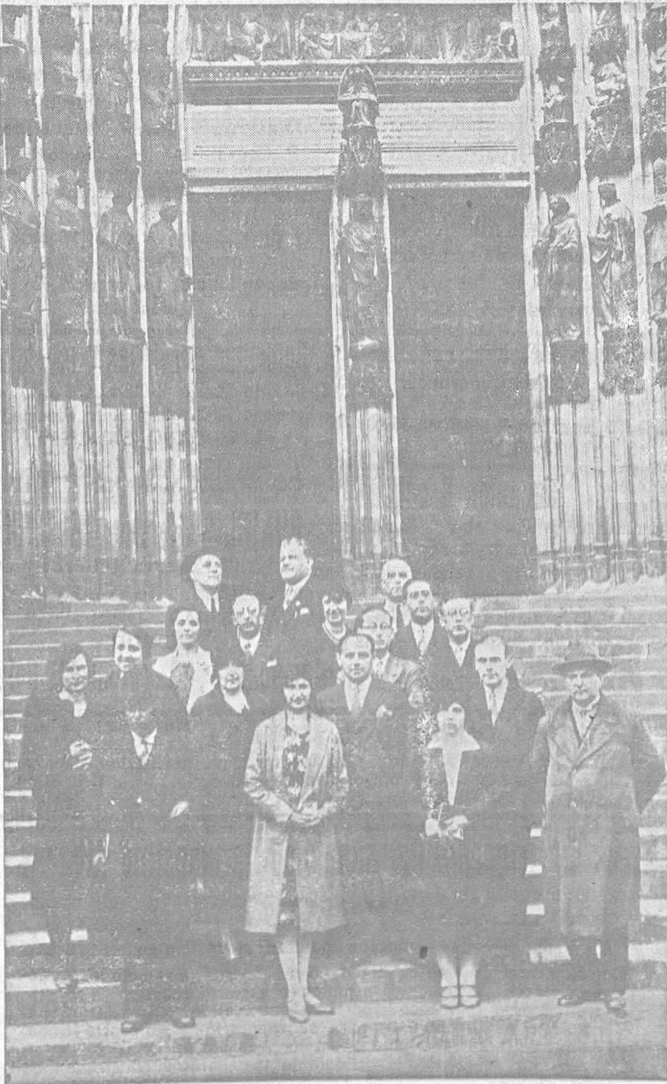
Los maestros asturianos ante la puerta de la Catedral de Colonia