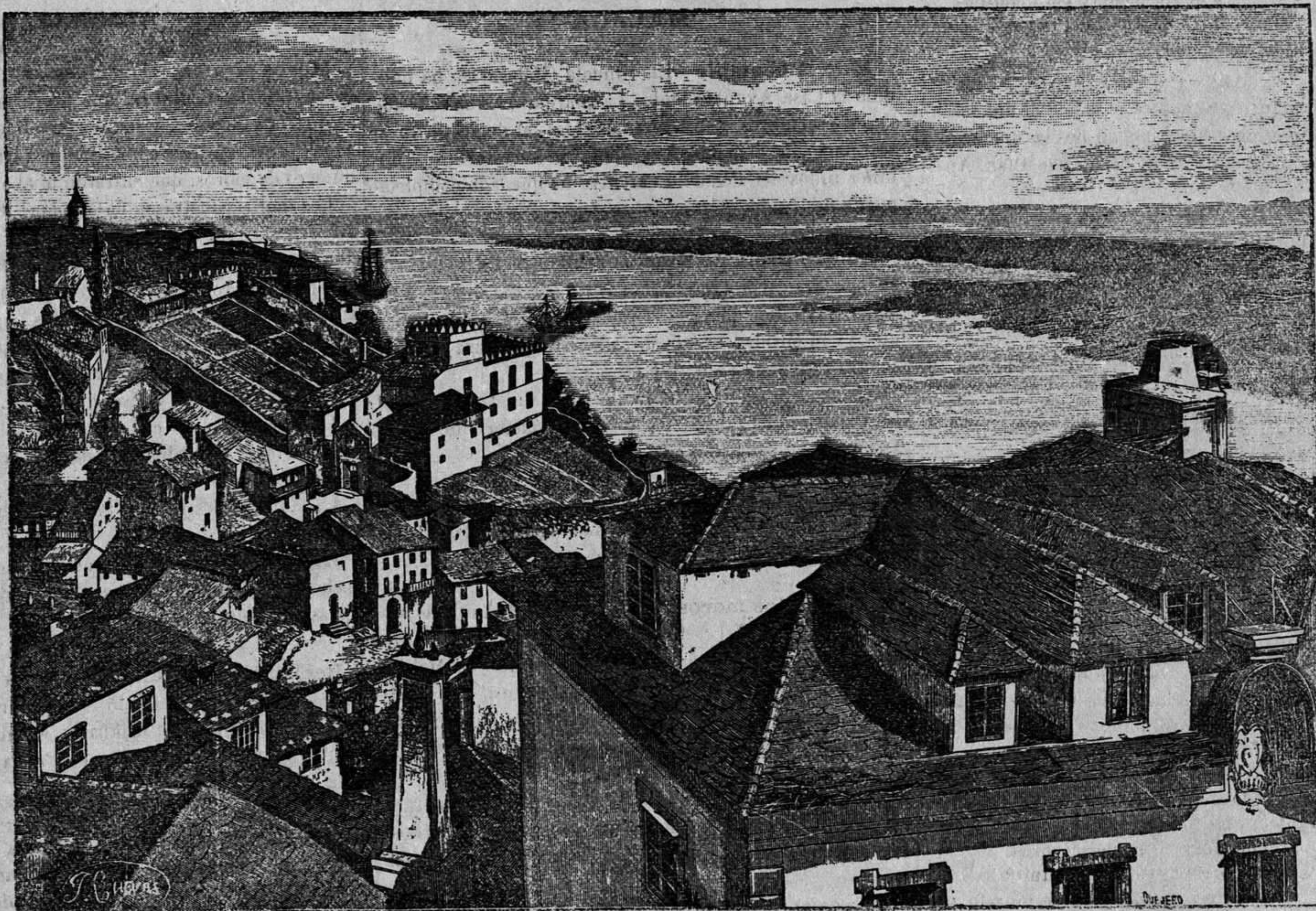
RIVADEO.—Entrada de la ria y parte baja del pueblo

Asistieron á la ceremonia fúnebre el gobernador militar, casi todos los jefes y oficiales de la guarnición y los individuos de tropa del expresado regimiento.