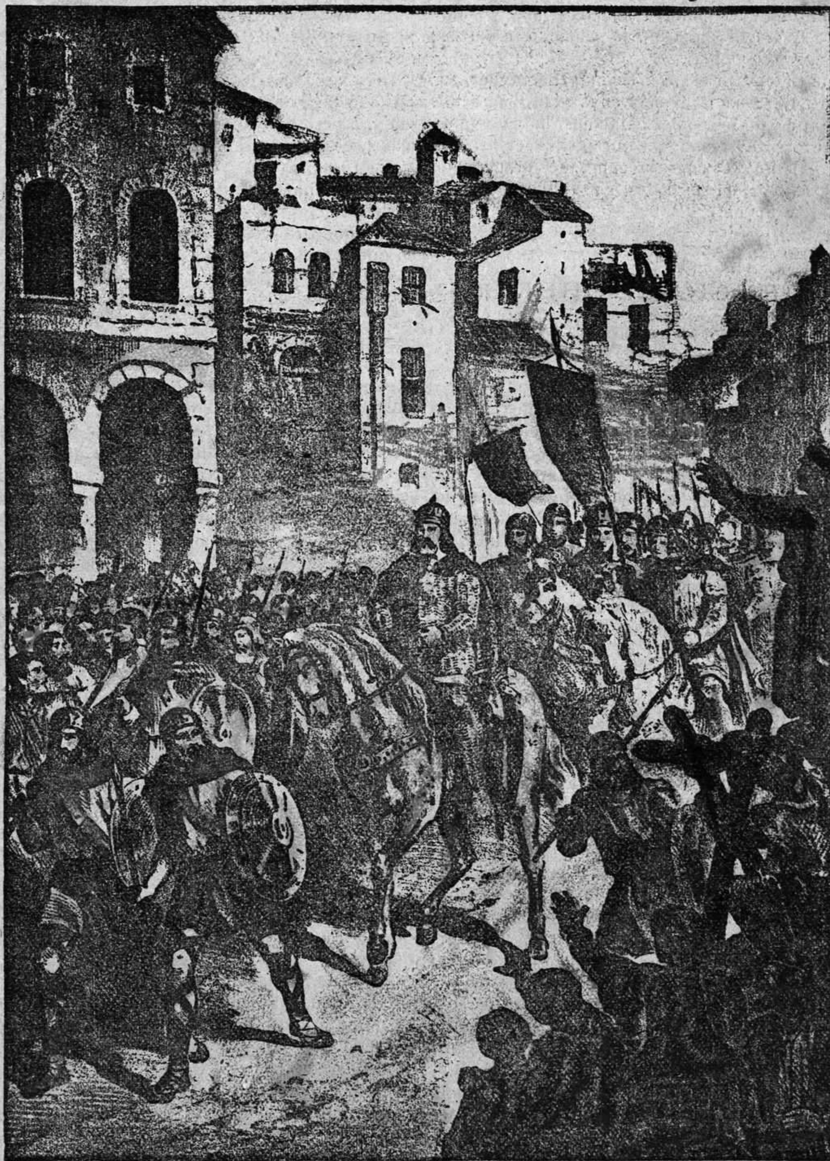
ENTRADA EN TARRAGONA, DE BERENGUER RAMON

Bien pronto la antiquísima ciudad de las ciclópeas murallas vió llamar á sus puertas la valerosa hueste catalana, y no se pasó mucho tiempo sin que el estandarte de la cruz ocupase el lugar en que por espacio de tantos años había ondeado el del Profeta.