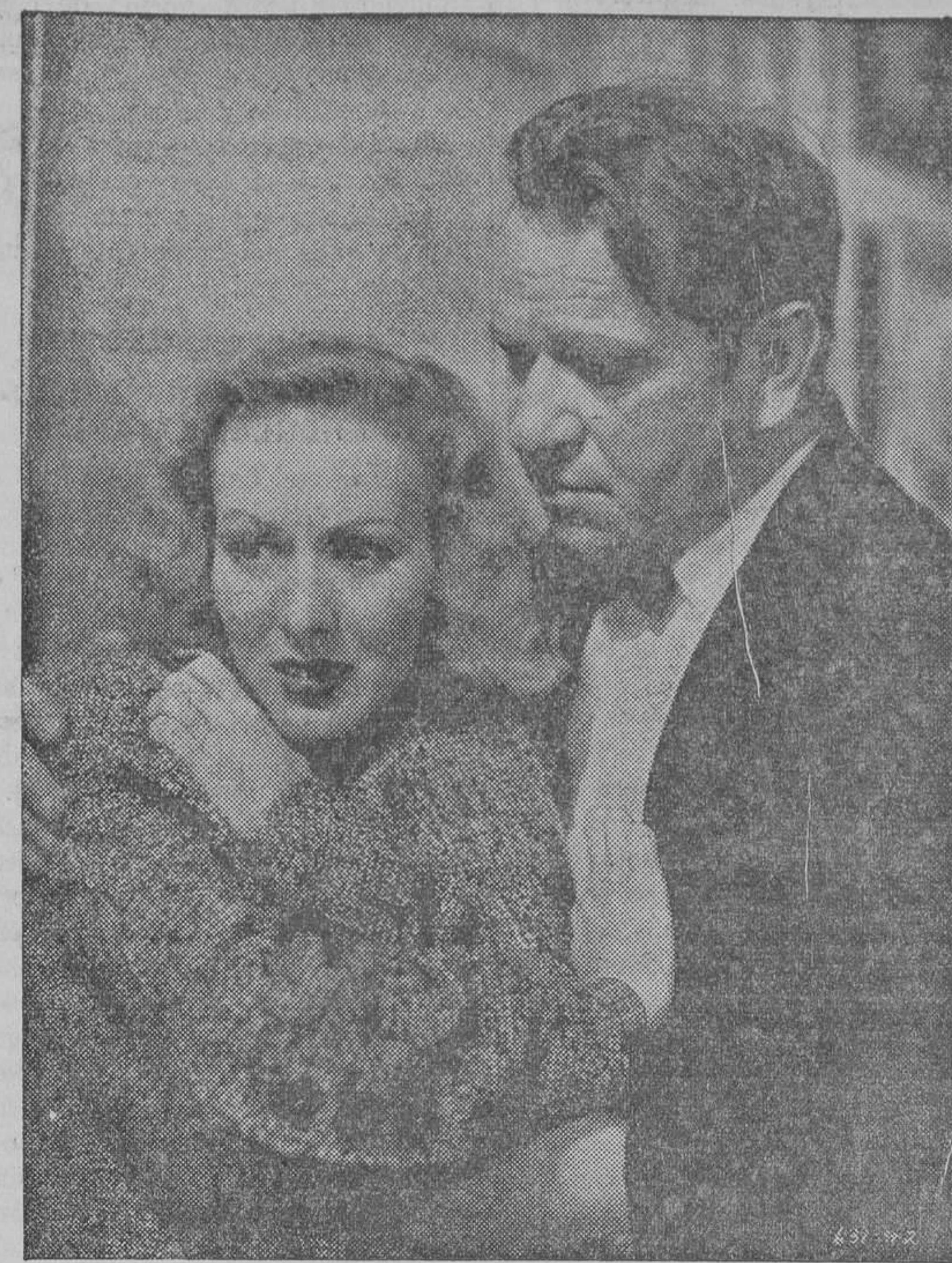
Wallace Beery y Karen Morley, en uno de los momentos de la emocionante película «Carne», que se estrenará el lunes próximo en el Capitol

Por causa de un mono por poco ocurre una tragedia a bordo del yate «Invader» que formaba parte de la expedición a los mares del Sur, para filmar «El Robinson Madero», de Douglas Fairbanks.