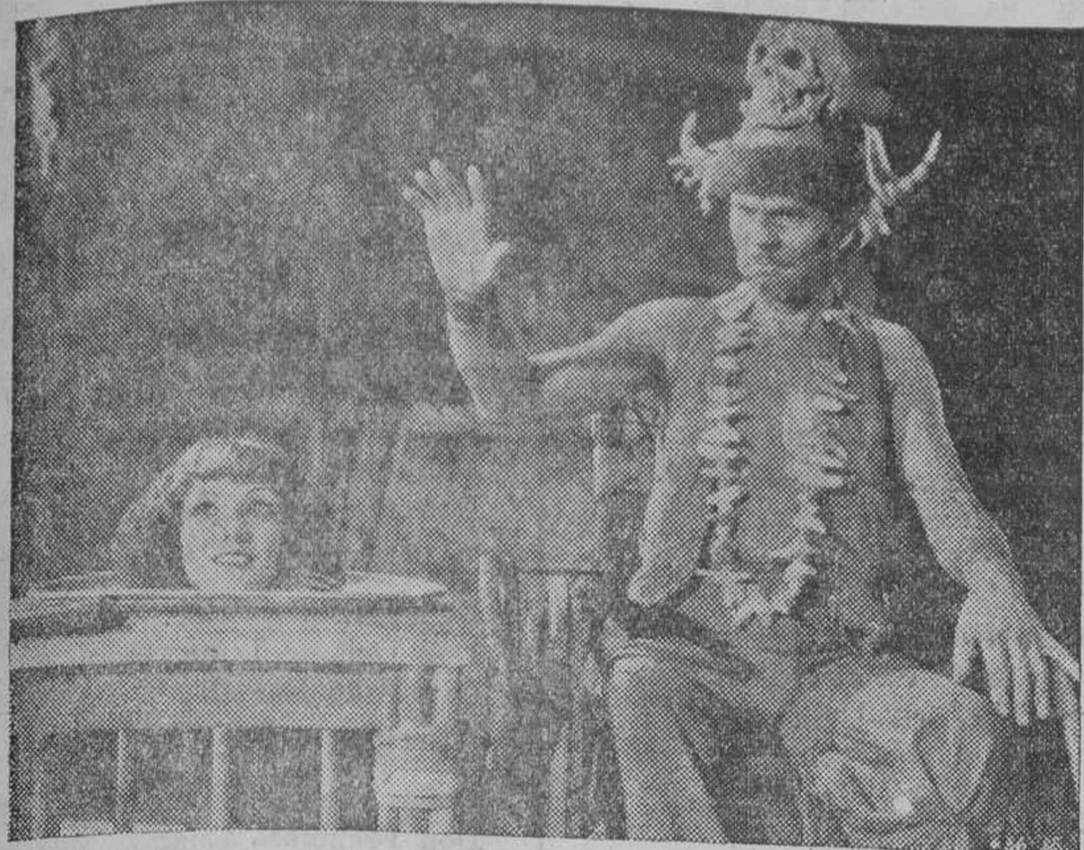
Una impresionante escena del film exótico «Kongo», de Metro Goldwyn Mayer