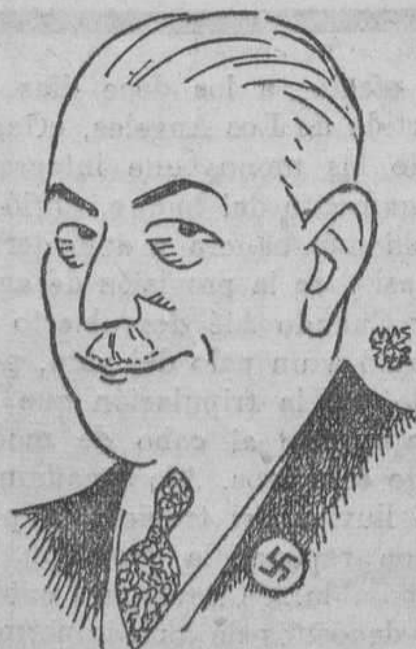
Constantine Von Neurath, ministro de Estado de Alemania

Esta Sociedad se ha comprometido a edificar, en el plazo máximo de un año, un frontón en Viena, otro en Los Angeles y otro en Shanghai, y está dentro de lo posible que en España edifique un par de ellos.