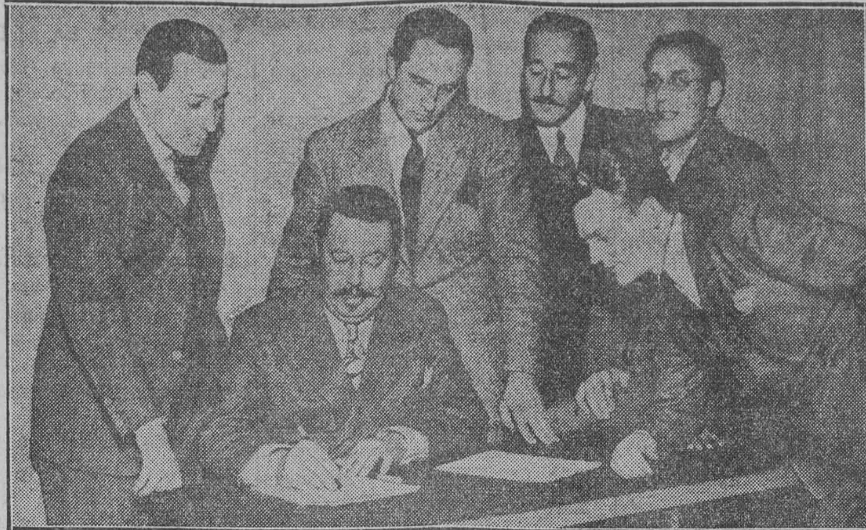
Grupo de actores de la pantalla firmando un Manifiesto de protesta contra el Código industrial del Gobierno Roosevelt, que limita sus ganancias, y que ya publicamos en nuestro periódico. De izquierda a derecha: George Raft, Warner Oland (sentado), Frederic March, Adolph Menjou, Groucho Marx y James Cagney (inclinado)