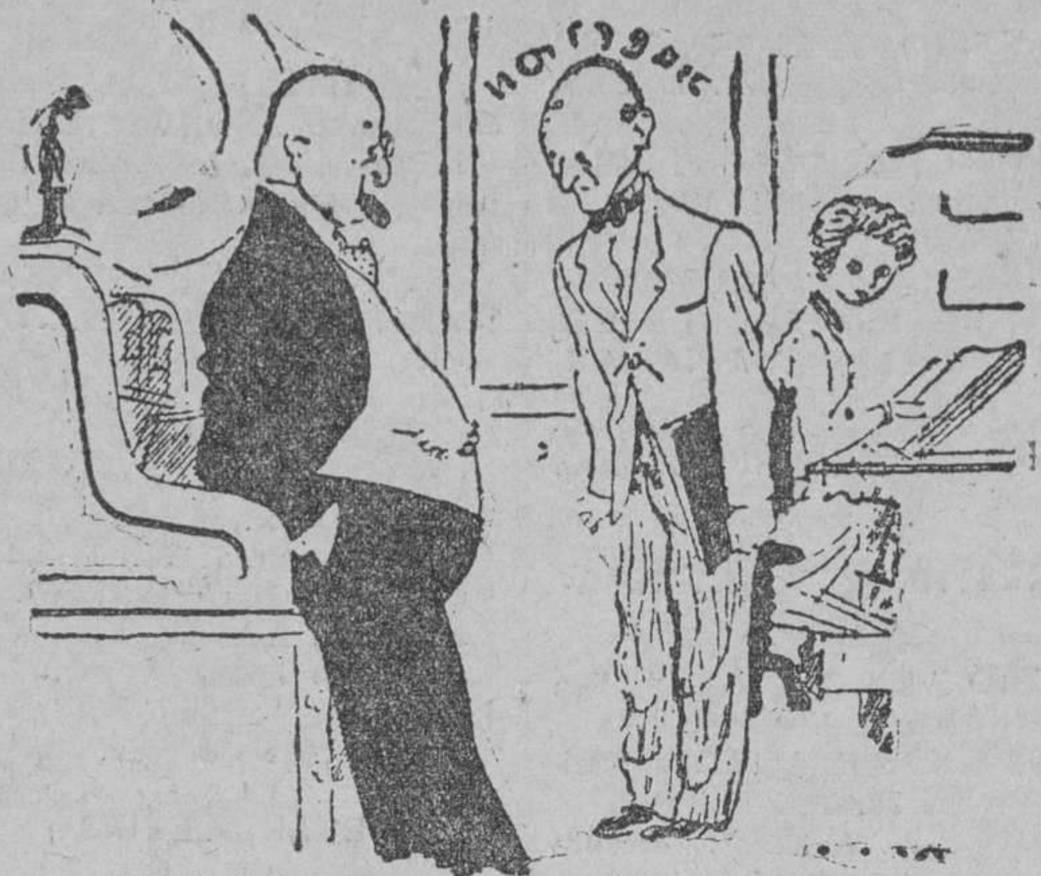
—Es usted un excelente empleado y merece ganar más. —Qué bueno es usted, señor director! —Por eso le aconsejo que busque otra casa donde le den más sueldo.

Los autores, que asistieron al estreno, fueron aclamados por el numeroso público que llenaba el teatro, viéndose precisados a dirigir la palabra para agradecer las muchas ovaciones que sonaron en su honor.