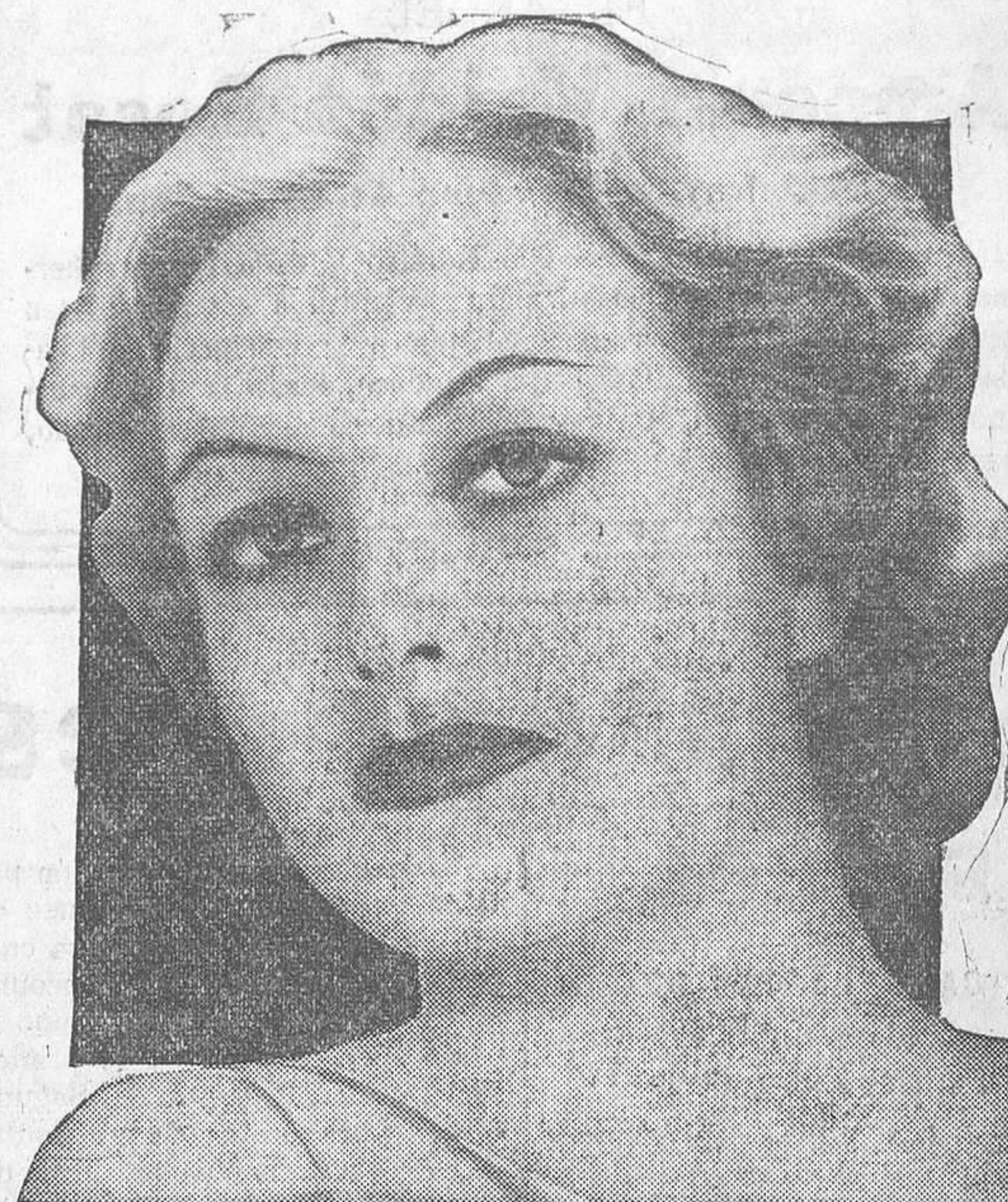
JOAN CRAWFORD Metro-Goldwyn-Mayer Picture