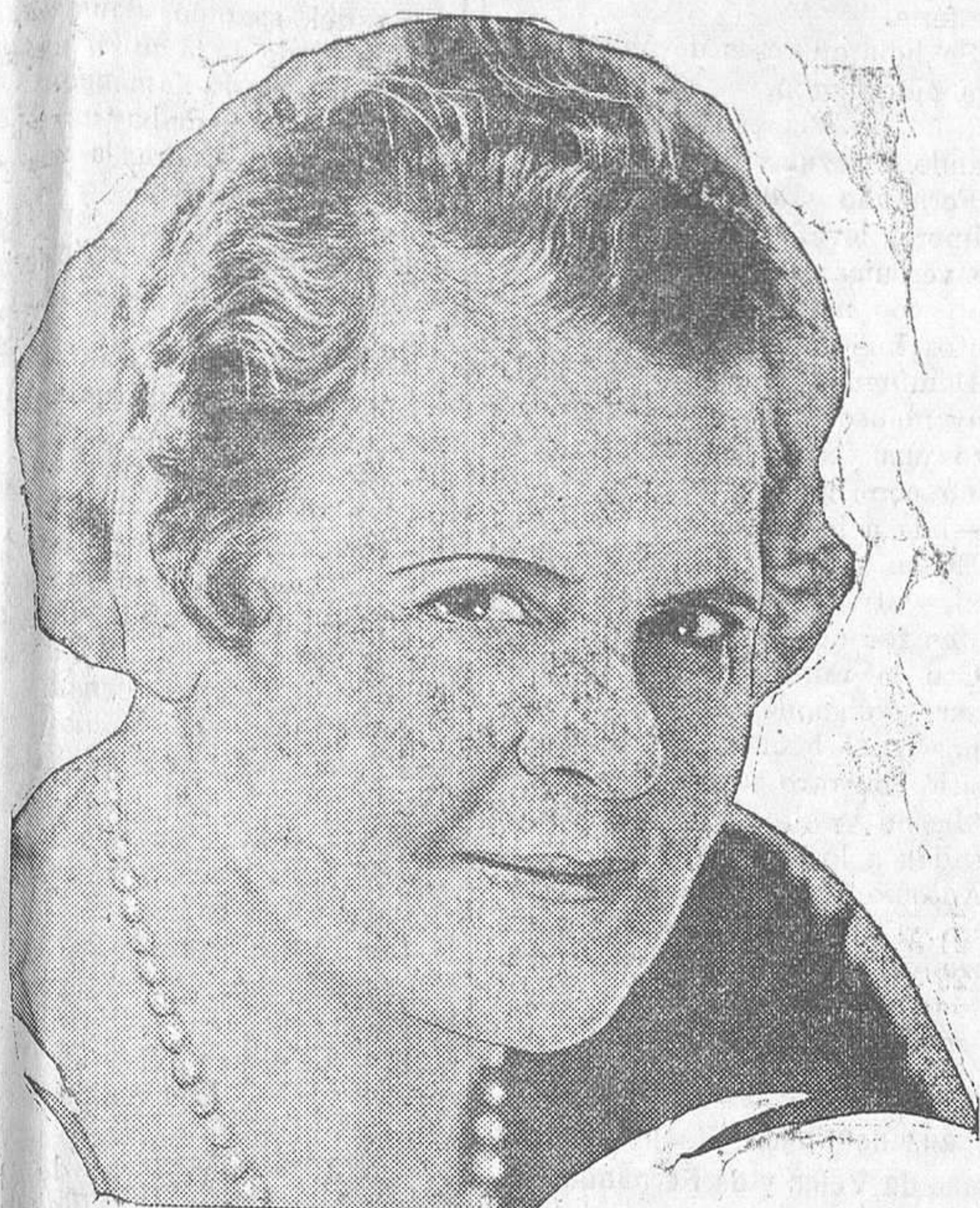
MARIE DRESSLER Metro-Goldwyn-Mayer