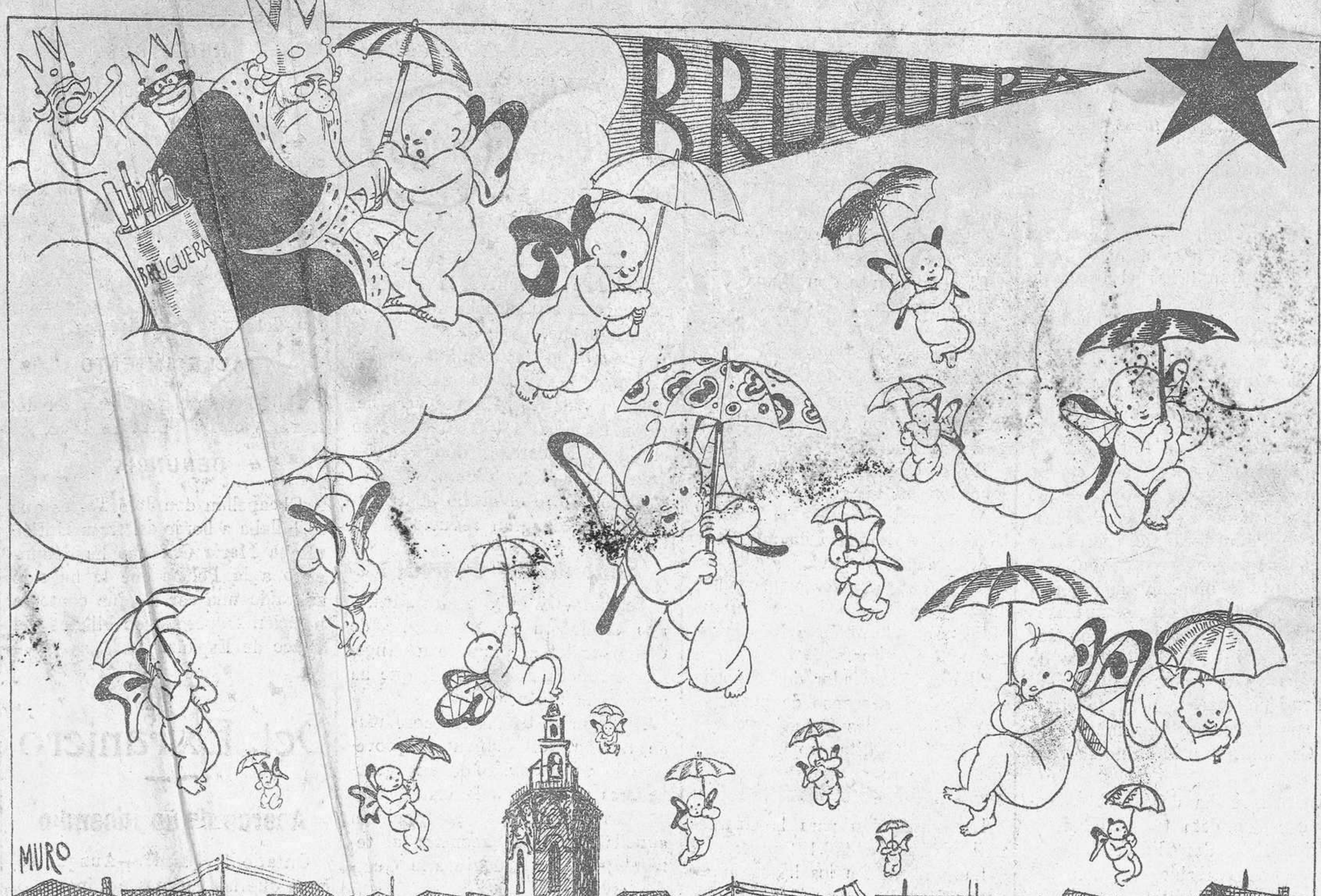
Los Reyes y la casa Bruguera