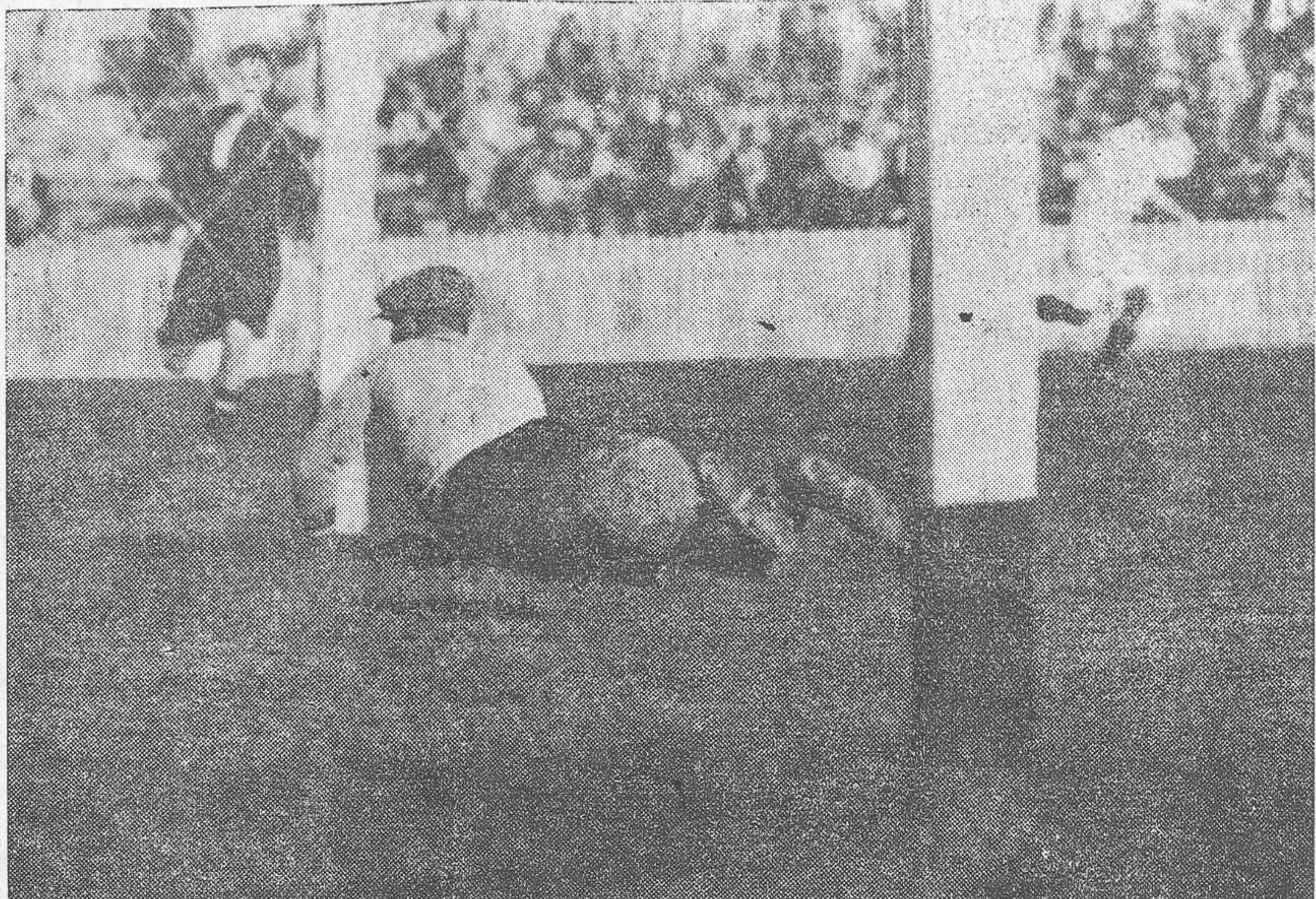
Uno de los siete goals marcados por el Valencia