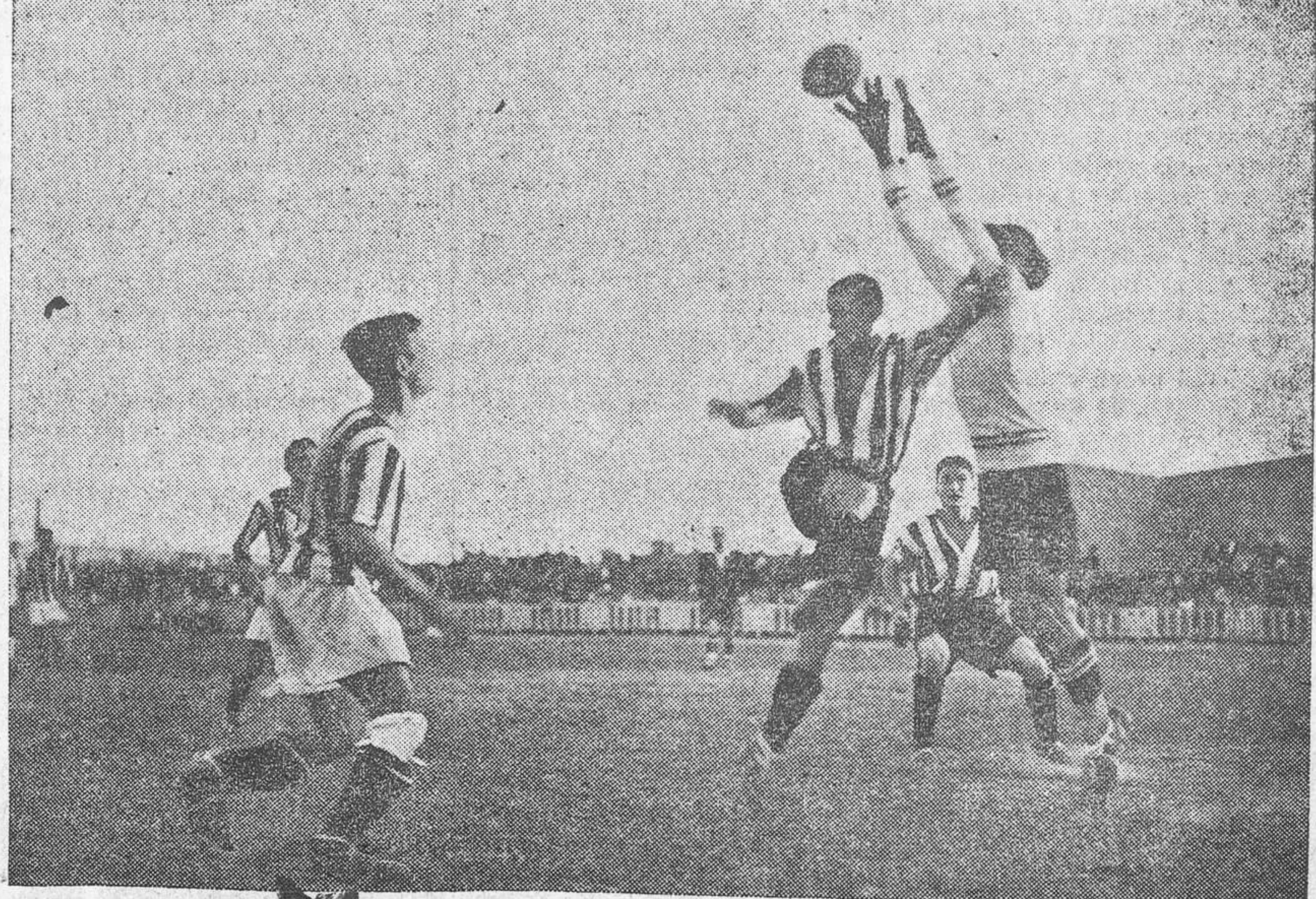
Alanga despeja acosado por Cervera