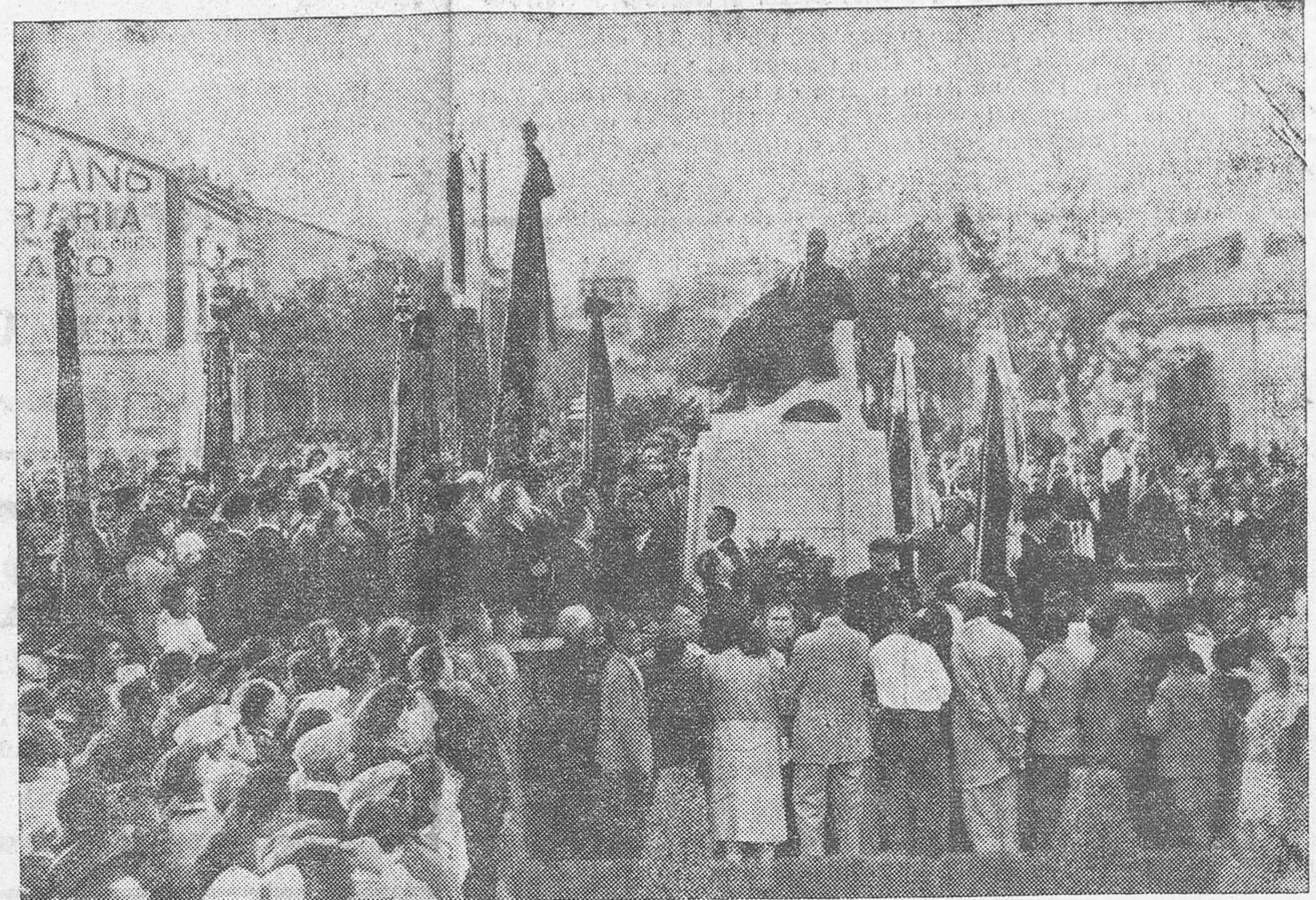
Momento de ser descubierta oficialmente la estatua a la memoria de Lamberto Alonso

Resultaron de una atracción irresistible los actos culturales celebrados ayer en Godella, verdadero símbolo del progreso ciudadano de sus habitantes. Tuvieron menos de solemnidad oficial que de carácter efusivo, y por eso se comen-petró el pueblo con los organizadores y contribuyó al éxito con su presencia y con sus aplausos. Nosotros sentimos que los apremios del lunes nos vedan dar a la reseña de aquellos actos la amplitud que merecen, pero ello nos resulta materialmente imposible. A las cinco de la tarde comenzaron a congregarse al pie del monumento al maestro Alonso (de cuya obra, así como de su emplazamiento, ya tienen noticia nues-