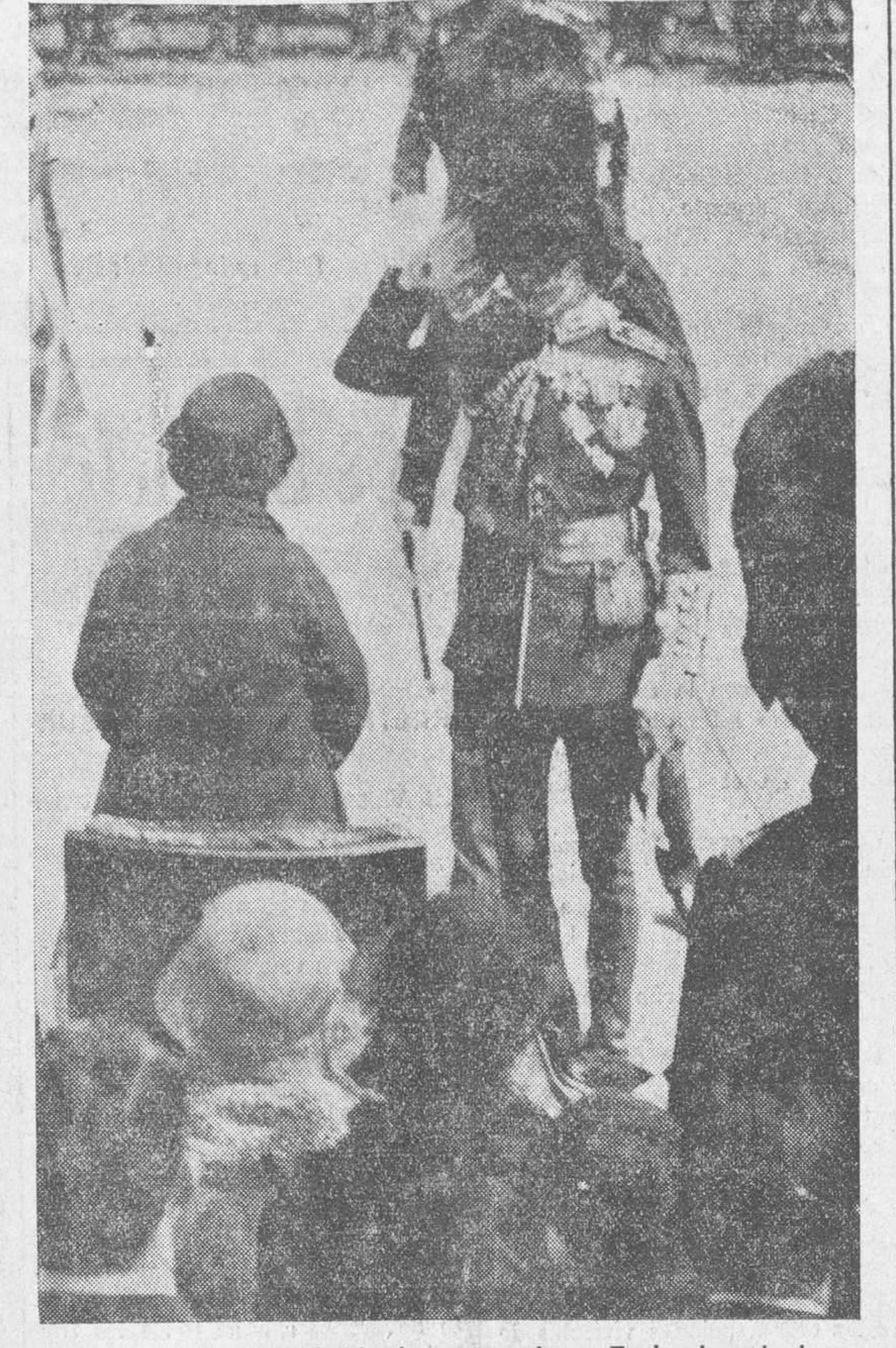
El príncipe de Gales, hablando con madame Foch, durante la ceremonia de inauguración de la estatua del mariscal Foch, en Grosvenor Garden