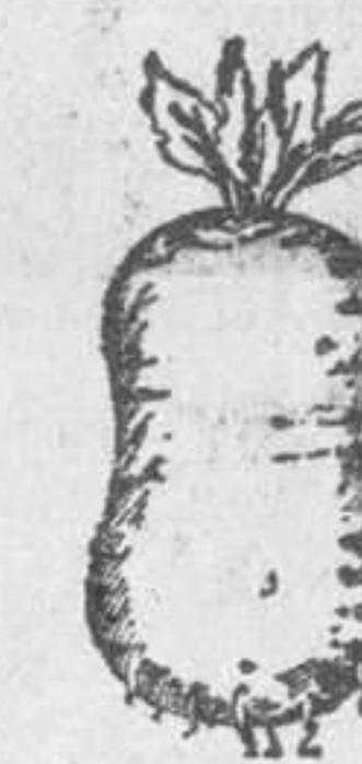
Remolacha gigante forrajera

En todos los buenos establecimientos de artículos fotográficos que visite usted, le mostrarán los últimos modelos "Kodaks". Autográficos, y admirará las perfectas fotografías que con ellos se hacen. "Kodaks", desde 56 pesetas; "Brownies", para niños, desde 24 pesetas. Kodak, Sociedad Anónima, Puerta del Sol, 1 - Madrid.