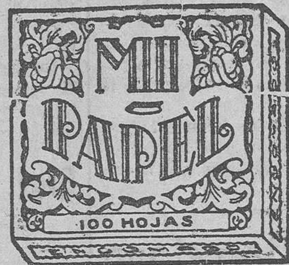
(MARCA DE FABRICA)

QUITESELO USTED DE LA CABEZA y llévelo a INNOVATION, que allí se lo dejarán como nuevo JORGE JUAN, 22 (frente Mercado Colón)