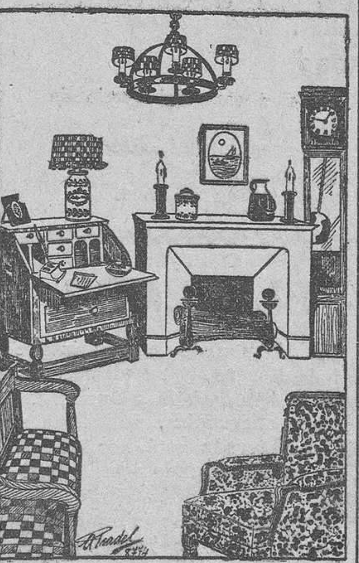
Elegante salita de recibir.